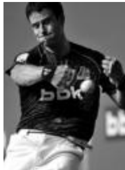
Barriolak aurrera jarraitzen du. HITZA