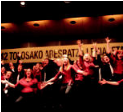
Salt Lake Choral Artists Chamber Choir taldeak polifoniaman eta folklorea lehen saria jaso zuten. e. lizaso

Ahots nahasiak folklorea • 1. Salt Lake Choral Artists Chamber Choir (AEB). • 2. Coro de Camara Mikrokosmos (Frantzia). • 3. Berdimeta: Hodeiertz-Oroith (Euskal Herria) eta University of Delaware Choral (AEB).