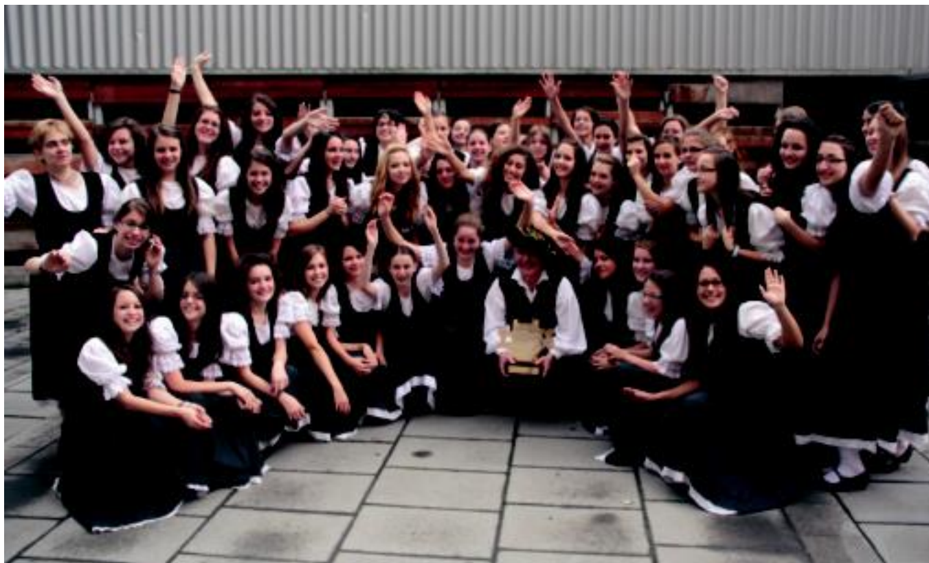
Sari Nagusia nork irabazi zuen herenegun iluntzean jakin baldin bazen ere, Cantemus-eko abeslariak atzo oholta gainean jakin zuten albistearen berri, zuzendariak ez baitzien esan. A. IMAZ

ETXEKOAK Hodeiertz eta Oroith abesbatzek osatutako taldeak hirugarren postua lortu du folklore sailean 4-5