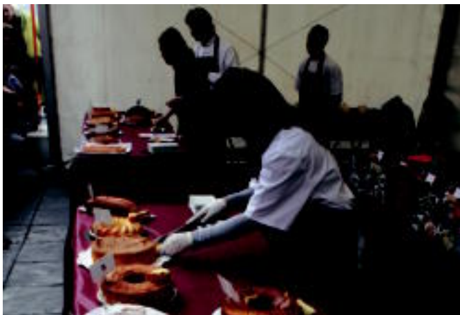
23 bizkotxo aurkeztu ziren lehiaketara. I. GARCIA

Bere aldetik, txurroak ere banatu zituzten Tolosako txurrieriak, 2015 txurro, hain justu. Bezero batzuk ez zekiten doan jasoko zituztela eta harriritu hartzen zituzten txurro gozoak.