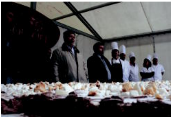
Anima Vocal Ensemble taldeko abeslariak pastel errusiarren banaketa girotu zuten. Gozogileek ehunka zati banatu zituzten jendearen artean.