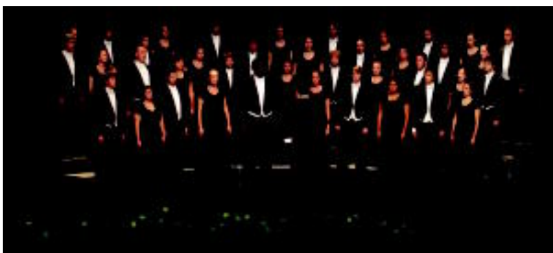
Ameriketako Estatu Batuetako Salt Lake Choral Artists Chamber Choir atzo Leidorren. A. IMAZ