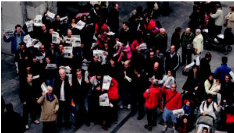
Familia argazkia atera genuen atzo Tolosako Trianguloa plazan dagoen Gaztelako atean. A. IMAZ

PROIEKTUA Aro berria azaroaren 5ean hasiko da; aurkezpen ekitaldia ostegunean egingo dute Andoainen 7