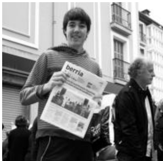
Heldu nahiz gazte, biak euskaltzale amorratuak. Norbanakoez ere bere karpenean garrantzitsua egin diote proiektu berri honi. A.I.