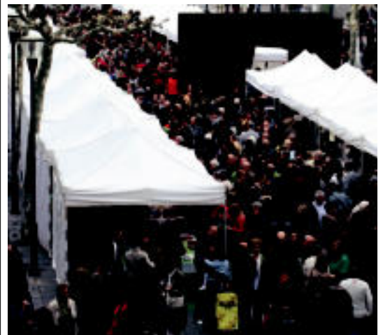
Jendetza gerturatu zen Trianguloara, postuak ikusteko ere arazoak sortuz. A. I.