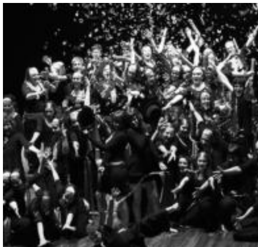
40 neskez osatzen dute Gasteizko Crescendo abesbatza. HITZA

Alde horretatik bai, aitzindariak izan gara, eta lehendabizikoak, bide hori jarraitzen. Azken batean, Europa iparraldeko sistemari oinarritzen gara, non, maila goreneko abesbatza eskolak dituzten, eta horretan bakarrik aritzen diren profesionalak dituzten irakasle gisa. Hala, ahotsaren bitartez, musikaren inguruko heziketa oso landua jasotzen dute. Gu duela 24 urte hasi ginen lanean, baina orain dela hamar hartu genuen bide hori. Zortzi ikastolatan ari gara lanean, eta bakoitzean maila ezberdinak daude. Orotara 25 talde dira. Proiektuan parte hartu nahi duten zentroekin jartzten gara harrema-