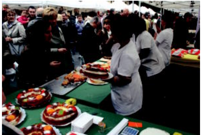
Trianguloako postuek lan handia izan zuten atzokoan. I. GARCIA

Bizkotxoak, krema gurinarekin eta errusiar pastela erabiliz egin zuten oinarria. Gero gaineratik trufa eta esne-gaina bota zieten eta horren gaineratik berriz pastel errusiarra. Gozogle bakoitzak bere zatia