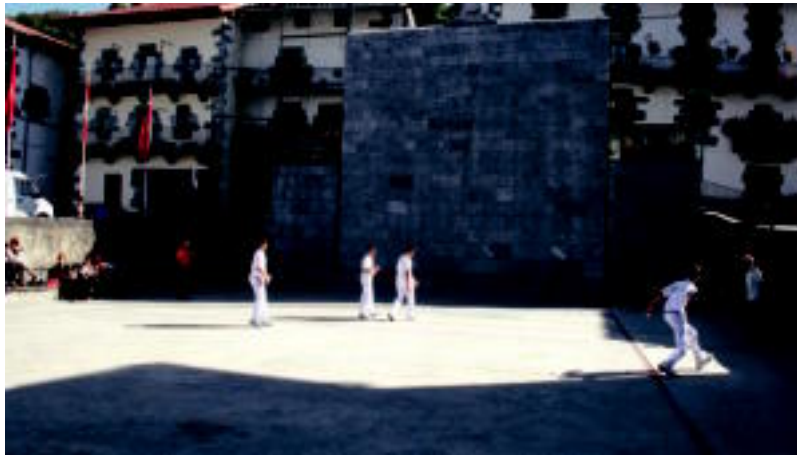
Leitzaiko plazan dagoen ko frontoian pilotariak partida jokatzen. ASIER IMAZ

Bada zer kontatua, luzea baita pilotaren historia Nafarroan. Lehenagotik ere jokatu zuten, baina 1331koa da pilotaren inguruko lehen aipamen idatzia. Zangozan ematen du, ordea, Pilotaren Ibilbideak lehen botea. Hangoa da, izan ere, Nafarroan pilota partida bati buruz dauden lehen testuetako bat: 1562koa. Dirudenez, herrita-