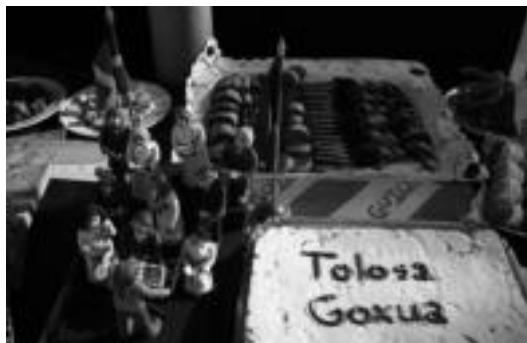
Abesbatza Lehiaketa eta Tolosa Goxua elkartuko dira larunbatean. A. IMAZ

Gozogleek hori kontuan izan dute eta errusiar pastel erraldoi bat egiteko asmoa iragarri zuten atzoko aurkezpen ekitaldian: «errusiar abesbatzen omenez bertako pastel erraldoi bat egingo dugu; eta pastel goxo hau bertaratutakoaren artean banatzeko garaian, errusiar abesbatza ere bertan egongo da kantari.