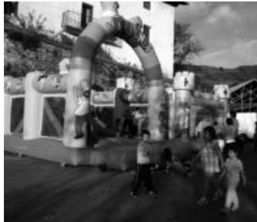
Larunbatean haurrei zuzendutako ekitaldiak izango dira. E. MAIZ

Honekin, bide batez, erakutsi nahi dute, «egitarau aberats bat egiteko, askotan ez dela emanaldi ikusgarri bat egin behar, eta etxe