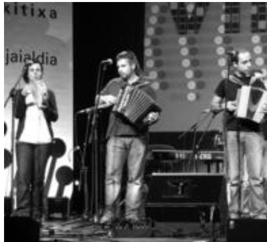
Orain bi urte Igorreko Arantzarte taldeak jo zuen.