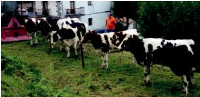
Abereak ikusmin handia sortu zuten; taberna atzeko zelaian jarri zituzten hauek denak ikusgai. HITZA

Belauntza » Bertako nekazal produktuez gain, abereak, artisau lanak eta bigarren eskuko tresnak ere jarri zituzten salgai.