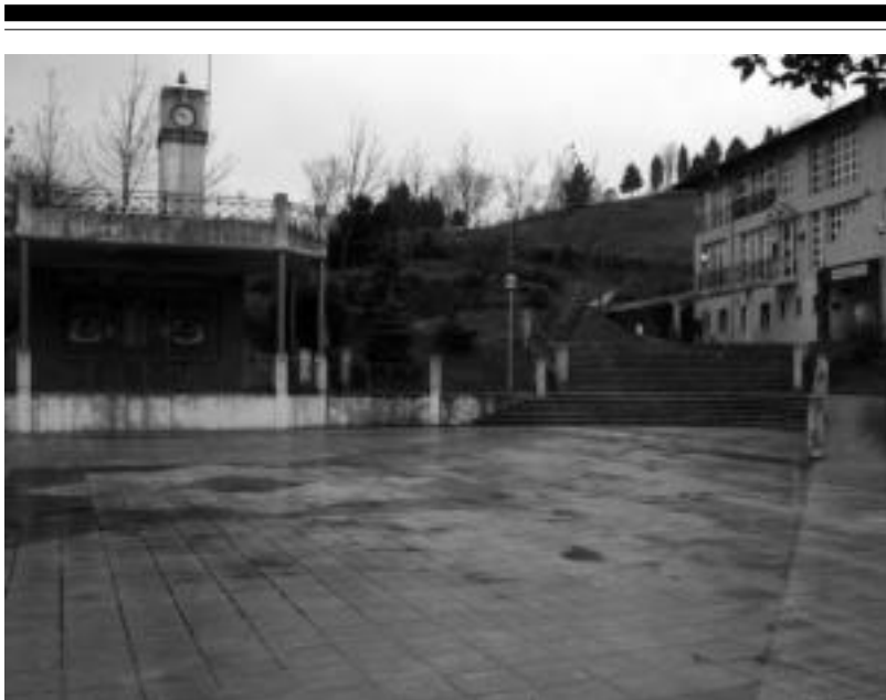
Plazaren inguruan eraikiko dituzte tasatutako 42 udal etxebizitzak. IMANOL GARCIA