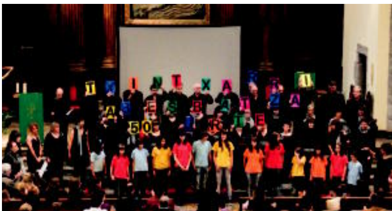
Txintxarri eta Txintxarri Txiki abesbatzakoak elizan egindako emanaldiaren une batean.

TOLOSA Udalak eta Mintzola Fundazioak ahozko euskara eta gazteak uztartuko dituen 4 urteko ikerketa egingo dute 2