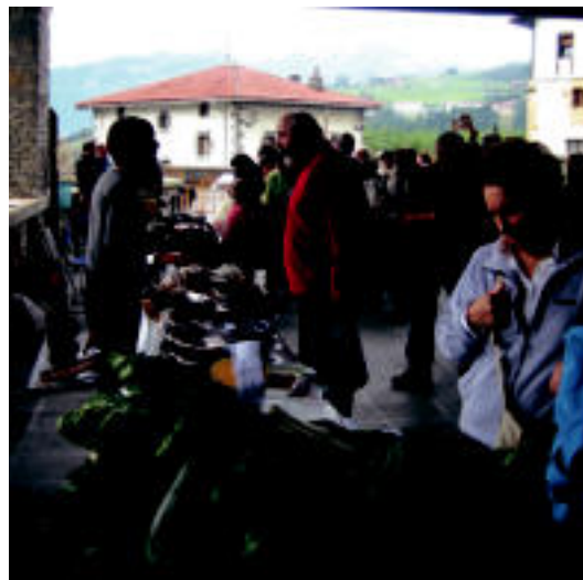
Denera zazpi postu jarri zituzten herritarren artean. HITZA

Orain, partaide eta herritarrei zer hobetu behar den galdetzeko asmoa dute antolatzaileek. Bestetik, herritar gehiagok postuak jartzeko neurriak hartuko dituzte.