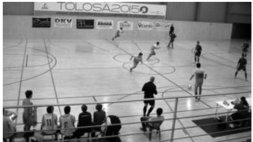
Asteburu honetan Bilbo talde indartsuaren aurka jokatu du Laskorainek.

Bigarren eta hirugarren taldea Laskorain Ikastolaren bigarren taldeari dagokionez, 2 eta 1 galdu zuten Anoetan eta hirugarren taldeak 3-3 berdindu zuten.