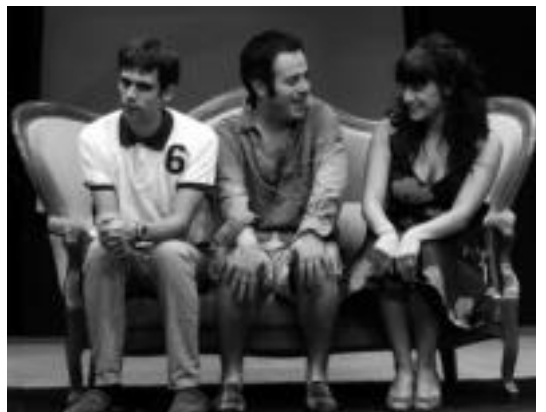
Usabiaga, Garlartza eta Cozar aktoreak izango dira ostiralean. F. DE LA HERA

ZIZURKIL • Zizurkilgo Udalak, zizurkildar kirolari txapelketei errekonozimendu xume bat egingo die. Abenduan antolatzen den Kirol astearren baitan izango da. Errekonozimendu hori jasotzeko baldintzak hauek dira: Zizurkildarra izatea, Zizurkilaren bitzitza edo Zizurkilekin harreman berezia izatea, 16 urte edo gehiago izatea eta Gipuzkoako txapelketa edo probaren batean emaitza onak eskuratu izana. Proposamenak edozein herritarrek bidali ditzake Udala bulegoetara. Telefonoz 943 692 495 deituta edota kultura@zizurkil.com helbidera idatzita.