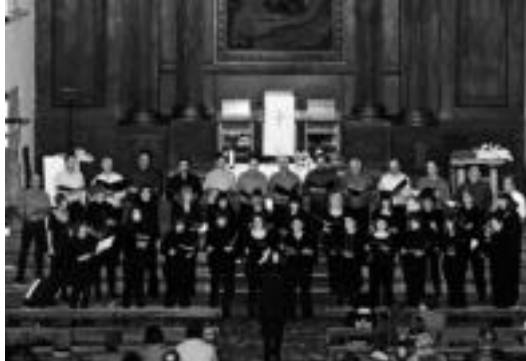
Txintxarri abesbatzaren emanaldia aurreko Eguberrietan. EDUARDO ARRAYET

Alegia » Etziko meza nagusiaren ondoren, 12:30ean, kontzertua emango du Txintxarri Abesbatzak parrokian.