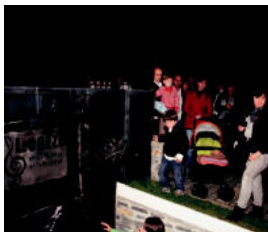
Musika Eskola inauguratu zuteneko unea.

IBARRA Alurr dantza taldeak ikuskizun berria estreinatuko du datorren abenduaren 10ean Tolosako Leidor aretoan 5