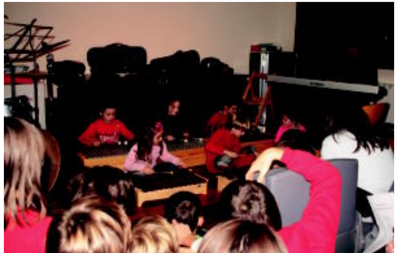
Haurrek emanaldi txiki bat ere eskaini zuten atzokoan. E. MAIZ

Guztira 165 m 2 -ko azalera hartu dute. Bi solairuek antzeko itxura izango dute: bi gune nagusi izango dituzte eta dagozkien zerbitzuez hornituta egongo dira. Sotoan musika irakasteko bi gela egongo dira. Lehenengo solairuarekiko sarbide independentea izango du. Horretarako, arrapala egingo da, mugikortasun urriko pertsonen ere sar-tu ahal izateko.