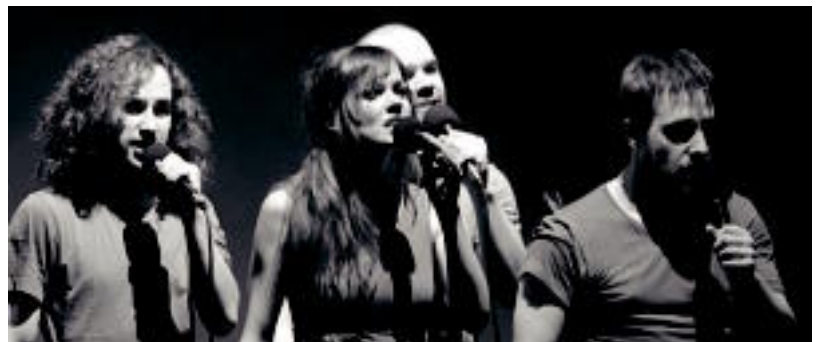
Gaur Villabonako Gurea antzokiko taula gainean izango diren lau kideak. HITZA

Demode Quartet antzezlan musikala euskarara egokitzeko lanak