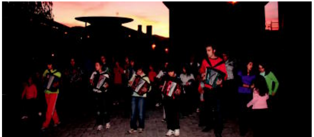
Musika Eskola inauguratu baino lehen Loatzoko ikasleek kalejira egin zuten herrian zehar.