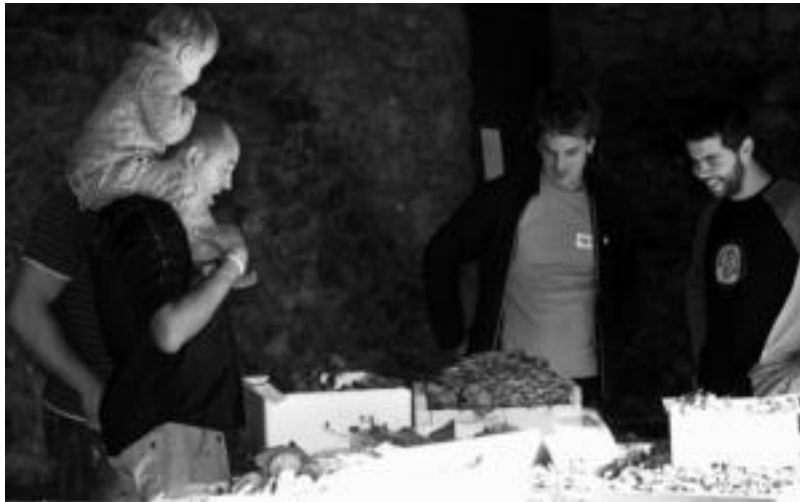
Igande goizean, egun hauetan, Leitza inguruan aurkitutako perretxiko espezieak sailkatuta jarriko dituzte.

Hori dela eta, egun hauetan, Erleta eskolako ikasleak mikologiarekin lotutako marrazkiak dira egiten egun hauetan. Ondoren, denak bildu eta lehiaketa bat egingo dute. Lanak, perretxikoekin batera,