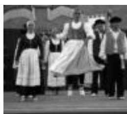
Udaberriko dantzariak.

Langileek hilean 10 euro ordaindu beharko dituzte eta ikasleek, aldi, 5 euro.