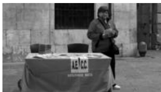
Udaletxean begizta arrosa jarri zuten eta Trianguloan informazio mahaiak ere izan zen atzokoan. R. CALVO