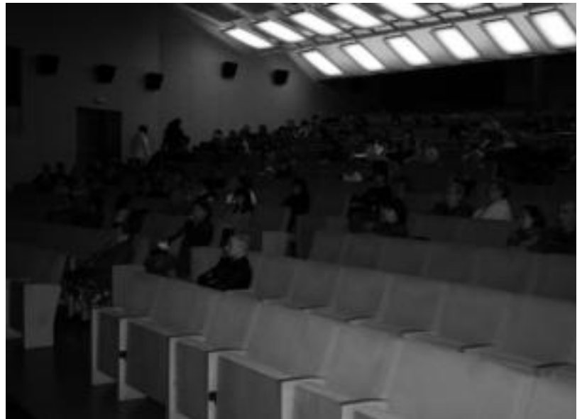
Leidor aretoan ehun lagun inguru elkartu ziren Etxebidek zozketan.

naturik aurkitzen ziren. Denek ez zuten beraz, etxebizitza lortzeko aukera berdina.