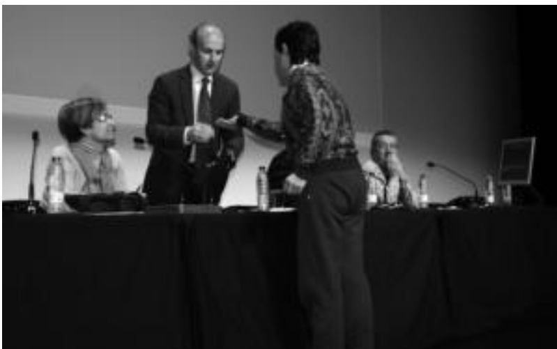
Esribauak herritarren laguntza izan zuen zozketa uanean.