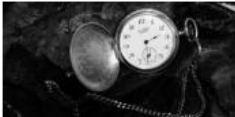
Orain arte jendeak emandako bozken arabera, ondorengo hiruko dira kamara digitalarekin ateratako onenak. HITZA