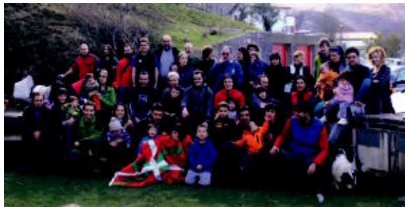
laz jende ugari elkartu zen Zugarramurdiko irteeran.

Aurrera begiratu aurretik ordea, urratsak ongi errotu diren ikusteko edo, atzekoa aztertu nahi izan dute labur-labur bi taldetako kideek: «Proiektuarekin hasi ginenean, Euskal Herria ezagutzeaz gain, aisiarako beste eredu bat bultzatu nahi izangenuen. Mendi irteerara joan den jendeak errepikatu egin du eta hori seinale ona izan da. Beldunaldi desberdinen topagune bilakatu dira txangoak eta giro polita sortu da».