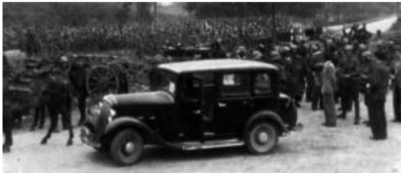
Gasteizko artxiboan topaturiko argazkia. Frankistak Tolosara sartu ziren unean.

Gizartea » Gerra Zibilak Tolosan izan zuen eragina aztertu eta liburua kaleratu du Aranzadik; hitzaldiak eta omenaldia ere antolatu ditu.