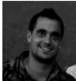
Bengoetxea VI.a. HITZA

Bengoetxeak nahi zuten guztia egin zuten. Beroizek hasieran ba-