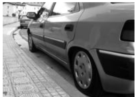
Ibarran Apata Erreka auzoan aurkitzen zen erasotako autoa. E. EZEIZA