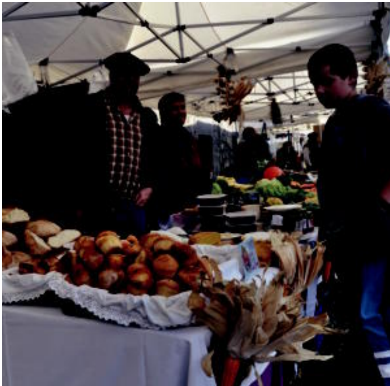
Janari postuez gain, artisaauk ere elkartu ziren Zizurkilen. SARA GOMEZ