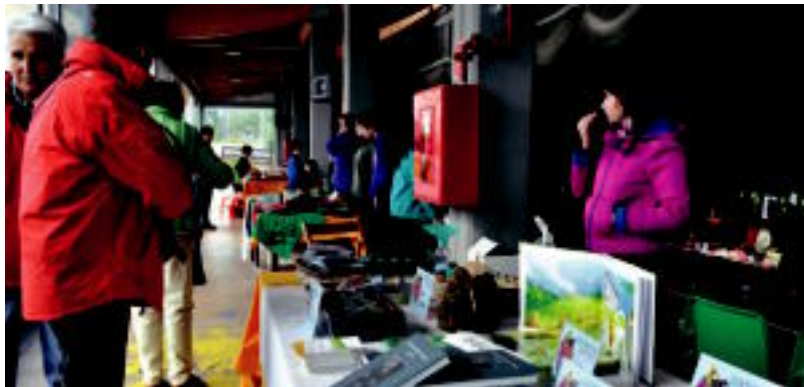
Udalak eta herriko ikastetxeek ere jarri zituzten beraien postuak. SARA GOMEZ

Guztira, janari eta artisauro artean, 46 postu izan ziren. Eta Udalak eta herriko eskolek jarritakoak ere izan ziren. Eguraldia dela eta, postu batzuk kalean jarri bazituzten ere, artisauroenak frontoi barruan jarri zituzten. Autoz, oinez edota Udalak antolatutako autobusean, ehunka pertsona hurbildu ziren baserriarren zein artisauroen produktuak ikusi eta erostera. Egurdirako jende ugari gerturatu zen XIII. Azoka Berezian. Eta kan-