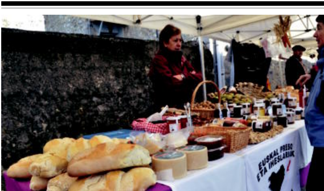
XIII. Azoka Berezian guztira 46 postu izan ziren. Janari eta artisauro postuak izan ziren eta jende ugari ibili zen. SARA GOMEZ