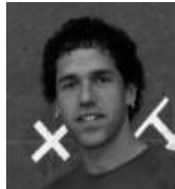
Olaizola I.a. HITZA

Lehen kanporaketa irabazi ostean, Bengoetxeak datorren igan-