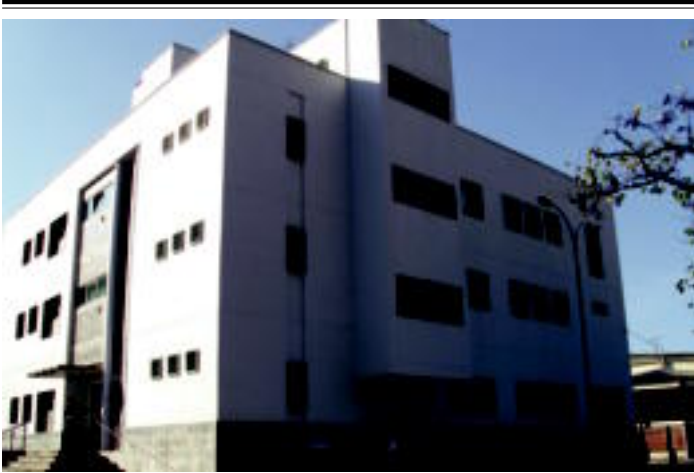
San Esteban auzoan dagoen osasun etxea orain dela 18 urte eraiki zuten eta gaur egun, zerbitzu gehiago eskaintzen dituzte bertan. A. ALTUNA