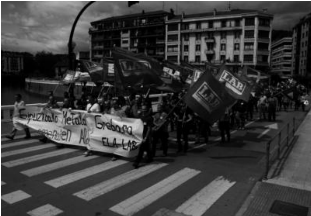
Ekainean Tolosan egin zen metalaren manifestazioa.

Gipuzkoako metaleko langileek ELA eta LAB sindikatuek deitutako lehen greba eguna dute gaurkoa. Bihar, etzi eta azaroaren 2, 3, 4 eta 5ean izango dute lanuzteek jarraipena.