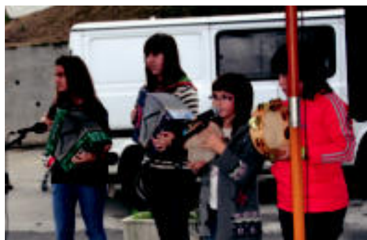
Goiza eta arratsaldea aritu ziren trikitilariak; zazpi modalitetan aritu ziren kirolariak atzo, Ikaztegieta. E. EZBIZA