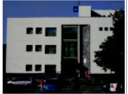
Langileek aurreluzatutako eraikinak jartzea edo ferialdeari eremu biki bat kentzea proposatzen dute. A. ALTUNA

orain, momentuko arazoak eta aurrerantzean etor litezkeen konpontzeko emateko. Izan ere, Tolosako Udala zertzen ari den plan berezi horren onarpen ematean, auzoak gutxi behera aldatuko lirateke eta orain da garaia zerbait egiteko. Medikuaren arabera, Osakidetza-aren kompetentzia izan arren, Udalak ere badu zeresaniki, Tolosako herritarren osasun zerbitzua eta lur antolamendua nola kudeatu bere gain hartu. Udala, mahaizaren hanka garrantzitsu bat dela adierazten dute, eta gaur egun inguruko bere iritzia izango luke zeresaniki. Arauzoari konponbide emate al-