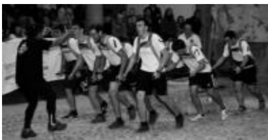
Heldu taldea izan zen garaile Aian jokaturako norgehiagokan. IBON ERRAZU

TOLOSA Lau eguneko ekitaldi festaren ostean, Berazubiko auzotarrek atzo esan zieten agur bertako jaiari. Gainera, aurten, aspaldiko partez eta auzotarrek eskatuta, berriro Pilar eguna ospatu zuten. Ekitaldien artean, lehendabizi meza ospatu zuten. Ondoren, eguerdi aldera, 70 lagun inguru bildu ziren karparen azpian, babarrunak jateko. Arratsaldean toka txapelketa ere jokatu zuten. Honenbestez, asteburu luze eta mugituaren ostean, normaltasunera itzuliko da gaur Tolosako auzoa. Barrakak jaso eta inguruak garbitzen nahikoa lan izango dute datozen egunetan. IMANOL GARCIA