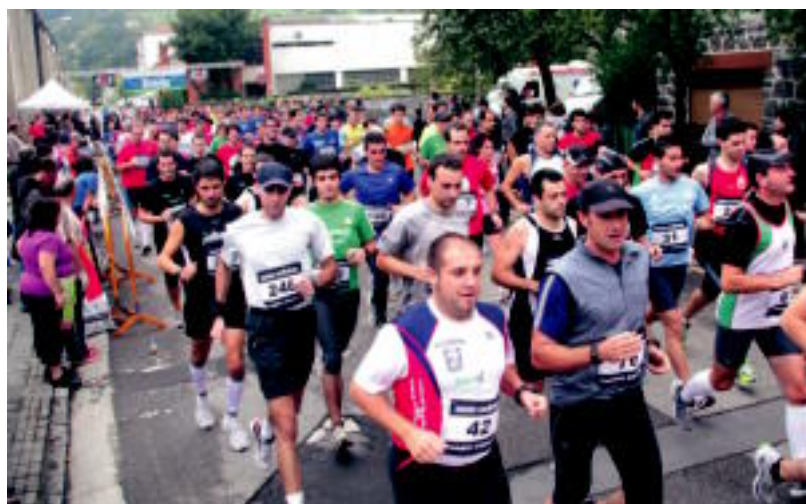
Aurtengo krosak ibilbide luzeagoa izan du; 10,2 kilometro egin behar izan dituzte parte-hartzaileek. I. GARCIA

HITZARMENA ELA eta LAB sindikatuek egin dute deia Adegri patronalak proposatutakoari aurre egiteko 2