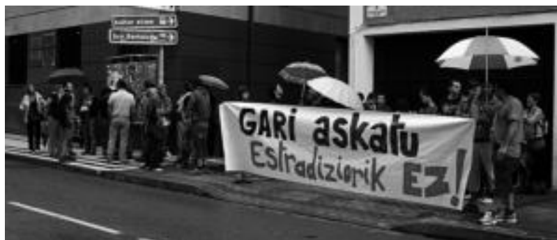
Ibarran Gari Ibarluzearen aldeko elkarretaratzak burutu dituzte.

Ibartarraren sendia «nekatu antzean» aurkitzen da; «tentsio honekin zazpi hilabete daramatzagu eta ez da erraza. Epaiketaren zain egon ginen, fidantzapean aske utziko zutela esan zuten eta gero ezetz, berriro espetxera, berriro