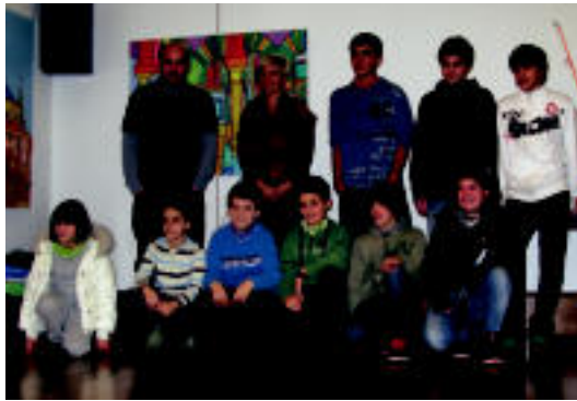
lazio lehiaketako saridunak. E. MAIZ

Aurkezten diren lanak, bost mailatan banatuko dituzte: 6-8 urte artekoak, 9-11 urte artekoak, 12-13 urtekoenak, 14-16 urteetakoak eta azkenik 17 urtetik gorakoak izango dira. Eta maila horien arabera, lanen luzerak zehaztu dituzte: lehenengoak, orrialde bateko