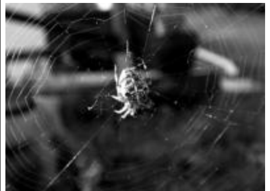
Iaz armairuak atera behar izan zizkieten argazkiak. HITZA

Kamera digitalarekin parte hartuko dutenei berriz, CD bat banatuko diete eta 15 argazki sartu beharko dituzte bertan. Hala ere, lehiaketarako horietako hiru bakarrik erabiliko dituzte.