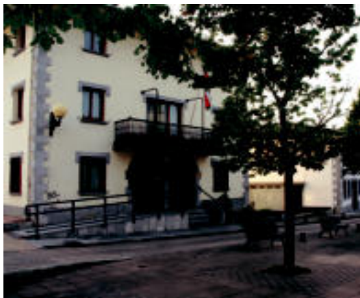
Leaburuko udaletxean eta kultur etxean egingo dira egokitzapenak. I. GARCIA

761.000 eurokoa da eta Gipuzkoako Foru Aldundiak emango duen diru laguntza 600.000 eurokoa izango da.