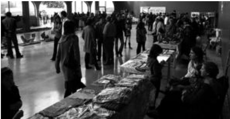
Jende ugari bildu zuen iaz, estreinekoz egin zutenean azoka eta aurtan hau errepikatzea espero dute. HITZA