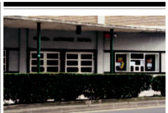
Bihartik aurrera berriz fimak ikusteko aukera izango da. E. MAIZ

Lan sarituak Udalaren esku gertatuko dira eta egoki iritziz gero argitaratu egingo ditu.