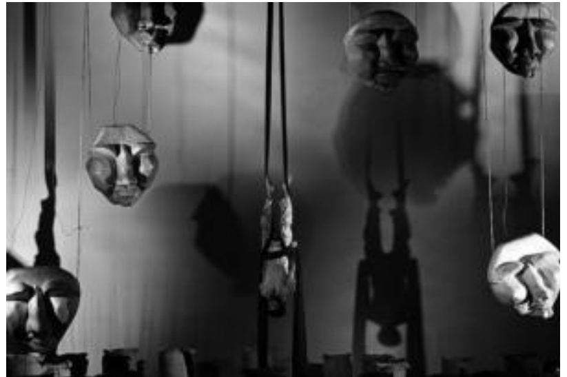
'Dre' emanaldian bihar ikusgai izango den uneetako bat. HITZA

Lan honetan elkarriketak sortzen dira boterea, bizitza eta heriotzaren inguruan. Ikuskizunaren abiapuntua Mahabharata indiar mitologian gerra luzeena izan ze-