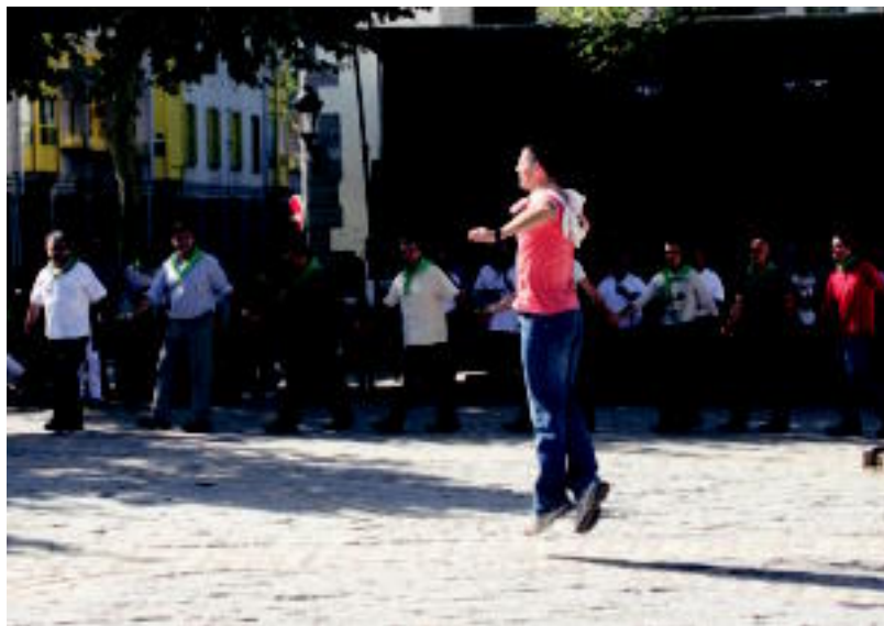
Iruran, bikoteen eguna ospatu zuten. Eta bikoteen soka-dantza dantzatu zuten. Ondoren bazkaria izan zuten. E. MAIZ

Ugarten bihar bukatuko dituzte jaiak. Eta atzo, haurrek ez zuten atseden hartzeko denborarik izan: puzgarriak, ohe elastikoak, zaldian ibiltzeko aukera, txokolata,... izan zituzten. Iluntzean bertso poteoa izan zuten eta afariaren ostean, Ostolaza eta Andonegi trikitalariak.