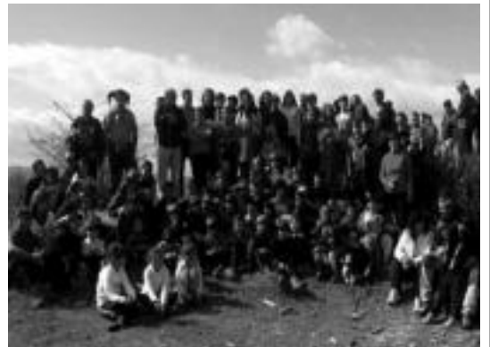
Burutxeko mendi tontorrean euskararen alde. HITZA

Laskorain ikastolatik gogoratu dutenez, «nahi izanez gero behintzat, igande honetan bertan Pasa-Lezon izango den Kilometroak festan, euskarari bostekoa emateko aukera izango dugula beste behin ere».