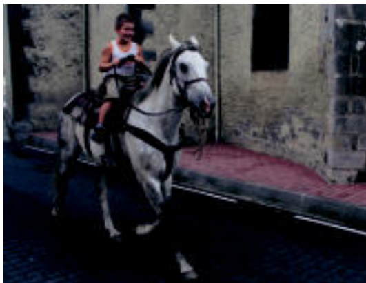
Ugarten, zaldien gainean ibiltzeko aukera izan zuten haurrek, baita puzgarrietan jolastekoa ere. I.GARCI