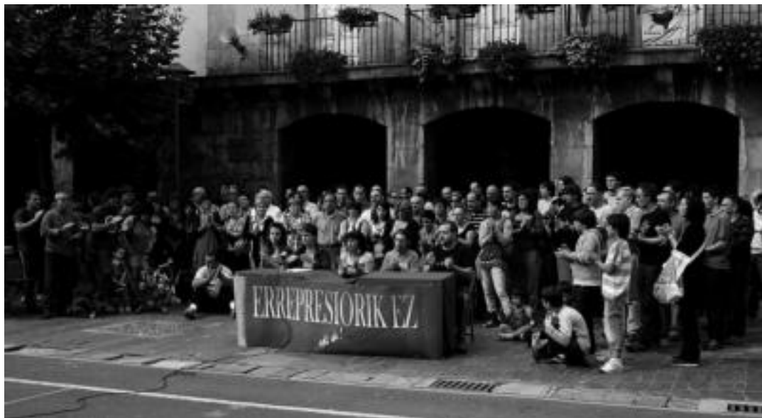
Villabonako udaletxearen aurrean, herritar ugari elkartu zen asteazkeneko atxiloketak salatzeko. Txalo zaparrada batekin amaitu zuten. E. MAIZ