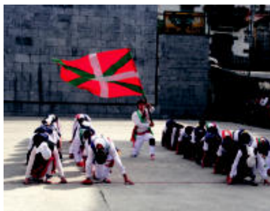
Aurrera dantza taldeak ikuskizun bikaina eskaini zuen. IMANOL GARCIA