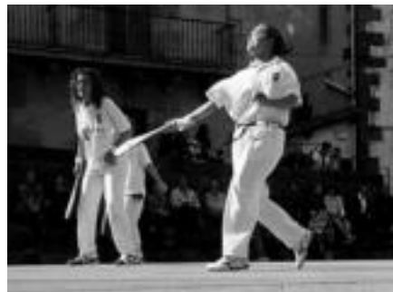
Dantzarien emanaldia eta pala partida ikusteko eta, tirolinan eta zaldi gainean ibiltzeko aukera izan zen atzokoan. i.g.

Dantzariekin amaitu ziren goizeko ekitaldiak. Agurra, Gipuzkoako Brokel Dantzaren Makil Dantza, Lesakako Zubi Gaineako Mutil Dantza, Saski Dantza, Lapurdiko Makil Dantza eta Polka dantzatu zituzten.