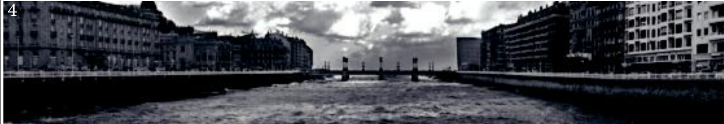
4 Ohana Irazusta: «Abuztuko arratsalde batean Donostian ateratako argazki bat bidaltzen dizuek». https://www.instagram.com/ohanairazueta