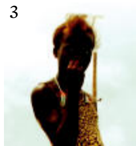
3 «La sal' izeneko irian izan gara eta argazkian ageri den neskatu politi hau iluntzeri portuan aurkitzen genuen hortzimugari begira bere alta arrantzaletan noiz etorritiko zabal». https://www.instagram.com/la.sal