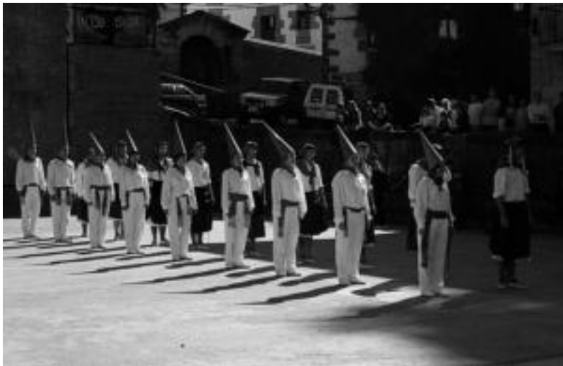
Biharko egunez, Aurrera elkarteko kideek ingurutxoak dantzatzeko plazan, bazkalostean. ASIER IMAZ