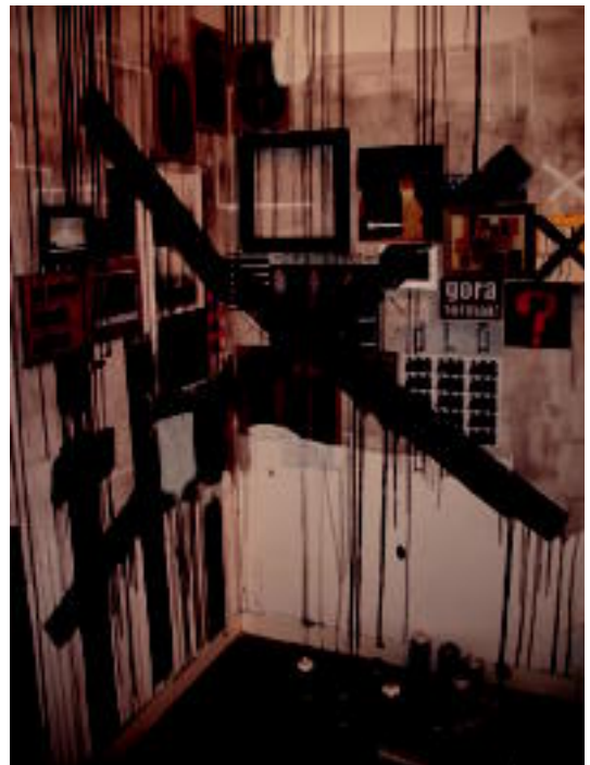
Dizebi graffitigileak ere hartu du parte erakusketan. I.T.