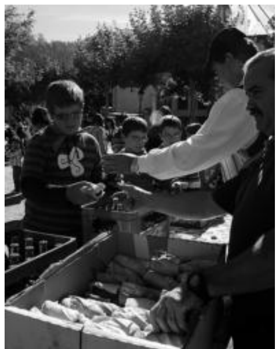
Haurrek ere, beraien hamaiketako izan zuten. E. MAIZ