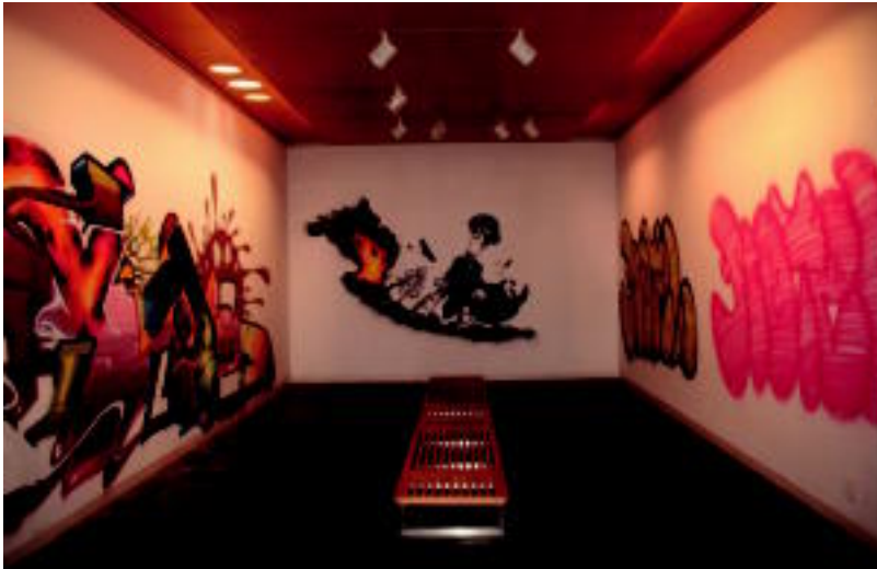
Motel graffitigilea da gonbidatuetako bat. Irudian, bere graffitiak. I.T.