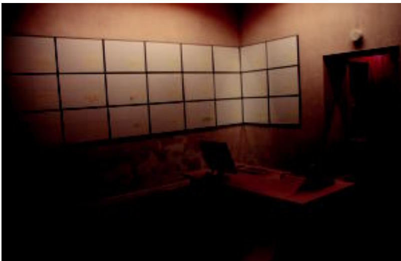
Gela honetan euren izenak jarri dituzte Leitzako eta Tolosako gaztetxo batzuek. I.T.