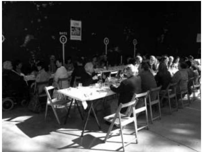
Aldaban, Meza Nagusiaren ostean hamaiketako egin zuten. I. GARCIA

Arratsaldea karta jokoan pasa zuten. Eta auzoan ospatzen duten egun handian, afaltzeko, 50 lagunetik gora elkartu ziren. Parrillan erreta, txuleta afaldu zuten. San Migel egunarekin datorren urtera arte, agur esan zieten jaiei.