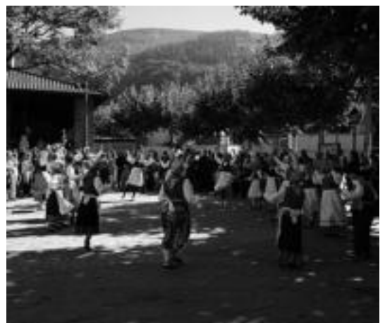
Meza ostean, herriko haurrek euskal dantzak dantzatu zituzten. E. MAIZ