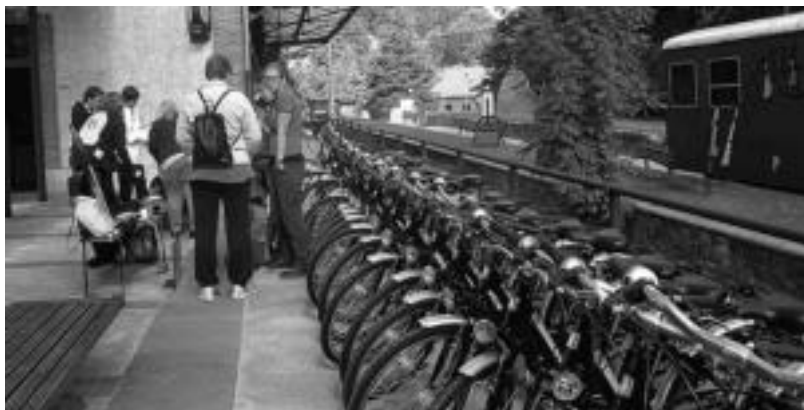
Hasteko, 30 bizikleta jarriko dituzte, jendeak alokatu ditzan eta inguruak ezagutu. HITZA

Leitza » Plazaola Partzuergo Turistikoaren ekimenez eta Udalaren laguntzaz Plazaolan bizi proiektua egin dute.