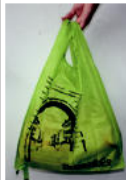
Poltsa berrerabilgarria. I. TERRADILLOS

TOLOSA Erosleek elkartean aurkitzen diren dendetan jasoko dituzte 2