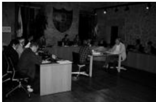
08:00etan hasi zen atzo Osoko Ohiko Bilkura. A. IMAZ

Aurrez eginiko batzordeetan dena loturik utzi zutelako edo alderdi desberdinen arteko adostasuna erabatekoa delako, Osoko Bilkura azkarra izan zen. Bozka guztiak baiezkotzat izan ziren eta ondorioz, gai zerrendako puntu guztiak onarturik gelditu ziren. Bilkura