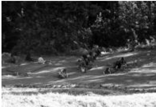
Atzo ere, arkeologoak lanean ari ziren Basagainen.