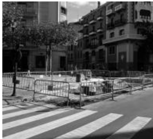
Urriaren 15erako lanak bukatuta egotea espero dute. I.T.

Gainera, gune osoa maila berean jartzeaz gain, Rondilla kalean zirkulaziorako bide bat utziko dute, Triangulo plazaren tamaina handituz. Tolosa Zona 30 Plana apli-