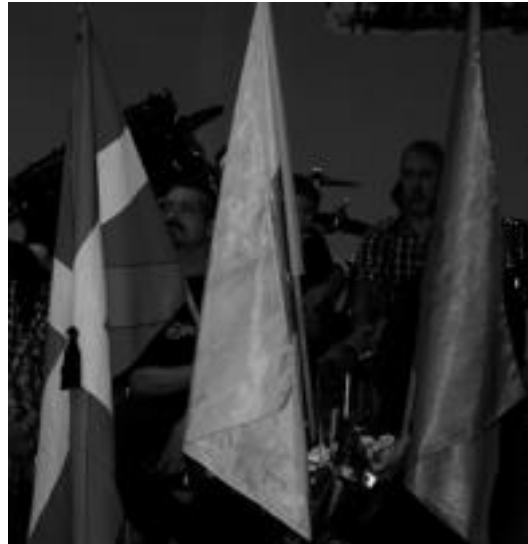
Gudari Egunean baitan ekitaldi berezia burutu zuen Ezker Abertzaleak. A. IMAZ

Ezker Abertzalearen ustez, liburu ofizialetan «ahazturik» baldin badaude ere, «gure historiaren orri asko idatzi dituzte gudariak». «Faltsutze etengabe» horren atzean espainiar eta frantziar estatuak aurkitzen direla azpimarratu zuten: «Hauen eraso ideologikoak