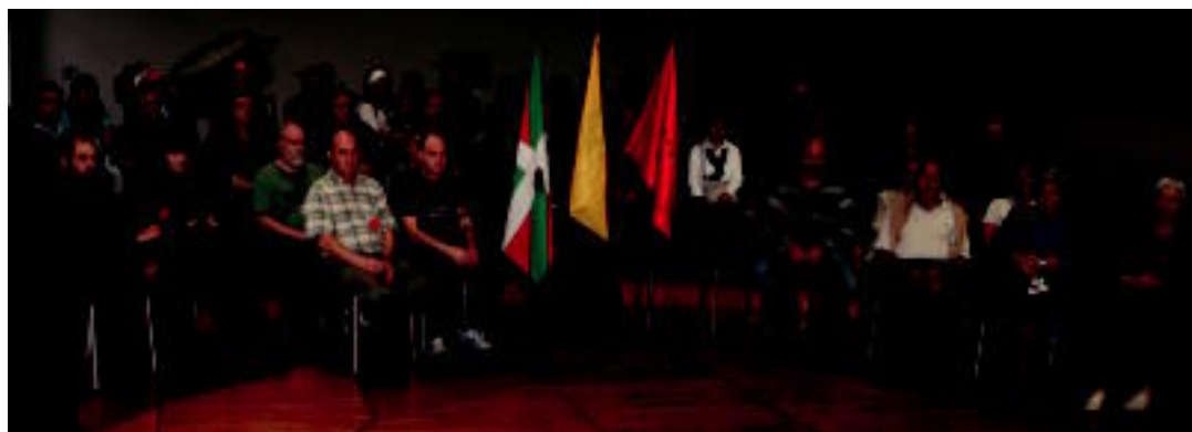
«Eskualdeko gudarien senide eta lagunak» elkartu zituen Tolosaldeko Ezker Abertzaleak. A. IMAZ

TOLOSA Plaza bakoitzak 5.000 euro inguru balio ditu; zozketa azaroaren amaieran egingo da 3