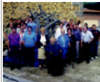
Ibiurko bizilagunak eta euren familiakoak eskulturaren inaugurazioa egin zenean. HITZA