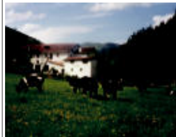
Erbeta Behoko baserria zegoen parajea egun ur azpian dago. HITZA