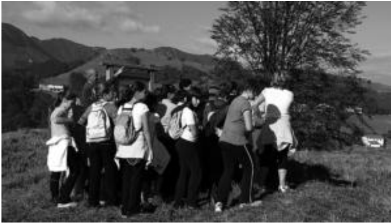
Adi jarraitu zituzten azalpenak. Panel ezberdinak ikusi zituzten eta baita indusketa guneak ere. E. MAIZ