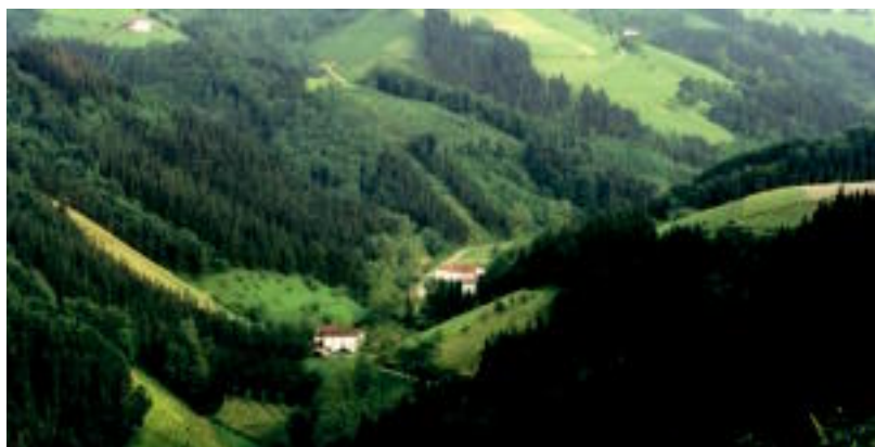
Baliarraingo Ibiur bailara urtegia egin aurretik. HITZA