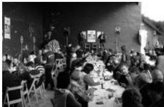
Igandean bazkaria egin zuten 100 lagun inguruk.

Festen zehar izan zen bitxiak iriarik. Igandean Donostian U2 tal-