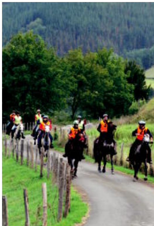
Antolatzaileak gustura azaldu dira probaren balantzea egiterakoan. HITZA

GIZARTEA Asteasu, Alegia, Ibarra eta Bidegoianen azokak izan ziren nagusi igandean; salmenta onak izan zirela diote parte-hartzaileek 4