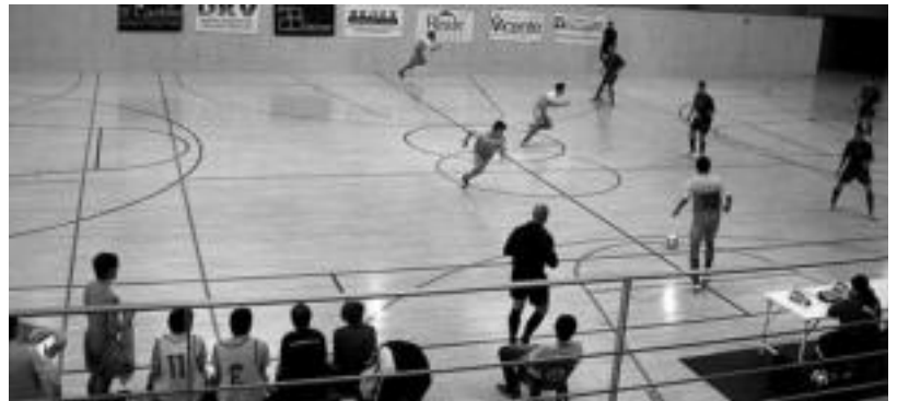
Laskorain Ikastolako jokalariek izerdia gogotik bota behar izan zuten lehen jardunaldian.