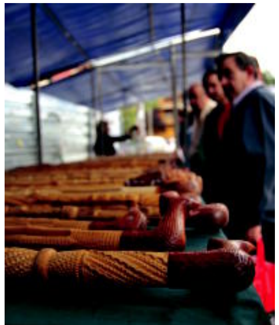
Ibarran, piperrez gain, beste hainbat gauza ere izan ziren salgai. ION ALEJOS