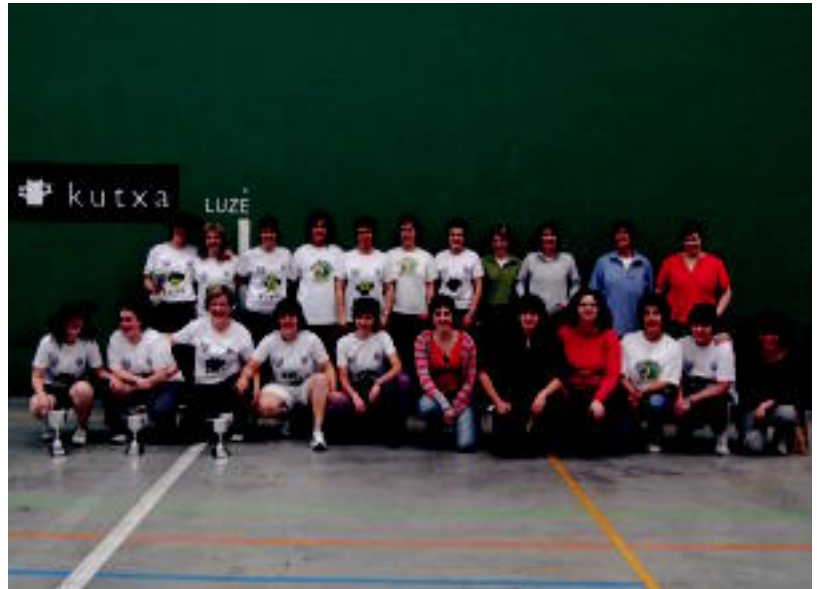
Pasa den maiatzean Iruran egindako Emakumea Pilotari Egunean 80 bat emakume bildu ziren. HITZA

Aurreko edizioetan 80 inguru elkartu ziren eta egun pasa ederra egin zuten Iruran. Bertan jokatzeko da Emakumezkoen Paletako Gipuzkoako Txapelketa Herrikoia-zen azken fasea ere.