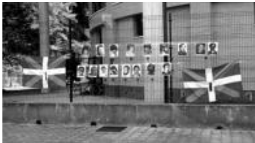
Laskorain ikastolaren kanpoaldean hainbat argazki eskegi zituzten. HITZA

Gudari Eguna izaki, hainbat ekitaldi egin zituzten atzokoan eskualdean. Ikasleek esaterako, geldialdiak egin zituzten eguerdian Orixeñ, Laskorainen eta Tolosaldea Goi Mailako LH Institutuan, eta ekitaldian 200 lagun inguru bildu zirela adierazi zuten. Iluntzerako, berri, manifestazioa zegoen iragarrita Tolosako kaleetan.