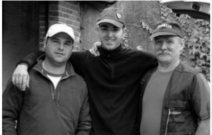
Lehenengo hiru postuetan gelditu ziren zaldunak, hiruak Ugarteakoak. HITZA

Aurtengo berritasuna bazkariarena izan da. Abaetxe taberna-jate-txea orain gutxi ireki da Bedaion eta hori aprobetxatuz bazkaltzeko aukera izan zuten. 81 lagun izan zi-