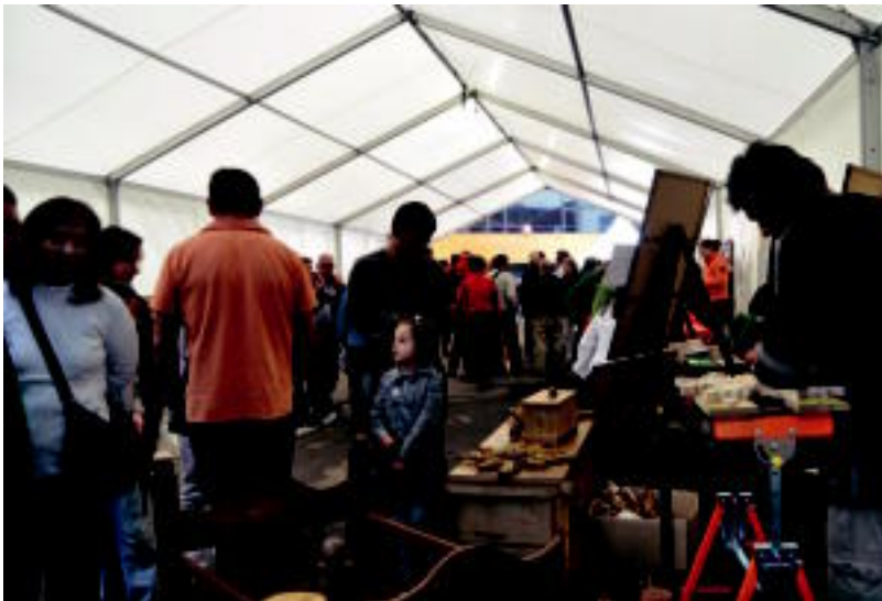
Asteasuko azokak jende ugari bildu zuten; bertatik nahiz Euskal Herritik etorritakoek jarri zituzten 60 postu inguru. s. g.