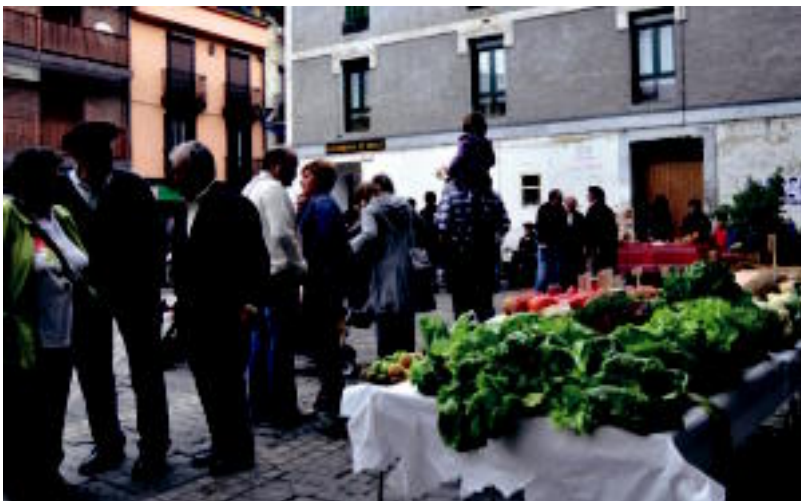
Alegian bertako baserriar eta artisauen produktuekin osatu zuten azoka berezia. SARA GOMEZ