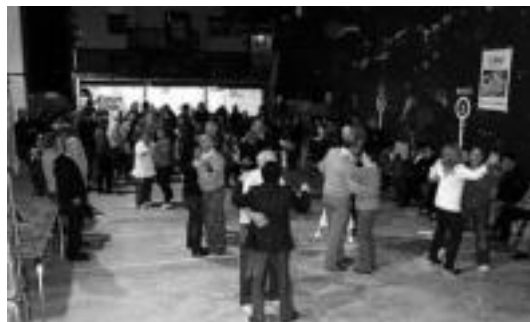
Larunbat gauetan erromeri giroa izan zen Aldabako frontoian. HITZA

deak eman zuten kontzerturako txartel bat zozketatu zuten, bertan zeudenen harridurarako. Aldaba-