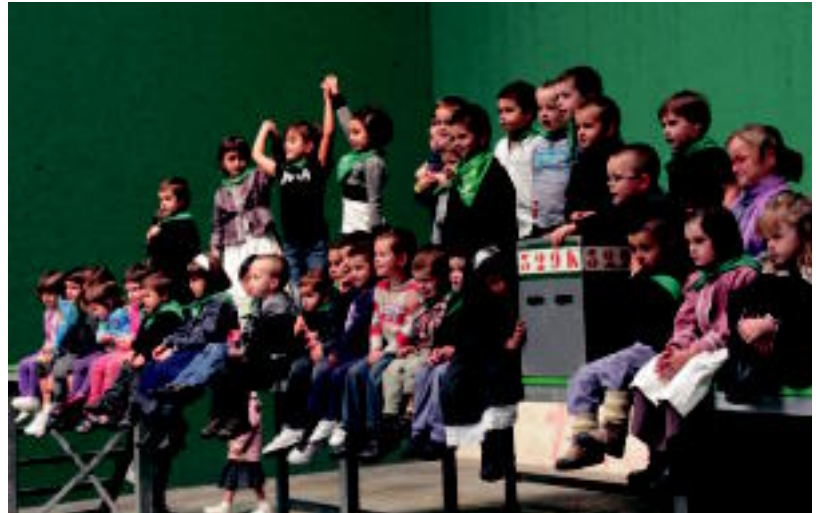
Txikienek, baseritar jantziekin, euskal festa eta jokoak egin zituzten pilotalekuan. I. TERRADILLOS

19:00etan bertso saioa izango da Lujanbio, Alberdi, Soto eta Sarriegirekin. Gaiak jartzen Mendiluze ariko da. Eta 20:00etan erromeria Dantzadi taldearekin izango da.