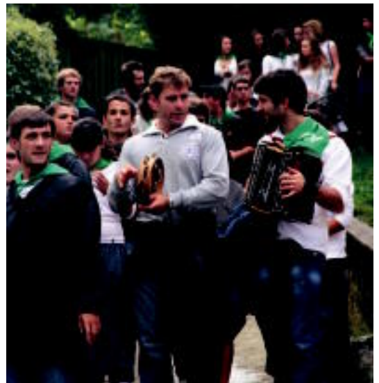
Neska eta mutil, herrian barrena dantzan ibili ziren. I. TERRADILLOS

Gaur, Meza Nagusiarekin hasi dute eguna. 12:00etan III. Aldabako Txirindulari Igoera Herrikoia izango da. 14:30ean, guztiak mahaiaren bueltan elkartuko dira eta Herri Bazkaria egingo dute. 18:00etan, Herri Kirolak ikusteko aukera izango da. Jarraian, Ostolaza eta Andonegi trikitilarietako erromeria.