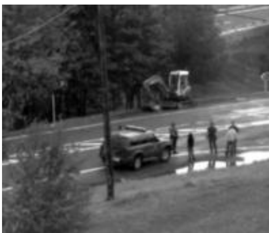
Guardia Zibilak bi lagunak eraman zituen unea.