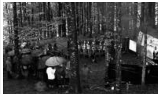
Mendi martxan ekitaldi politikoa burutu zuten atzo, HITZA