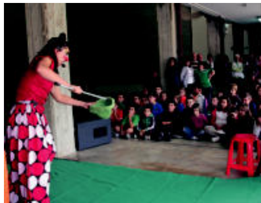
Zurrunmuru antzerki taldearen emanaldia, atzo. I. TERRADILLOS