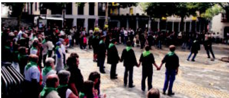
Haurrak jolasean ibili ziren bitartean helduak dantzan aritu ziren. I. TERRADILLOS/E. MAIZ