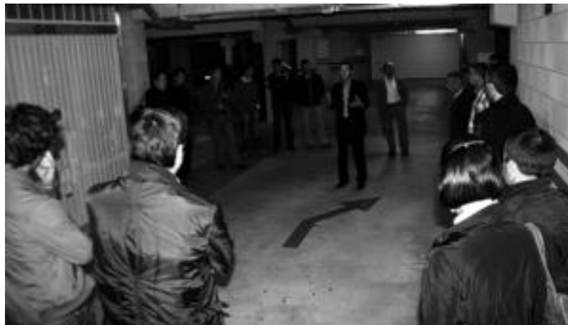
Udaleko ordezkariak Alondegia aparkaleku berrian, atzo, i.t.

Alondegiko aparkalekua atzo inauguratu bazuten ere, badira hila bate batzuk autoak aparkatzen hasi zirenetik. Bigarren pisua, egoiliarrena, bete a egon ohi den