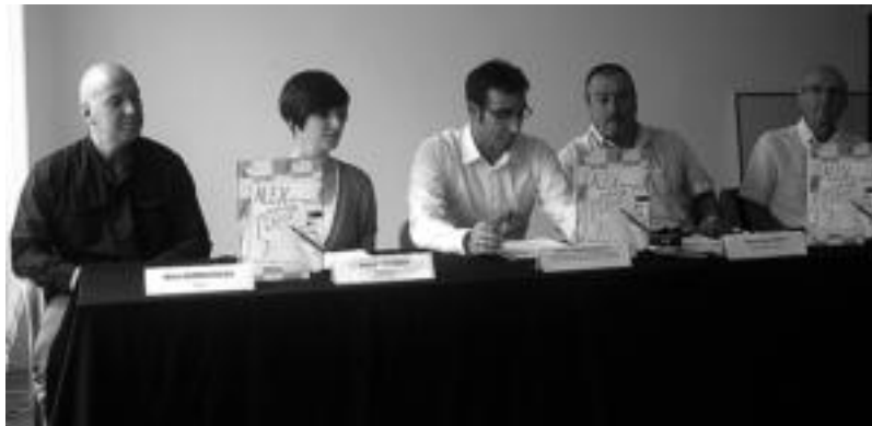
Iruñean egin zuten aurkezpena.