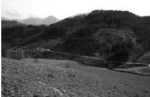
AHTren obrak direla eta Ugane auzoko bizilagunak kexatu egin dira behin baino gehiagotan. A. IMAZ

Hitzaldi hauek ematera joateak bi helburu nagusi izan ditu. Bata AHTren inguruan hemen dagoen egoeraren berri ematea. Hau da, AHTren ezaugarriak, sortutako suntuipena (mendiak, basoak, errekek), instituzioen ardura, informazio falta, historia, berarekin dakartzan lanei lotutako kalteak (energia, porlana, harrobiak) kontsultan falta eta oztopatzea, nekazarien egoera, garraioa, garapena... azaltzea izan da. Bigarren helbu-