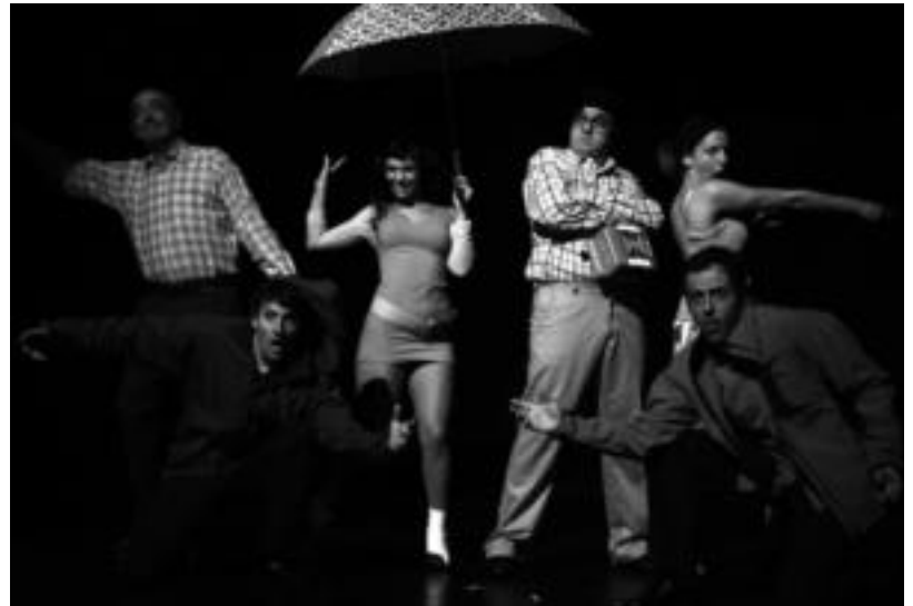
'Vaya Semanita' antzezlaneko aktoreak, entseguetako batean, Leidorren. NEKA

Aktoreak telebista saio berberak dira, baina kasu honetan plotoak eszenatokiengatik aldatuko dituzte. Bertan, urteetan zehar pantailaratu dituzten sketch onenen aukeraketa egingo dute. Eguneroko bizitzan gertatu daitezkeen askotariko egoeren inguruan egingo dute umorea; egoera horiek gure aitek sortuak izan daitezke, gure semeek, bizilagunek, nagusiek, lankideek, emaztearen edota senarraren maitaleek, lagunek... «Azken batean, gure bizitzako pasarte txikiak izan daitezke, geure burua ere bertan irudikatu dezakegularik», azaltzen dute lanaren egileek.