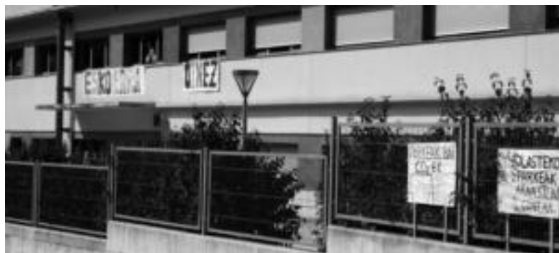
Samaniego ikastetxearen kanpoan hainbat mezu zintzilikatu zituzten ikasleek. A. IMAZ

esan zioten. Arratsaldean helduagoen txanda izan zen, StopCO2 mahaiaren lehendabiziko bilera egin baitzuten. Udalak 2009. urtean osoko bilkuran adostu zuen ordenantzari erreparatu eta, ildo honi jarraipena emanez egin zen batzarra, Tokiko Agenda 21 ekin-tza plana garatzeko asmoz.