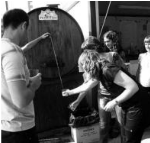
Sagardo dastatzea egin zuten iaz, jaien baitan. I. LAHIDALGA

giardoa edaria eta eserlekuak prestatuko dituztela argitu dute, gainontzeko guztia bakoitzak eraman beharko duelarik.