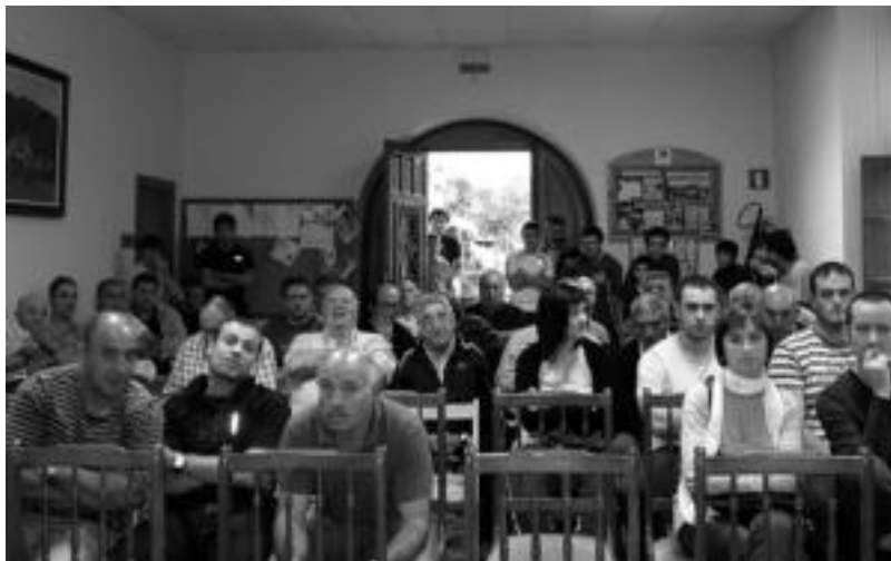
Aresoko uso postuek ehiztari ugari erakartzen dituzte, eta jendetsua izaten da urtero hauen enkantea. A. IMAZ

Nafarroan, ehizako legediaren arabera, sesteatzeko aukera eman behar da. Hori dela eta, lege horretan oinarrituz, joan den larunbatean egingako eskaintzak hobetzeko aukera badago oraindik. Interesa dutenek, bihar 20:00ak baino lehen udaletxean aurkeztu beharko dute beraien proposamena. Baina, hori bai, gutxienez, seiren batean hobetu beharko dute aurrekoa. Norbaitek hori egiten badu, larun-