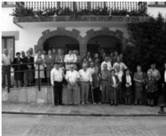
50 lagun inguru biltzen dira urtero festan.

Meza ostean, herriko dantzariak emanaldia eskainiko dute adineko guztientzat, herriko plazan.