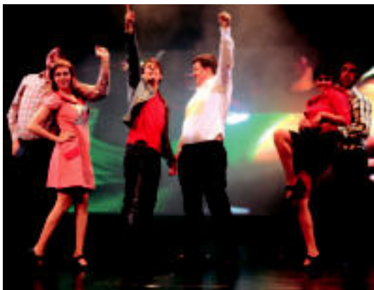
Entseguak Leidorren bertan egiten ari dira egun hauetan. NEKA