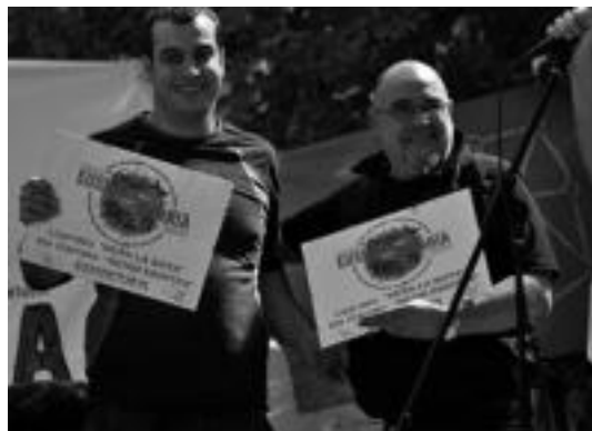
Elkarte desberdinek oroigarri bana jaso zuten. Herri bazkarian berriz 300 lagun inguru elkartu ziren. Zanpantzarren kalejiran ibartar «ausartenak» ere irten ziren. HITZA