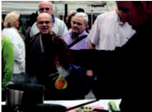
Arrautza poltsatxo batean sartuta ur irakinetara botatzen. I. GARCIA

Azoka » Tolosako Azokak + KM 0 egitasmoaren baitan 100 pintxo inguru banatu zituzten atzo goizean Trianguloan.