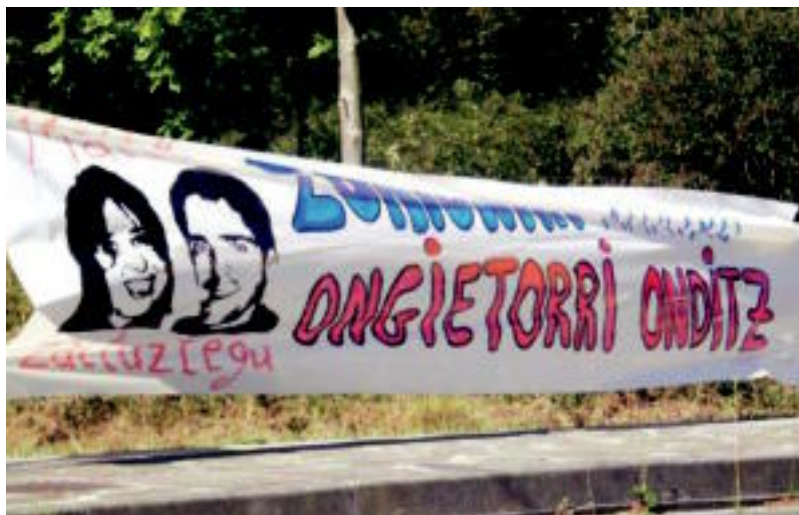
Zorionak! Onditz ongi etorri Lizartzara.