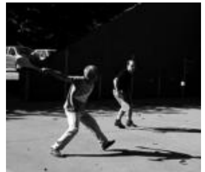
Goian haurrak soka-tira; behean lokotx biltzen eta helduak pala txapelketan. I. GARCIA