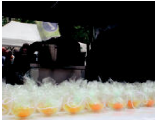
100 bat pintxo banatu zituzten Trianguloan. I. GARCIA

VILLABONA Dultzaineroak, dantzariak, bertsolariak eta herriko beste euskal presoen senideak izan ziren Berdura plazan 5