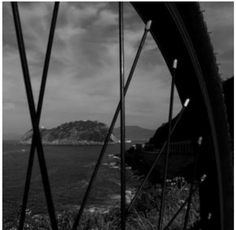
Getariako arratoia, Zumaiatik etorrira itsasertzetik.

Tolosarekin batera nesken treineruan hain emaitza onak lortu dituen herria pasa eta Zarautz dugu berehala, «Erreginen hondartza eta hondartza erregina», esaerak