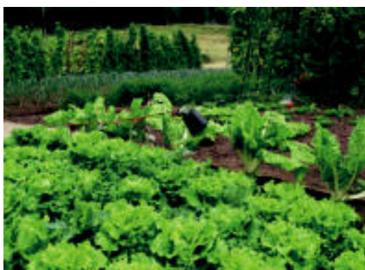
Hamabi baratzen artean aukeratu beharko dute herritarrek. HITZA

koitzari zenbaki bat eman diote, eta herritarrek beraiek ustez sari-tua izan behar duen parte-hartzailearen zenbakia jarri behar dute eskueran dituzten txarteletan.