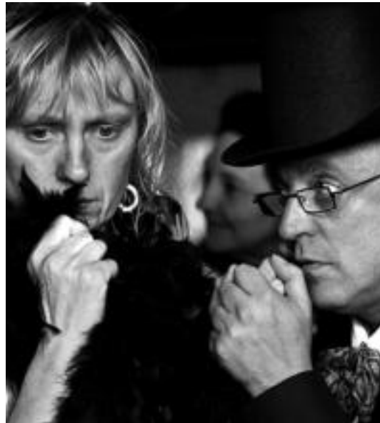
laz 'Hiru kapela luze' lana antzetztu zuten. HITZA

Tailerrean jokoan aritzen direla dio irakasleak. «Hasteko gure egiteko garrantzitsu bat da gure barneko haurrekin adiskidetu eta gauzak egiteko grina berreskuratzea», argitu du. «Bizirik egotearen sentsazioa edukitzea da gako»,