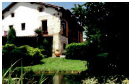
Lorategi diseinatzen eta osatzen erakutsiko diete belauntzarrei. HITZA

Ikastaroaren prezioa 41 eurotara da, eta internet bidez www.kutxasocial.net/helbidean , nahiz telefonoz, 902 54 00 40 zenbakira deituta (astelheenetik ostiralera,