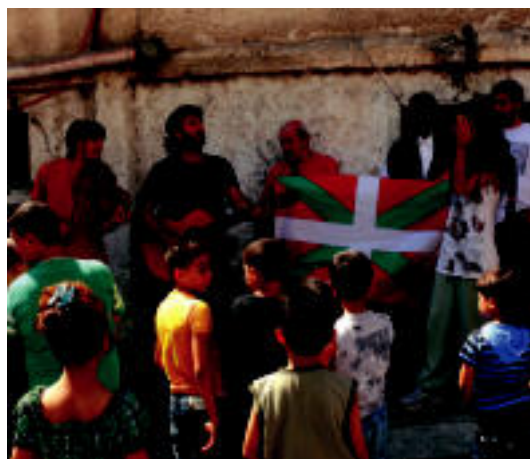
Alegiarrek eta palestinarrek senidetze ekitaldian. HITZA