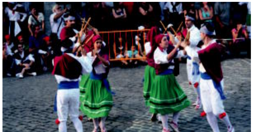
Auzoetan ibili ostean, dantza talde guztiak plazan elkartu ziren. I. TERRADILLOS