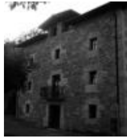
Osingoingo etxebizitzak. HITZA

Iturriaga Alkate denetik, beste ekintza hauek burutu ditu: