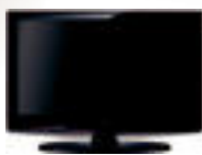
Ezaugarriak: samsung LE 32C450

Orain, beste arrazoi bat BERRIaren harpidedun izateko.