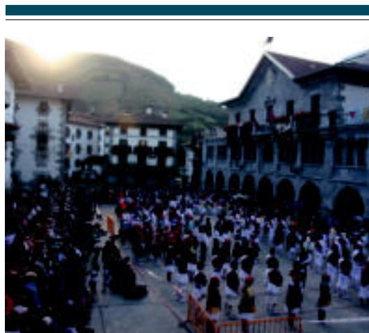
Jende asko bildu zen plazan ekitaldi nagusia ikusteko. I. TERRADILLOS