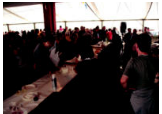
Irrintzi Elkarteak jarri zuen barran, jende asko ibili zen. I. TERRADILLOS

Aurtengoa zazpi elkartek hartu zuten parte eta irabazlea, Irrintzi Elkarteak izan zen. Bigarren postua, Uso-Toki Elkarteak eskuratu zuen eta hirugarren postua berriz, Zumbeltz Elkartearentzat izan zen.