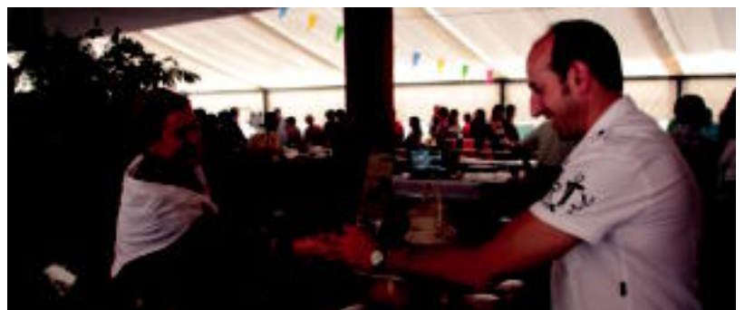
Produktu ezberdinak eskainiz, postu asko izan ziren. I. TERRADILLOS