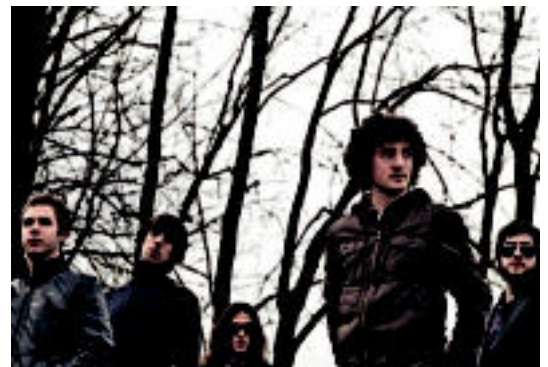
Sexy Sexers musika taldeko partaideak. HITZA

■ Emanaldia. Hirugarren zuzeneko izango da bilbotarrena. Anari eta Atom Rhumba taldeen atzetik joko dute, 23:40 inguruan hasita.