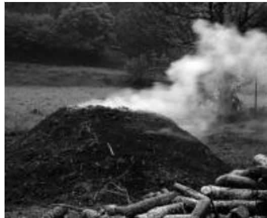
Su emango zaio txondorrari, egunak emango ditu ketan. XABIER ARTOLA