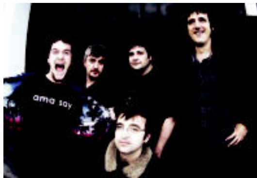
Ama Say taldeko kideak. HITZA

■ Emanaldia. Anariren emanaldia- ren ostean izango da euren txanda. 22:15ak inguruan igoko dira Bonbereneako eszenatokira.