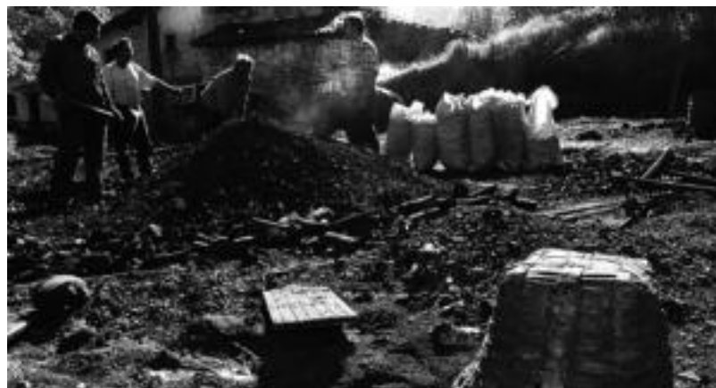
Txondorra zabaldu eta irekitzeko unea iristen da. Itzali eta gero, ikatza ateratzea ere lan nekeza da. XABIER ARTOLA