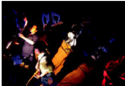
Atom Rhumba taldeko kideak zuzeneko batean. HITZA