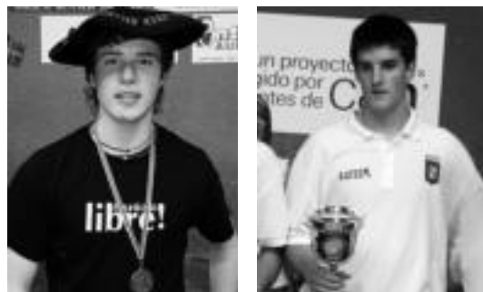
Artola alegiarra eta Jaunarena leizarra.