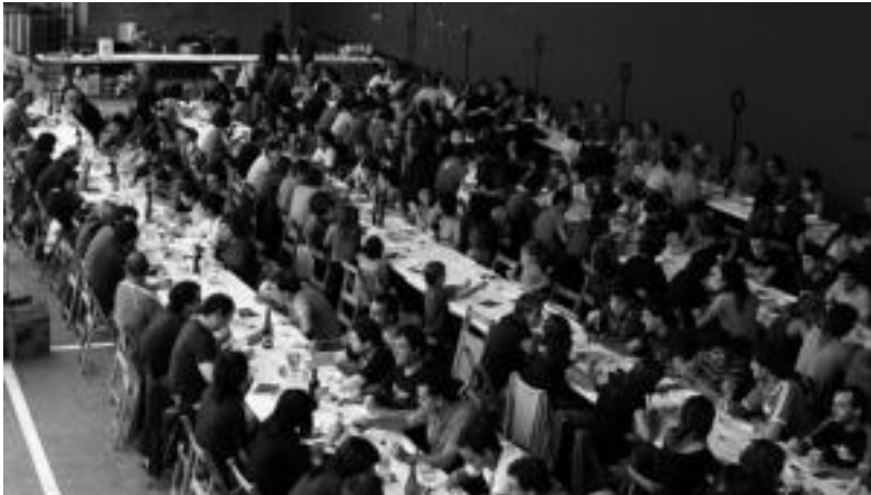
Ibarra eta Lizarra iaz senidetu ziren jai giroan ospatu zuten Euskal Herria Egunean. R. CALVO