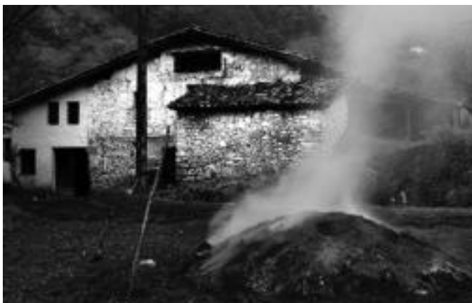
Egurak egosi egin behar du mantso-mantso, erre gabe, behar bezala ikaztuko bada. XABIER ARTOLA