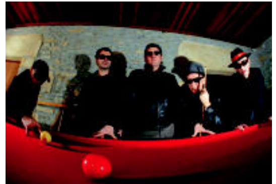
Doctor Deseo taldeko kideak. HITZA

■ Emanaldia. 01:00ak inguruan hasiko da euren kontzertua, Doctor Deseo taldearen ondoren.