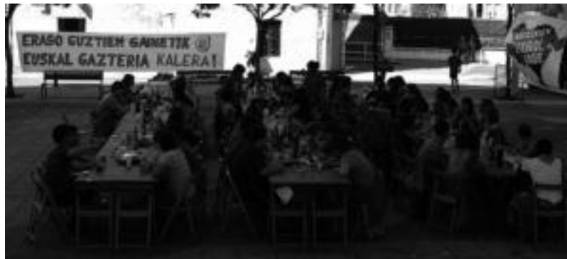
Alkizan Patxin eta Potxin pailazoan emanaldia ikusi ahal izan zen eta Zizurkilgoan gazte bazkaria egin zuten. I. GARCIA