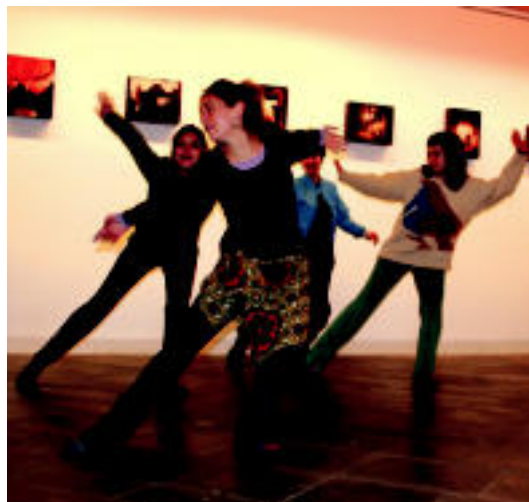
Iaz, erritmo afrikarrak ikasi zituzten. E. MAIZ

Matrikula egiteko bi aukera jarri dituzte: Tolosako Kultur Etxeko bulegoan bertan edo internet bidez ere bete daiteke matrikula orria. Internetez eginez gero, e-mail bidez, kultura@tolosakoudala.net helbidera bidali beharko da.