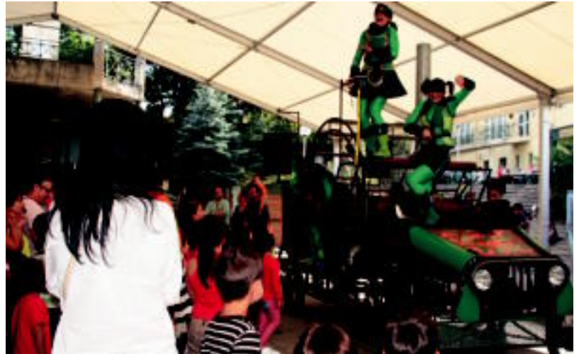
Super Plast ikuskizunaz gozatu zuten herriko haurrek. Ondoren, txokolatea izan zuten. E. MAIZ

Baina jaietan dauden bakarrak ez dira zizurkildarrak. Atzoko atsedeen egunaren ostean, Alkizan gaur eta bihar festa izango da eta Bedaion ere, gaur iluntzetik hasita igandera bitarte ez da musika, jan eta edanik faltako.