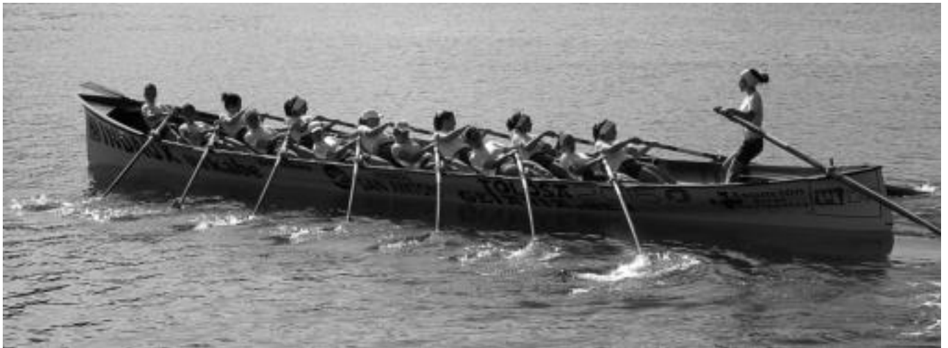
Tolosa-Getaria traineruak aukera handiak ditu igandean lehenengo Kontxako Bandera eskuratzeko. HITZA