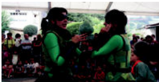
Haur ikuskizuna izan zen atzo arratsaldean. E. MAIZ

JAIAK Zizurkilgo Elbarrenan kantuan amaitu zuten eguna; Alkiza eta Bediaion gaur ere festa izango da nagusi 4