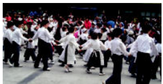
Ekainean ospatu zuten Dantzari Txiki eta Alurr eguna. HITZA

dintasun Teknikaria) telefonoetara deituz. Bestetik, aurten ordainketak egiteko modua aldatu egin dute. Aurrerantzean errezibo bidez egingo da. Nahi izanez gero, ordainketak helbideratu egin daitezke (begiratu matrikula orrian). Ikastaro guzti hauek doakoak dira.