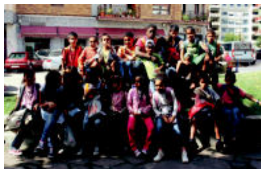
Datorren urtean itzuliko dira gaztetxoak. MARTA SAN SEBASTIAN