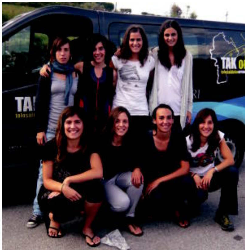
TAKeko neskak Tolosan geratzen dira ondoren denak batera Getariara abiatzeko. HITZA

ERRONKA Olatz Aldalur ontziko patrioiak dioenez, «Kontxako Bandera arraunlari guztiek duten ametsa da» 4