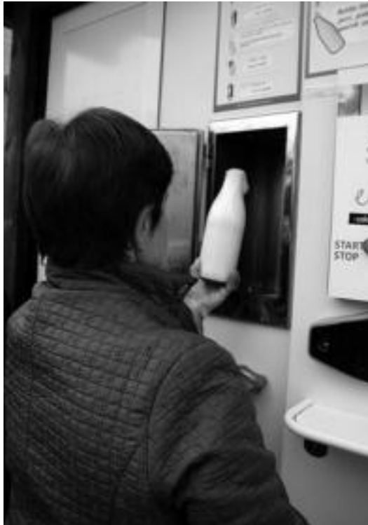
Villabonan badute jada esne makina. E.MAZ

Astero joango gara udaletxera eta gurekin harreman jarri nahi