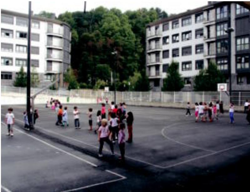
Hirukide Jesuitinetako jolastokian hainbat ikasle jolasean atzo eguerdian.