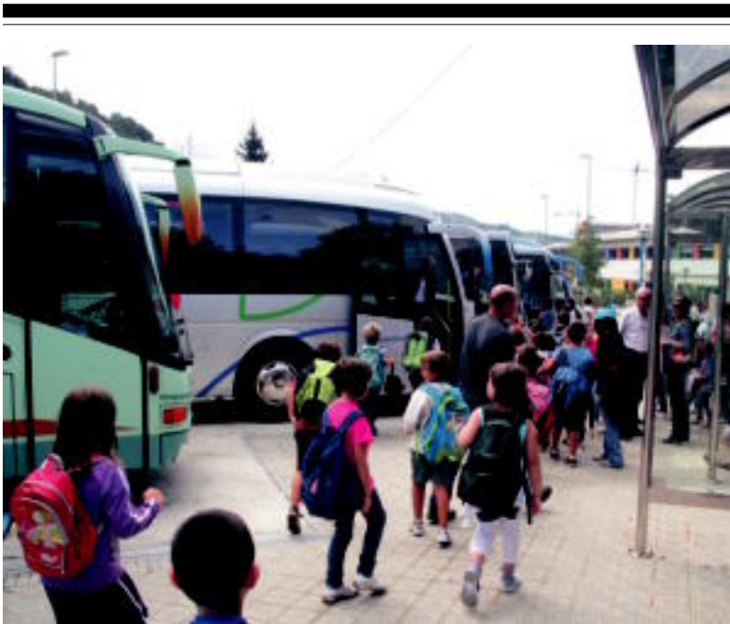
Samaniegoko ikasleak autobusetara bidean atzo. Antolakuntzak garrantzi handia du lehen egunean. I. GARCIA