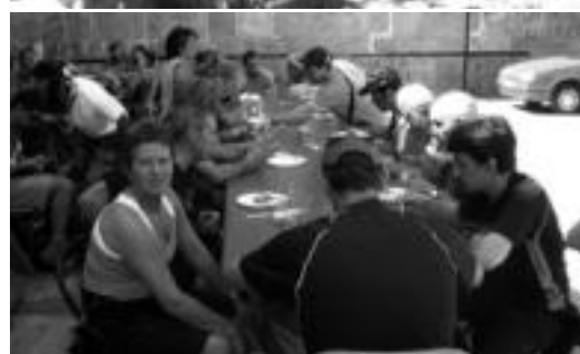
Paella ederra ere jan zuten 300 bat lagunek. HITZA