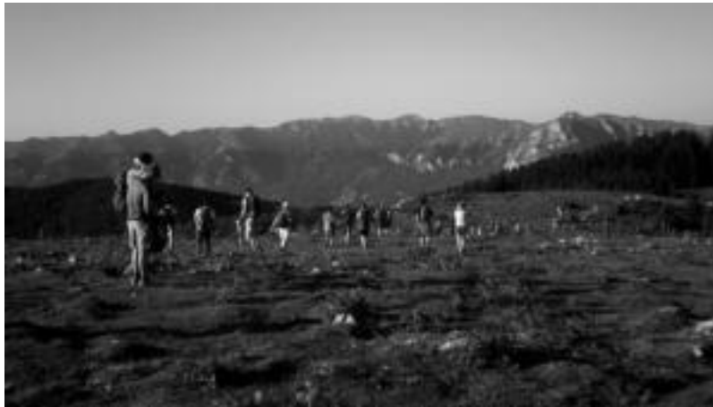
Mendizaleek bista ederrak ikusteko aukera izan zuten. HITZA

Areso » Herriko plazatik 500 lagun atera ziren. Aurreikuspen guztiak hankaz gora jarrita ere, gustura geratu dira.