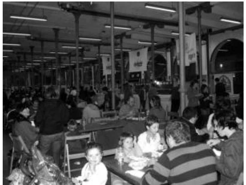
Irailaren 16tik 19ra izango da Garagardo Festa Zerkausian. M. SAN SEBASTIAN

■ Jaiak eta Kultur Asteak ■ Bedaioko jaiak. Irailaren 8tik 12ra bitarte. ■ Extremadurako Astea. La Jara elkartearen eskutik, irailaren 12ra bitarte. ■ XI. Garagardo Festa. Irailaren 16tik 19ra, Zerkausian. Kirol talde-ek eta Udalak antolatuta.