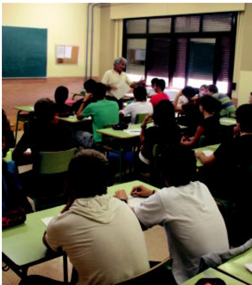
Hasi da ikasturte berria; eskualdeetako ikastetxeetan herenegun eta atzo bitarte hasi ziren haur eta gazteak. I. GARCIA

LAN ASKO Ikasleak iristen direnerako irakasleek prest dute guztia; oporren aurretik hasten dira guztia atontzen > 4