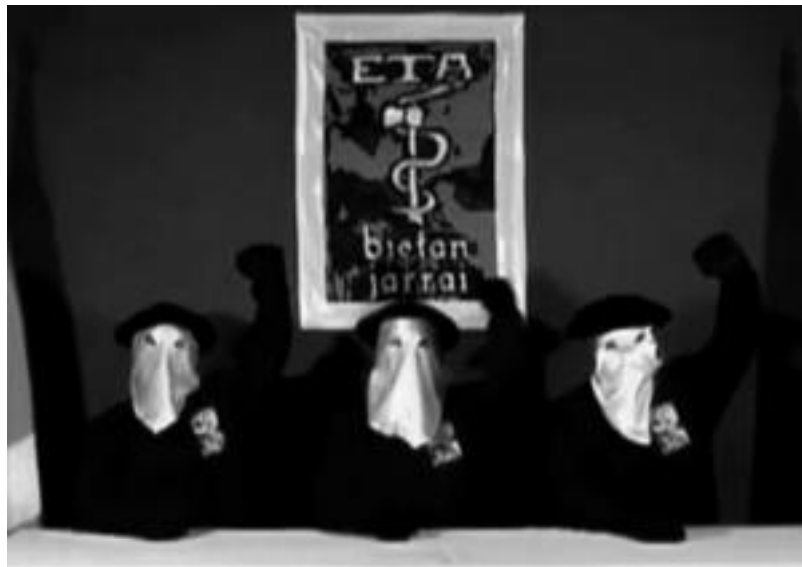
BBC-ra eta 'Gara'-ra igorritako bideo eta agiri baten bitartez eman du ETAK bere erabakiaren berri. HITZA

Politika » Herenegun, agiri eta bideo baten bitartez, «eraso ekingintza armaturik» ez burutzeko erabakia argitara eman zuen ETAK; orduetik, zeresana eman du gaiak.