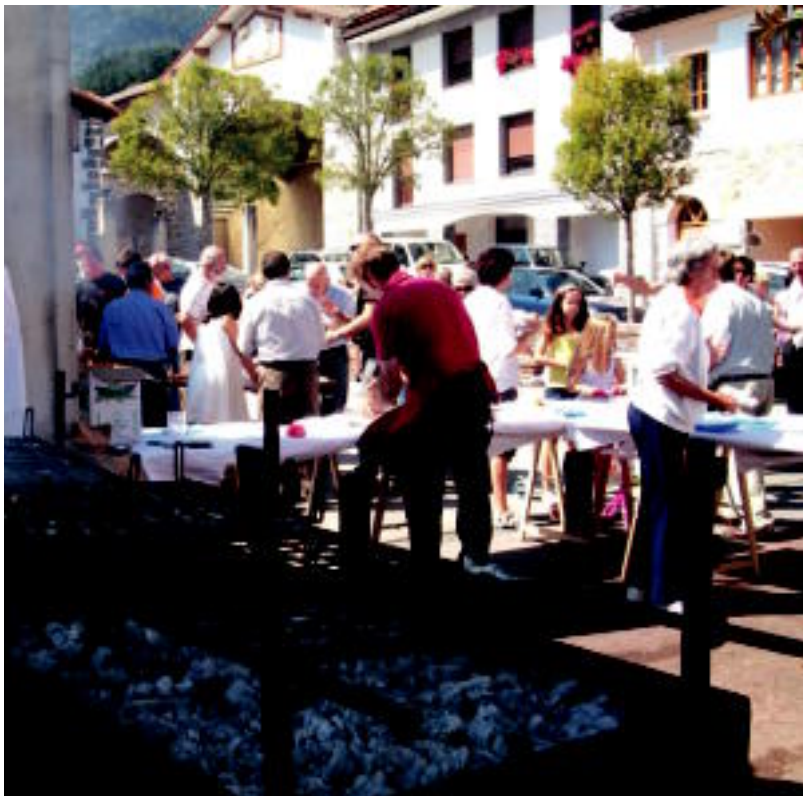
Alkizan larunbata arte izango dute jai giroa; herenegun, besteak beste, txakolin dastaketa egin zuten. S.GOMEZ