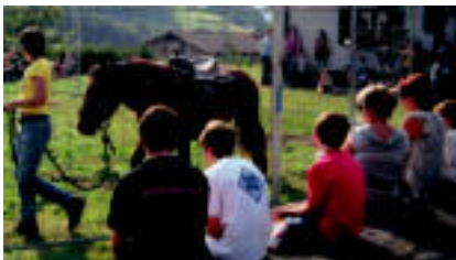
Eduaiako ostriakoko kontzertua oso jendetsua izan zen. Igande arratsaldean, Zaldien Doma izan zuten. HTZA SARA GOMEZ