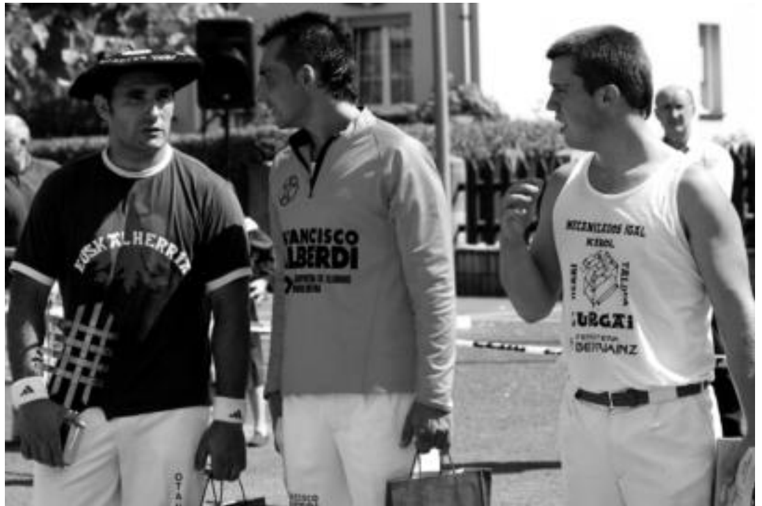
Otaño, Zaldúa eta Kañameres sari banaketa ekitaldian. HITZA