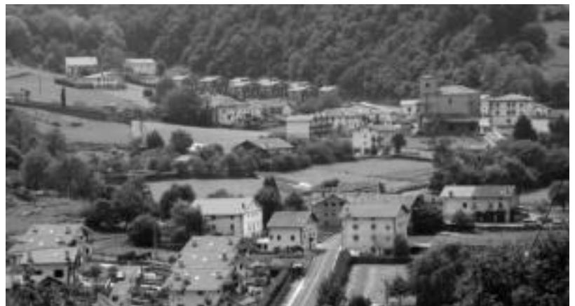
Albiztur bezelako landa eremuko herrietan maiz izaten dira arazoak teknologia berriak erabiltzeko orduan. EEZEIZA

Zozketa horretan iritetan den zenbaki sarituaren berri TOLOSALDEKO ETA LEITZALDEKO HITZA egunkarian argitaratuko da ostegun, hilaren 9an. Zenbaki saritua duenak 15 eguneko epea izan-go du aurkezteko, bestela, saria galduko lukeela jakinarazi dute.