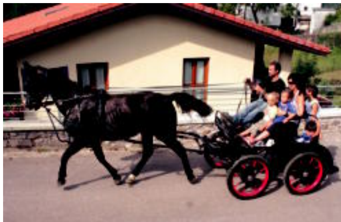
Elduainen zaldiek eta haurrek izan dute protagonismoa. I. GARCIA