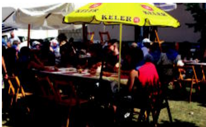
Lizartzan eguzkitakoak jarri zituzten eguzkiari aurre egiteko herri bazkarian. ESTI EZEIZA