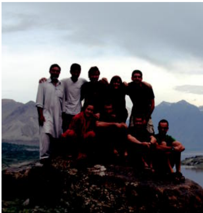
Eskualdeko mendizaleak Pakistanen.