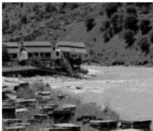
Uholdeen ondorioz inkomunikatuta geratu da Baltistan. HITZA