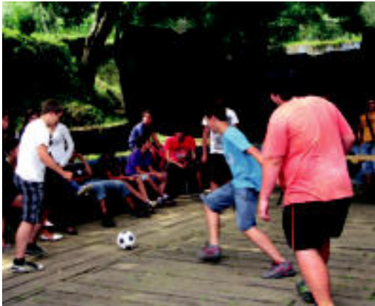
Hamaiketakoaren aurretik futbolearen aritu ziren gazteak. E. EZEIZA