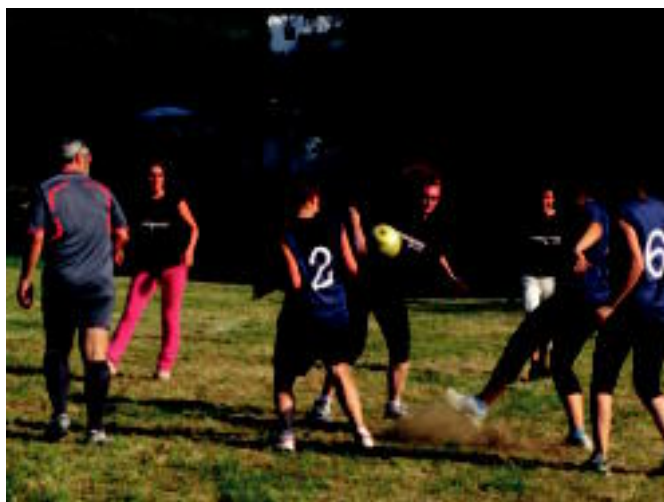
Alkizan herritarren arteko futbol partidak jokatu zituzten atzo. ESTI EZEIZA