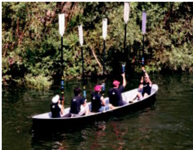
Izaskungo Bandera Bonberenea Sutanek irabazi zuen atzo Oria ibaian. I. GARCIA