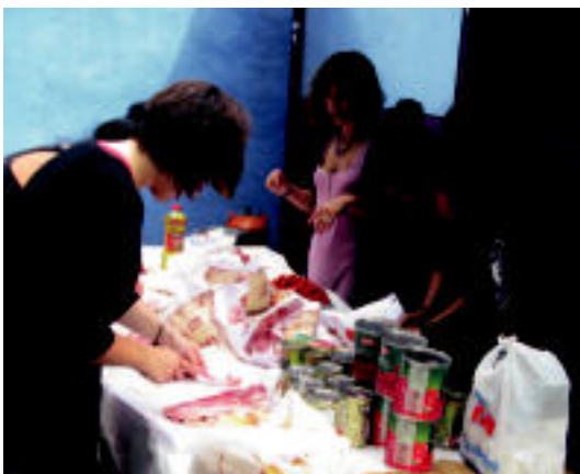
Paella jatea egin zuten bazkaltzeko; goizean zehar sukaldatzen aritu ziren. E.E.

Afalostean, ekimen berezi bat berreskuratu zuten. Hala, zenbait herritarrek Printzesa txikia antzezlanak aurkeztu zuten. Duela urte batzuk, Gazte Egunerako, herriko hainbat gaztek antzerki bat prestatzen zuten, baina, egitasmoa bertan behera geratu zen, eta orain berreskuratzea erabaki dute. Printzesa txikia lan ezaguna nesken ikuspuntutik aurkezteko erabaki zuten. Honez gain, anoetarrak arduratu dira euskaratzeaz eta atrezoa egi-teaz. Gazteak ez ezik, helduak eta haurrak ere hurbildu ziren Gaztetxera lana ikusteko. Egunari amaiera musikarekin eman zioten, kontzertuak izan baitziren.