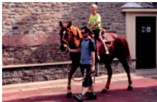
Izaskun auzoan eta Elduainen jaietan jarraitzen dute. I. GARCIA