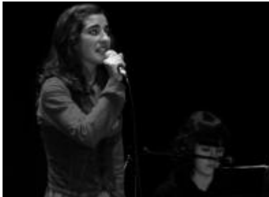
Egigurenek Sarasolarekin batera, emanaldian parte hartuko du. HITZA

Ibarra » Kantuzaleen elkarteak antolatuta, Ordiziako Euskal jaiaren baitan izango da saioa; bi ibartar bertan izango dira.