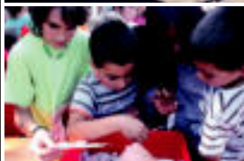
Futbolaren ibil ostenen, jolas-tarako prestatu ziren. L. MAZ