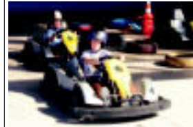
Kaskoa jantzi eta abiduraz goazteko aukera ere izan zuten Elduainen. L. MAZ