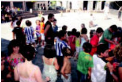
Opariak jaso eta jolasekin hasteko zain egon ziren haurrak. Gogotsu zuden. L. MAZ

Alkiza, Elduain, Izaskun auzoan eta Lizartza festan murgilduta dabilte. Atzo hasi zituzten jaiak, Izaskun auzoan, igande goizeko diñarekin bukatzen badira ere, besteek egun gehiago izango dituzte partaidetarako. Elduainen, asteazkena jai eguna izango du. Lizartzan, asteartea eta asteazkena izango dituzte eta Alkizan, asteazkenaz gain, hurrengo ostiralean eta larunbatean ere festa izango da nagusi. Alkizarrak izan ziren lehenak festei hasiera ematen eta haur jokak izan zituzten. Ondoren, herri afaria eta Elustondo anai-arrebekin erromeria izan zituzten.