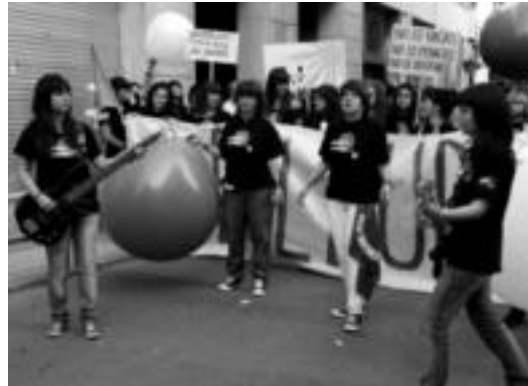
Eutsi taldekoak Beldur Barik abestiaren bideoklippean. HITZA

Kultura » Eutsi Legazpiko neska taldea eta Box.a Tolosako artistez osaturiko taldea ariko dira, 22:30etik aurrera, Plaza Berrian.