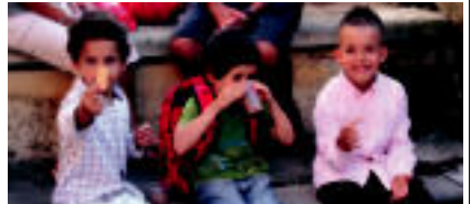
Izaskun auzoan, txokolata bikotxoekin banatu zuten. GARCIA