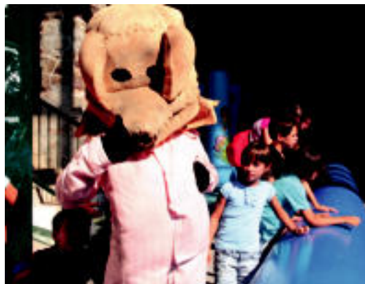
Urdelar txerriaren jaitsierarekin hasi ziren jaiak Elduainen atzo. ENERITZ MAIZ