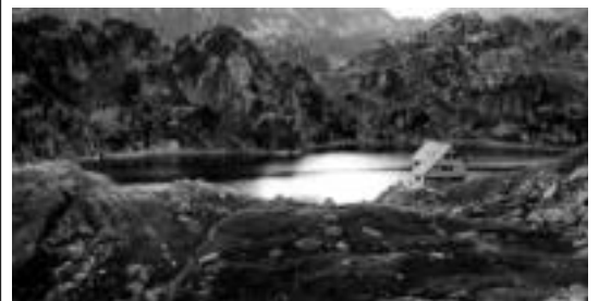
Colomeraseko lakua eta atxepetxean egoteko aukera izango da. HITZA

nak edo informazio gehiago behar izan ezkerre, ondorengo telefonora deitu behar da: 649 71 71 82ra. Mendi Elkartearen ere horretarako aukera egongo da.