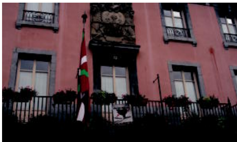
Villabonako udaletxean ikurrina zapi beltzarekin zintzilikatu dute. I. GARCIA

ITSASOA 18:00etan hasiko den sailkapen proban 24 traineruk hartuko dute parte eta olatuak edukiko dituzte 6