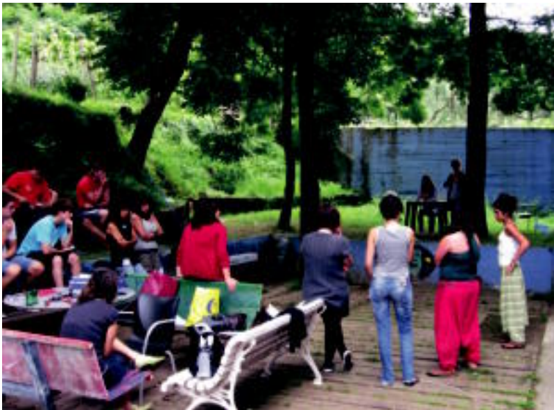
'Printzesa Txikia' antzezlanaren entseguko une batean ateratako argazkia. HITZA