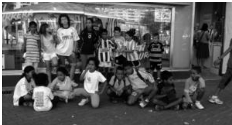
Ekintza ugari antolatu dituzte saharar gaztetxoentzat. Irudian, Realaren estadioa bisitatu zutenekoak. HITZA