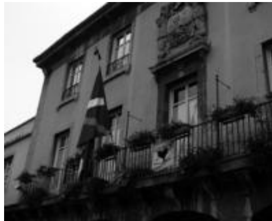
Udaltxean ikurrina zinta beltzarekin aurkitzen da. I. GARCIA

Villabonako Udala, Ezker Abertzaleko korporazio kideak.