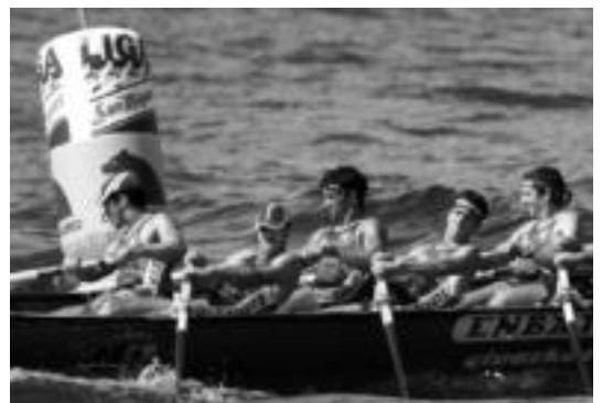
Astillero (goian), San Pedro (erdian) eta Zarautz (azpian) San Miguel Ligan aritzen dira. SAN MIGUEL LIGA