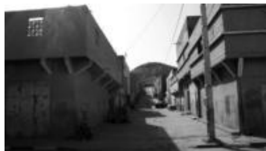
Mendealdeko Sahararen kaleak tapatutako pintaketaz beteak. HITZA

Politika » Marokoar polizia Sahararen aldeko 14 ekintzaile kanariar jipoitu dituzte manifestazio batean parte hartzeagatik.