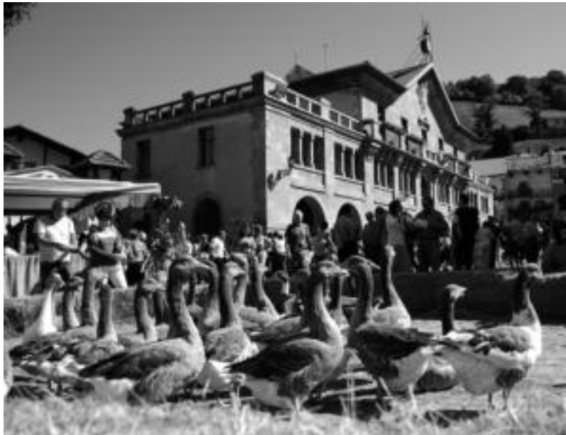
Baserriko animalien erakusketa nahiz baserri tresneriarena izango dira igande goizean, Leitzako plazan. S. GOMEZ

Bisitariak era aktiboan parte hartzeko ekintzak ere egongo dira,