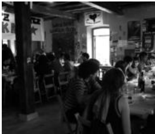
Paella erraldoi bat sukaldatu zuten atzo eta gaztetxean bertan jan. E. EZBIZA

Ostiral gauean egin zuten Lehen Korto Lehiaketako proiektzioa. Azkenean, bederatzitan aurkeztu zituzten txapelketara. Altsasuko bokstek, Tolosako batek eta Leitza-ko hiruk.