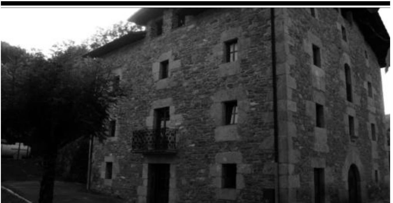
Osingoienerako etxebizitzak prest aurkitzen dira. Inguruan urbanizazio lanak egiten ari dira. A. IMAZ