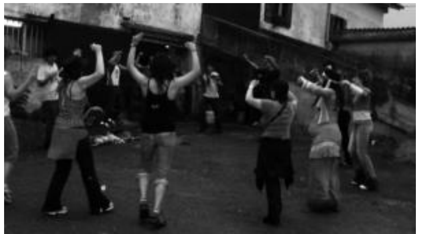
Hamaika dantza saio egingo dituzte herritarrek jaietan. Irudian, iazko festetako une bat. HITZA

Azken egunean dantza saioak eta herri kirolak nagusituko dira.