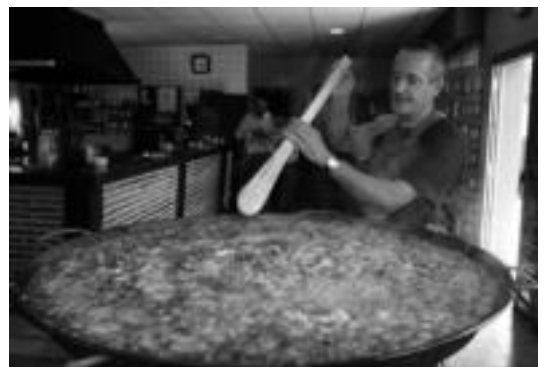
Koadrilen egunean herri guztian barrena zabaltzen dute jaiak. HITZA