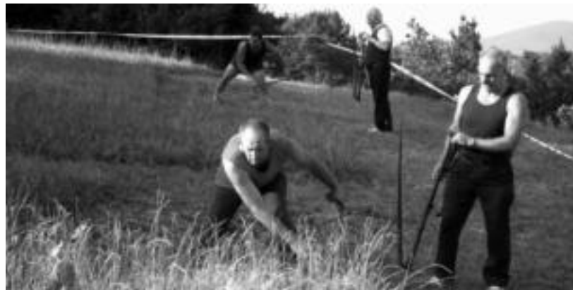
Herriko kirol proban herritarrek ariko dira nor baino nor. HITZA

Egun berean tradizio handiko beste ekitaldi bat izango da, sagardo dastaketa. 19.ena da aurtengoa eta Gaztañaga, Rezola, Elutxeta, Sarasola, Barkaiztegi, Otsua-enea, Petritegi, Izeta eta Lizeaga sagardotegiak hartuko dute parte.