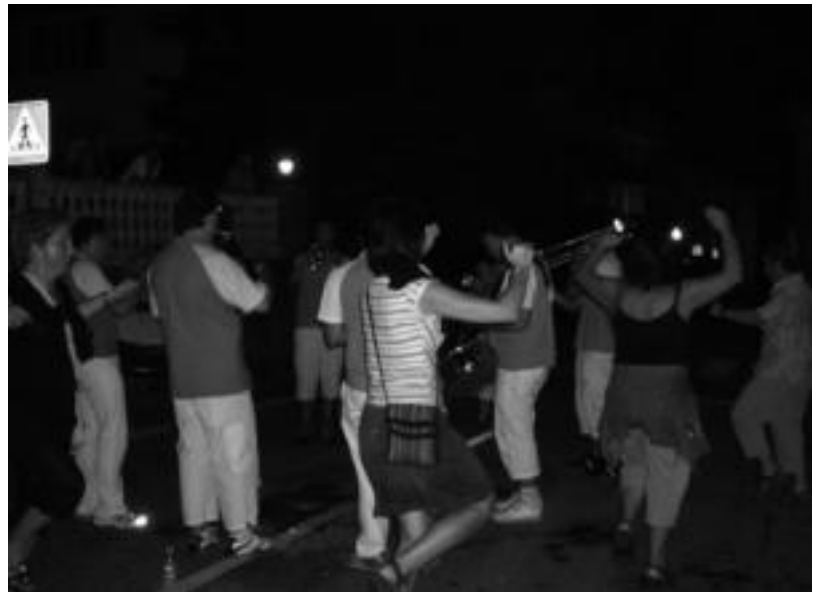
Aurten ere, txarangen doinuekin, dantzan ibiliko dira herritarrek, herriko kaleetan. HITZA

Umeen egunean jokoak izango dituzte egun osoan, eta gauean herria mozorrotu egingo da, eta mozorro onenak saria ere jasoko du. Azken egunean paella lehiaketa ere egingo dute herritarren artean. Eta jaiez sei egunetan zehar nahikoa gozatu eta gero, agur esateko unea elbiaren entierroak jarriko du.