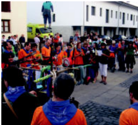
Pello Joxeperen jeitsierarekin hasiko dira Larraulgo jaiak. HITZA

Karretila zozketatu ohi dute urtero, eta hau San Bartolome egunean egingo dute plazan.