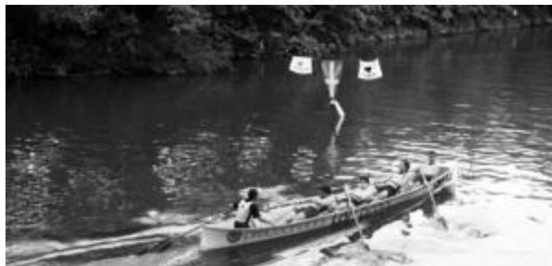
Eresargi abesbatzakoek eman zieten hasiera jaiari; gero batel estropada jokatu zuten Ori ibaian. E. MAIZ

Leitza » Aste guztian zehar urteurrena ospatzen aritu dira, eta atzo, bazkariarekin, eta musikarekin eman zieten bukaera hauei.