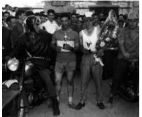
Berastegiko jaietako irudiak. Goian aizkolariak eta behean txirindulariak. HITZA