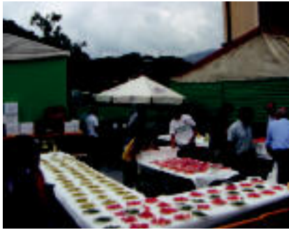
Herriar egari bilzen dituen ekitaldia da urteroko egiten den tomatearen eta piperraren festa. » 17/24

Ibarra » Udalak bere kabuz antolatu ditu aurten herriko jaiak; aurten ere egitaraua anitza eta oparoa osatzen ahalaginduko dira.