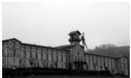
Tolosako Iurreamendi egoitza. HITZA

Garraio sailako komunikazio ar- duradunaren esanetan, oinarritzko proiektua «anexo» batean bidali zitzaizen iaz, konstruktiboaz berriz, ez dute ezer aipatu.