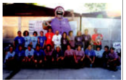
Aurten ama diren eta ez diren arteko sokatira desafioa jokoan izango da Bartolotan. » 17/24

Ibarriko Gazteak ere bat egin du Bartola herri ekimenearekin, eta jaietan bertan, kontzertuak izango dira bertan. Bestalde, bertalaguneez egun guzitan zehar zabalik egongo da.