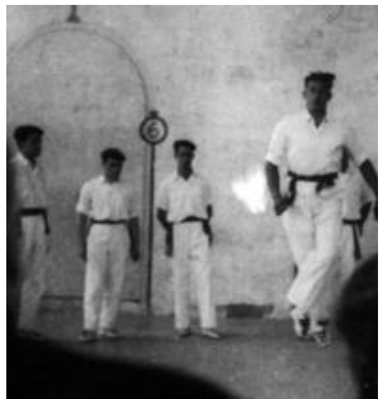
Ikaztegiako jaietan dantzarien emanaldia pilotalekuan.