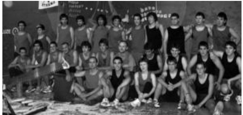
Ikusmin handia sortzen du herriko gazteen arteko herri kirol saioak. HITZA

Koadrilen eguneko paella jatea berriz, duela hiru urte martxan jarritako ekimena da, baina jada, finkatua dago, eta egitarautik kendu ezinezko bazkari bihurtu da.