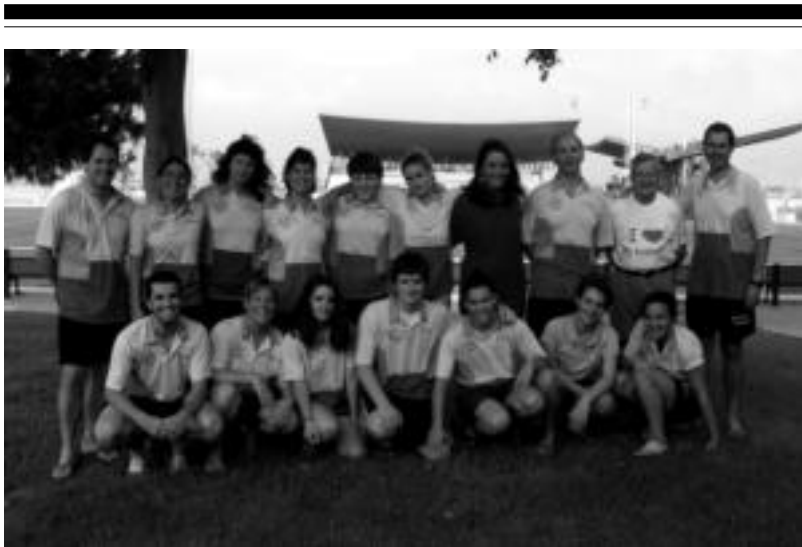
Espainiako txapelketan Tolosako Igarondo Urpekoak taldeko kideak. HITZA