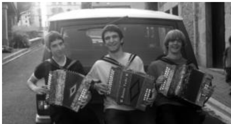
Herriko gazteak eta trikitalariak arduratuko dira jai giroa zabaltzeaz lehen egunetik. HITZA