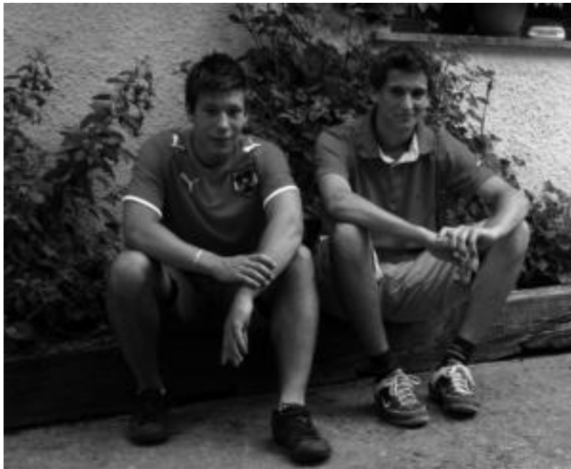
Austriar gazteak baserriaren atarian. MIKEL ARTOLA

Praktikak egiteko hainbat toki dituzte aukeran, hasi Alemaniatik eta Euskal Herriraino. Aukera egiterako garaian kontuan hartzen dutenez galdetuta, «hizkuntzaren garrantzia» azpimarratu dute biak, hori omen da hona etortzeko izan duten arrazoia nagusienetakoa. Austrian Alemaniera hitz egiten dutela diote, eta pixkanaka ingelesa eta espainiera bezalako hizkuntza handiak ikasten hasten direla. Eurentzat «oso garrantzitsua» omen da menderatzen ez duten hizkuntza batean trebatzea, eta hemen horretarako aukera omen dute. Hala eta guztiz ere, badakite Orendain eta Altzon jendeak euskaraz egiten duela, eta hitz bat edo beste behintzat ikasiko