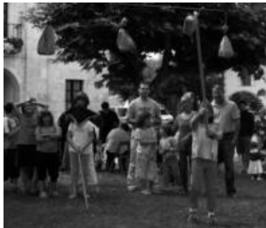
Ume jolasek ere ez dute hutsik egingo aurten Orendainen.

Jaietako azken egunerako bada berrikuntzarik, izan ere, aurten patata tortilla lehiaketako parte-hartzaileek etxetik prestaturik eman ordez, bertan egin beharko dute tortilla. Ondoren prestatutakoekin egingo dute afaria.