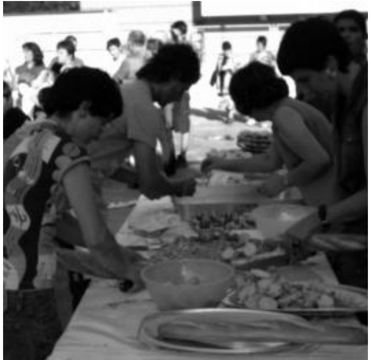
Pasa den urteko festetako irudiak. Herri krosa eta herritarrak sagardo proban parte hartzen. HITZA