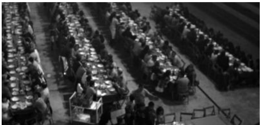
Pasa den urtean bezala, herritarren bazkaria egingo dute aurtengo jaietan.