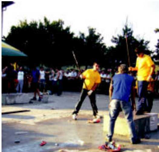
Herriko gazteen arteko demak ikusmin handia piztuko du.

Aurtengo jaietako egitarauak ez du aldaketa handirik izango beste urteetakoekin alderatuz. Hala, urtez urte errepikatzen direnak eta «harrera oso ona» izaten dutenak aurten ere lekua izango dute. Jai Batzordetik lehenengo egunean izango diren herriko koruaren emanaldia eta dantzarien saioak, aurten 19. urtea betetzen duen larunbateko erlojuaren aurkako txirrindulari proba, larunbateko he-