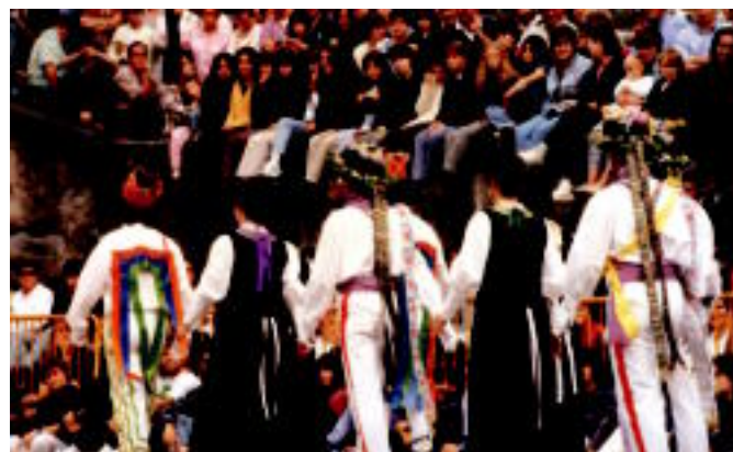
Txistulariak eta dantzariak ere ez dira faltako aurtengo Santiburtzioetan; oraingoan gainera emanaldi berezia prestatu dute Aurrera elkarteko kideek. AURRERA