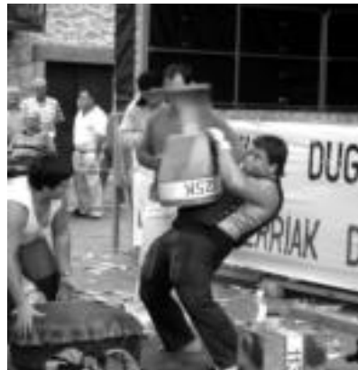
Abuztuaren 16an, eguerdian, harri jasotzen eta aizkoran ariko dira. HITZA

Azken egunean mozorroek hartuko dute protagonismoa. Gaia norbere kontura joango da, eta onenari saria emango diote.