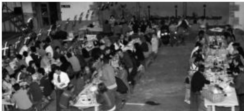
Herri afaria izango da aurten ere Baliarraingo jaietan. HITZA

Igandean izango den herri kirol saioa urtero antolatzen dute, baina aurtengoa «bereziagoa» izango da, herritarrek hartuko baitute parte. «Ezkondu eta ezkongabeen artean egingo dute lehia eta ikusgarria izango da». Egun horretan bertan izango den Txirindulari Igoera ere nabarmentzekoa da tradizio handikoa baita.