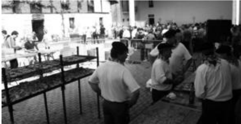
Kultur Astean bezala, jende ugari bilduko da herriko plazan egingo duten sagardo dastaketan. HITZA

Bigarren eguna ekitaldiz beteaz izango da. Batetik, arrakasta handia izan ohi duen eta aurten zortzigarren urtez egingo duten mus txapelketa izango da. Edonork parte hartu ahaliko du, eta izena emateko 15:30etik 16:00etara bitarte frontoian agertu besterik ez du egin beharko. Hori bai, 30 euro ordaindu beharko dira bikoteko. Lau erregetara, bost hamarrekotara