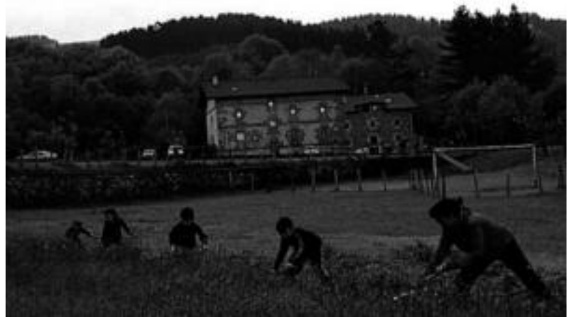
Igandeetan egin dute sega ikastaroa Gaztelun azken asteetan. HITZA

Jaietako bigarren egunean, berri, herri kirolak, bertsoak eta dantza nagusituko dira. Antolatzailerek emakumezkoen binakako sega proba nabarmendu dute: «Gaztelun segak garrantzi handia du, segalari handiak baitaude herrian, eta proba hau polita izango da; azken hilabeteetan herrian sega ikastaroa antolatu dugu igande arratsaldeetan, eta proba honekin ikusiko da ikastaroan parte hartu dutenek ikasi dutena». Herritarrez nahiz kanpotarrez osaturiko zazpi bikotek eman dute izena probarako.