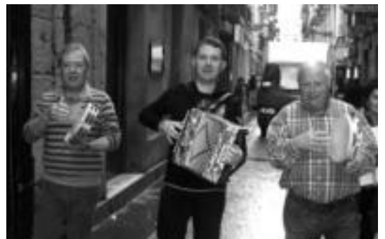
Kupela taldeak giro polita jarriko du azken eguneko gauean. IELORZA