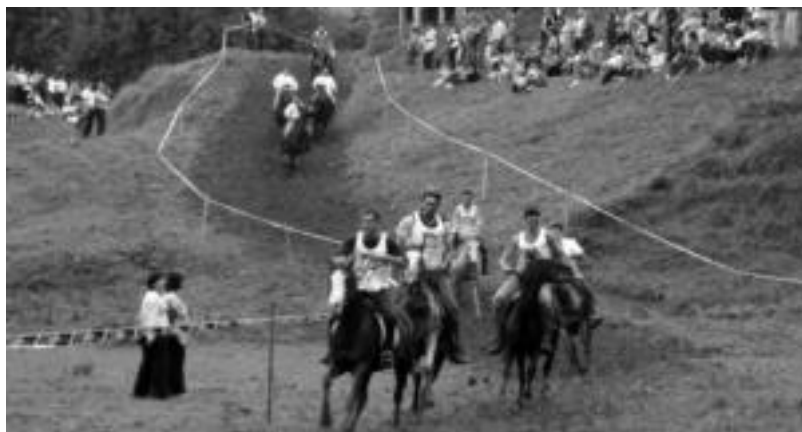
Hilaren 22an, igandean, zaldi karrera egingo dute Bidaniako jaien barruan. HITZA