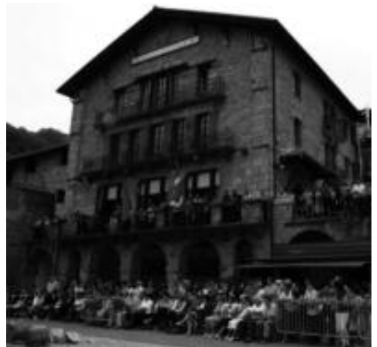
Kusmin handia sortzen dute Aresoko festetan herri-kirolek. HITZA

Herri bazkaria da Aresoko jaientan, arrakasta gehien duen ekitaldietako. Ia herri guztia elkartzen da bertan, 250 bazkaltiar baino gehiago elkartzen baitira urtero. Pake-toki eta Larrea elkarteak arduratzen dira dena prestatzeaz. Txandakatu, batzuetan txekorra jartzen dute jateko, eta besteetan zikiroa. Oraingoan, azken hau katzen da. Bazkaldu eta gero, bertso-pilota izango da eta sagardo dastaketa.