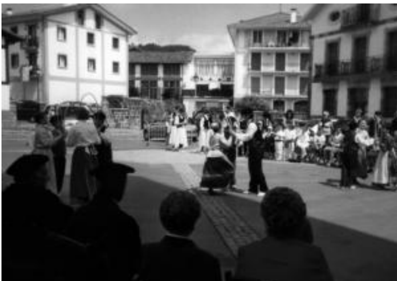
Jaietan dantza emanaldiak ohikoak izaten dira. HITZA