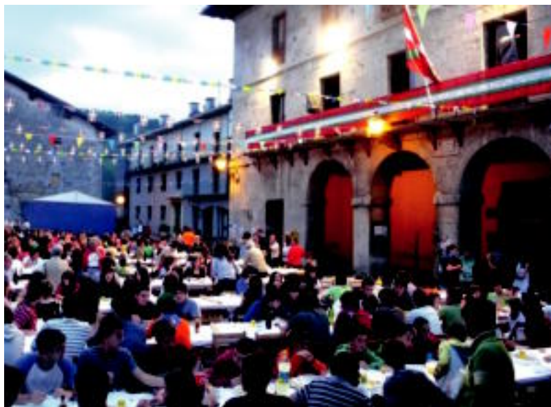
Jaietako lehendabiziko egunean egingo dute aurten ere herri afaria. HITZA

Herri kirolak eskualdeko herri gehienetako jaietan egitarauetan