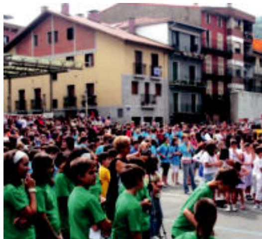
Atzo hasi ziren Santio jaiak Villabonan. E. MAIZ

AZPIEGITURAK Inaugurazio ekitaldian herriko alkatea, Dorronsoro, eta besteak beste Gipuzkoako Ahaldun Nagusia, Olano, egon dira 7