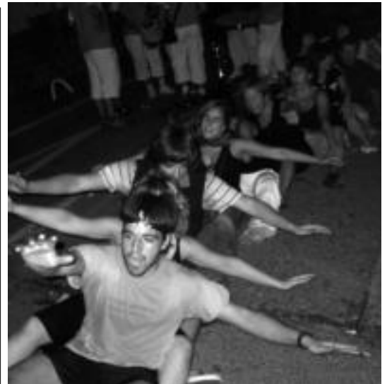
Herriko gazteak, ia zoz festetan, gozatuz. HITZA