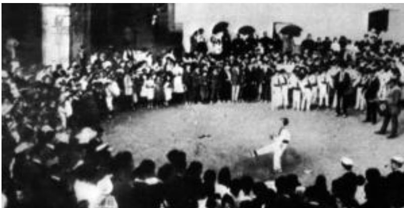
1912ko San Bartolome jaietako irudia da hemen ageri dena; plaza beteta, dantzari begira. HITZA