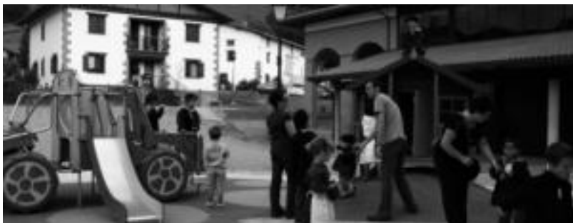
Zinta moztu ostean, herritar guztiak plazara sartu ziren. Txikienek parke berria ere estreinatu zuten. E. MAIZ