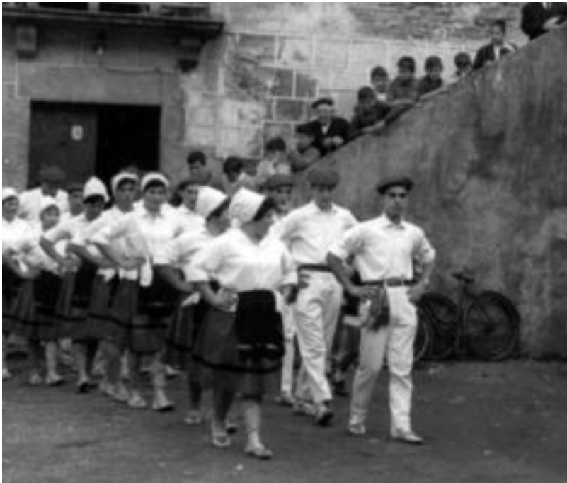
Amezketako aspaldiko argazkia. Dantzariak herriko festetan. HITZA