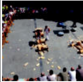
Herri kirolak aurten ere izango dute tartea Sanbartolomeetan. » 17/24

Jateko eta edanekoaz gain, herri kirolak ere izango dira herriko jaietan. Honenbeste, herriko zaindarren egunaren bueltan izango da zenbait ekitaldi eta ikusizkoen datuak, hori dela eta egitaraua bere osotasunean ezin izan dute helarazi.