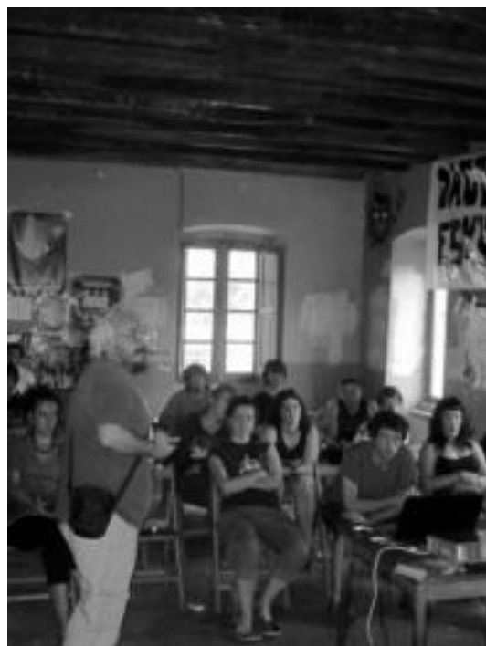
Palestinaren inguruko hitzaldia Atekabeltz gaztetzearan. HITZA

Bihar, hilak 24, egun guztian zehar ospatuko dituzte ekitaldiak, jaia herri guztira zabalduz. 11:00etan plaza kalejiran irten go dira, txistularien laguntzaz. Txupinazoa bota eta hamaiketarako egin ostean, bazkaria izango dute zain. Paella jatea egingo dute, eta arratsaldean, poteoa, kalejira moduan. Hortik aurrera musika izango da nagusi, hip-hop nahiz rock kontzertuekin.