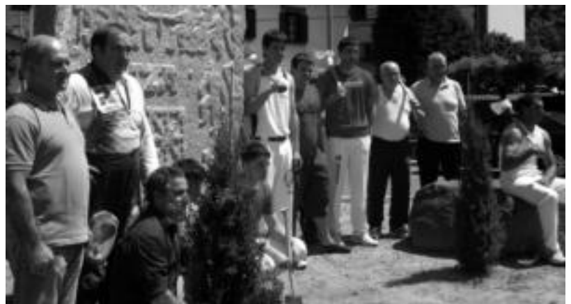
Maiatzeren 24ean inauguratu zuten eskultura. Herri kirolari ugari bildu ziren aurkezpen ekitaldira. E. BELAUNZARAN

Tolosaldeko eta Leitzaldeko HITZAn jarri eta Gipuzkoako beste 4 Hitzetan DOAN agertuko da