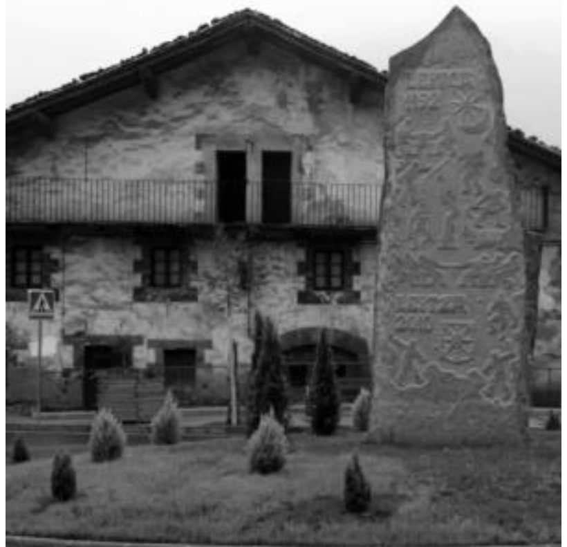
Eskulturar, herri sarrerako biribilgunean egiten du ongietorria. E. MAIZ

Inaugurazio xumea egin zuten eta herri kirol munduan gaur egun dabilzanak eta lehen ibiliak elkartu ziren. Irigana, oraina eta etorkizuna. Hemendik aurrera, Leitzak egunero izango ditu gogoan herri kirolariak nahiz beste edozein kirolariak ere. Baita kirolzaleak ere.