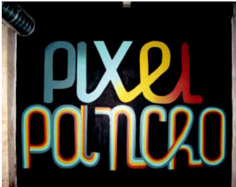
GKo galerian arropak ere saltzen dituzte. Orain Pixel Panchoren erakusketa ikusi daiteke bertan, baina bihar bertan kenduko dute. O. PEÑAGARIKANO