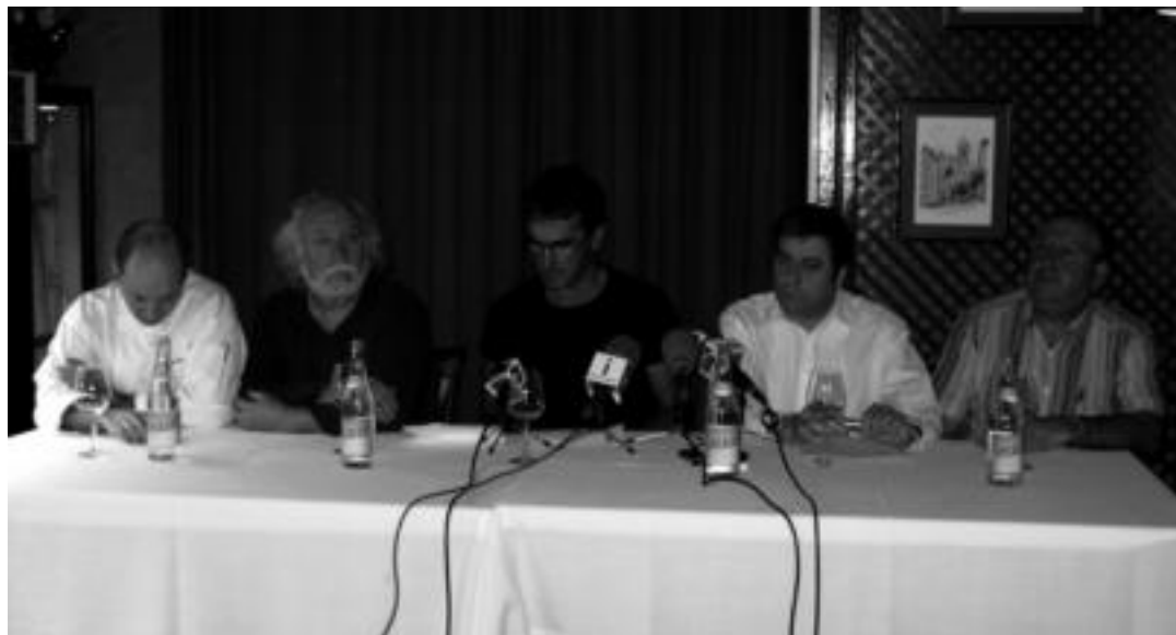
Urteurreneko ekitaldietako antolatzaileek aurkeztu dituzte ekitaldiak.