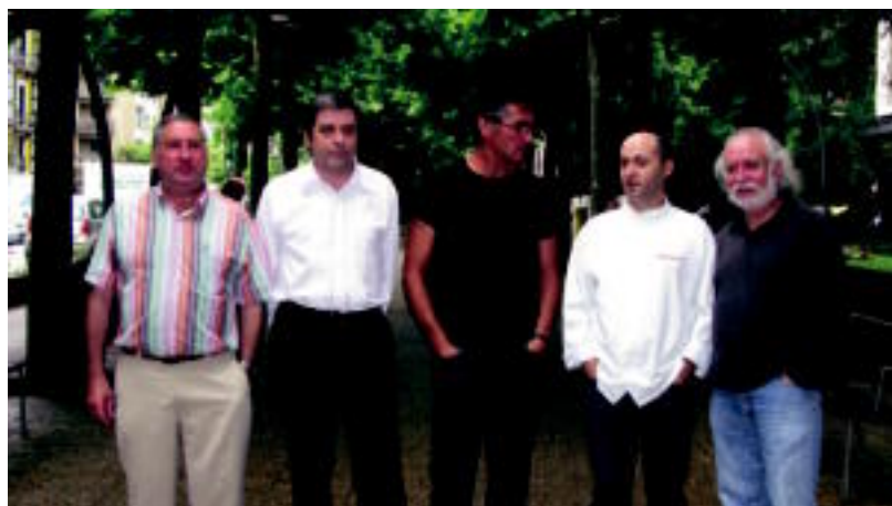
Urteurreneko ekitaldietako antolatzaileak Tolosako San Frantzisko pasealekuan. O. IGUARAN

BERTSOAK Trabukoren kanta izenez ezagutzen den bertso sortako gertakariak arakatzuz osatu du lana 2