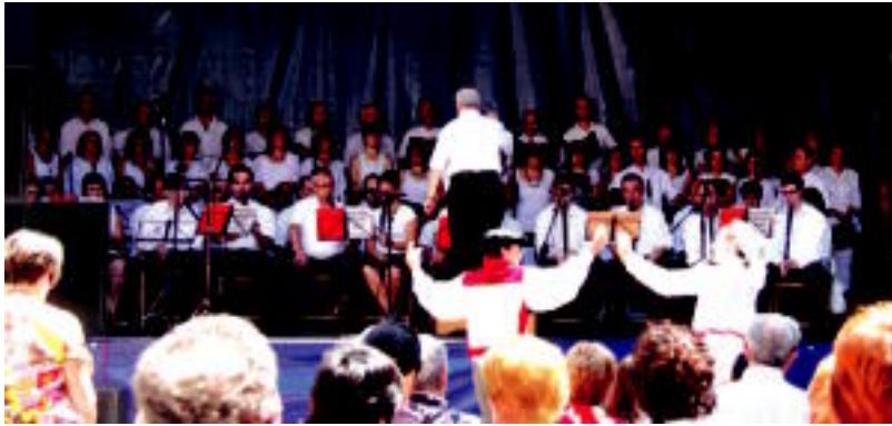
Txintxarri abesbatzaren hereneguneko emanaldia.