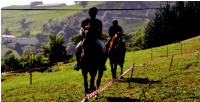
Zaldi karrera ere egin zuten Asteasun. S. GOMEZ