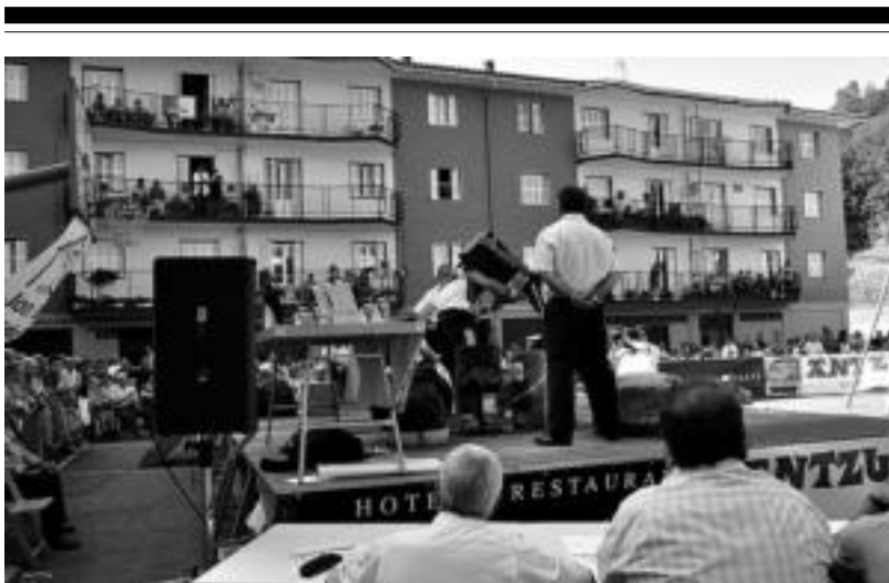
Jende ugari elkartu zen Alegian herenegun, V. Txintxarri Saria ikusteko amoz.