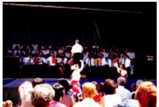
Txintxarri abesbatzaren eta Sutarri dantza taldearen emanaldia. HITZA

POLITIKA Bihar erabakiko dute Londresen Ibarluzea ibartarra estraditatuko duten ala ez; Zelarain billabonatarra berriz gaur epaituko dute Madrilen 2