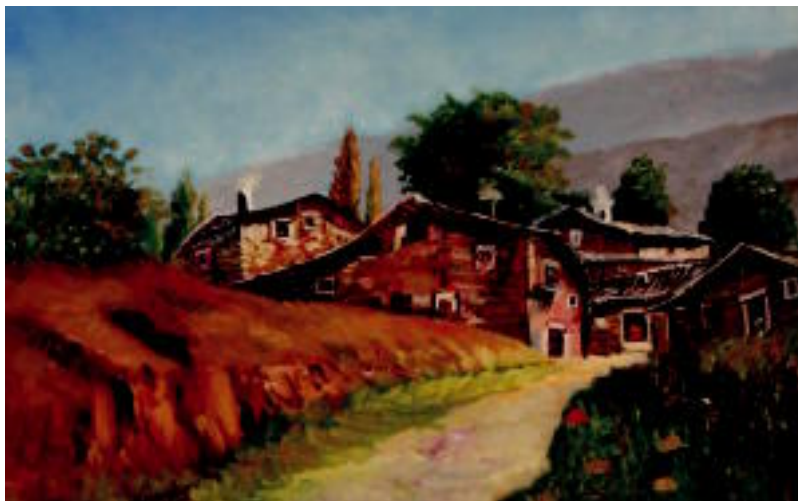
Erakusketan ikusgai eta salgai dagoen lanetako bat. ENERITZ MAIZ