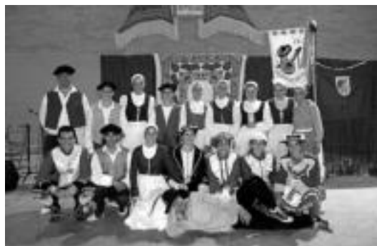
Udaberri dantza taldeko kideak. HITZA

Hilaren 30ean, Tolosako Udaberri dantza taldeko kideak Valladolideko Viana de Cega herrira doaz. 1988. urteaz gero, urtero ospatzen den jaialdira gonbidatu ditu bertako Rotonda de Viana de Cega dantza taldeak.