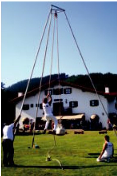
Albizturren herri kirol erakustaldia izan zen; lastoa altxatzen eta aizkoran egin zuten. S. GOMEZ