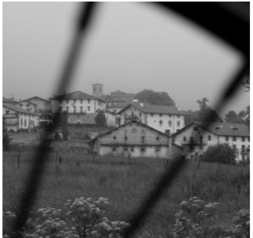
Uitziko herriaren ikuspegi orokorra. JOXEMI SAIZAR

Leitza pasata, Iñaki Perurenak egindako Peru Harri eskulturguneara utziko dugu alde batera Uitziko