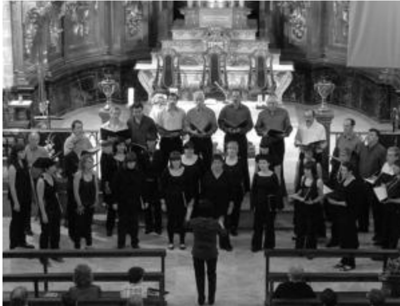
Emanaldi berezia eskainiko du bihar Txintxarri abesbatzak herriko plazan, jaien baitan.