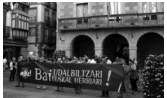
Tolosan Udalbiltzaren aurkako epaiketa salatu zuten herenegun. A. IMAZ

Zazpi urteren ondoren, Udalbiltzaren aurkako epaiketa herenegun hasi zen Espainiako Auzitegi Nazionallean, Madrilen. Bertara 22 euskal herritar deitu dituzte. Fiskalak eta akusazio partikularak, ETArekin lotura dutelakoan, hamarna urtetik gorako espetxe zigorra eskatzen ditu, eta defentsak absoluzioa; ETArekin zerikusirik ez dutelako.