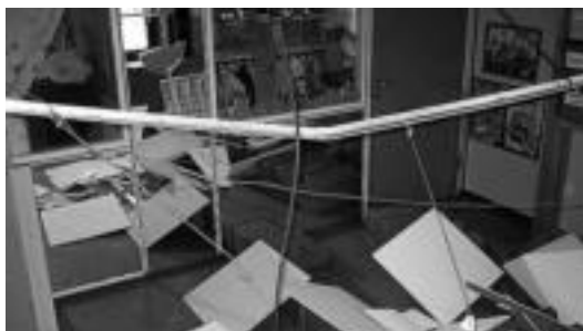
Haurrak bertan zeudela sabaia goiti behera erori zen.

Gertaera eta gero, alkatearen aldetik erantzun egokirik jaso ez dutela salatu nahi dute komunikabi-