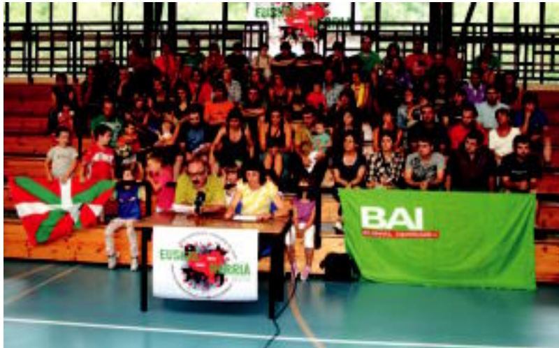
Belabieta kiroldegian agerraldia egin zuten anaitzearen bultzatzaile diren taldeetako kideek. ASIER IMAZ

Duela urte bat inguru, Lizarra eta Ibarrek senidetzea erabaki zuten. Harremanari hasiera 2009ko urriaren 10ean eman zioten Ibarren. Hartu-eman hau bi herrietako talde ezberdinek eraman dute aurrera, halanola, Alurr dantzataldeak, Ibarako gazte asanbladak, Sendi Ekintza elkarteak, Eneko Aritzaren lagunak; Denak areto futbol taldeak, Bartolak, herriko musika taldeek, dultzaineroek... Bultzatzaileen esanetan, «talde hauek dirabihotza, baina Ibarroko herritar guztiak dira gorputza,