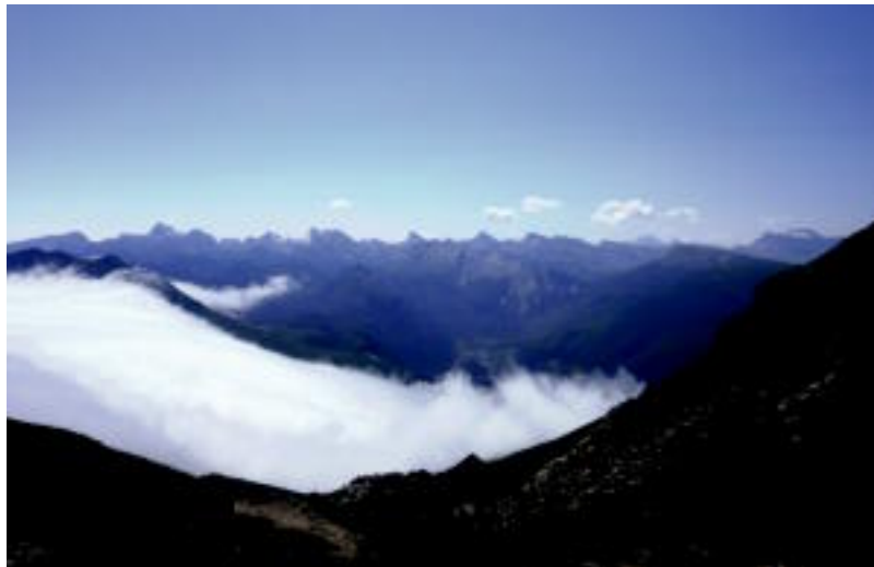
Nekea arintzeko moduko paisaiak topatu zituzten bidean. ARKAITZ ARRETXE

Bidean borondate oneko artzain bat ere topatu zuten, bere autoan eramango zituela esan ziena; baina hitzeko mutilak izanik oinez egin nahi zuten bidai osoa. Uztailaren