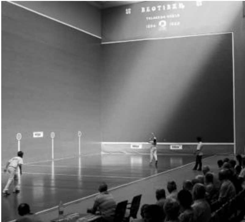
Urtero bezala, HITZA Pilota Txapelketako finalek jende ugari erakarri zuten atzokoan. JON MUJICA