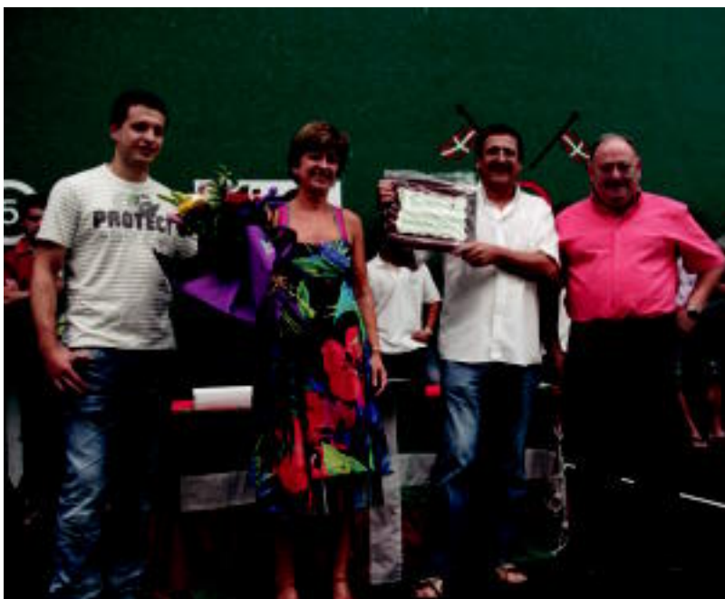
Txapelketako partaideak ageri dira gorako familia argazkian. Beheran Bellosori egindako omenaldia. I. TERRADILLOS