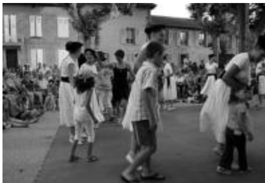
Alurreko dantzari gazteak, ikusleak dantzara aterata. ALURR

Ibarra » 'Munduko kulturak eta ohiturak' izeneko nazioarteko jaialdian lehen urratsak eman ditu dantza taldeak.