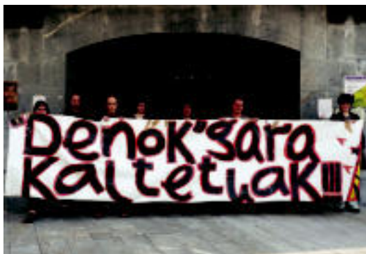
Udaletxearen aurrean elkartu ziren 'Denok gara kaltetuak' lelopean.

Tolosaldeko AHT Gelditu! Elkarlanaren esanetan, «ekainaren 10ean egin zen ezinbesteko desja-