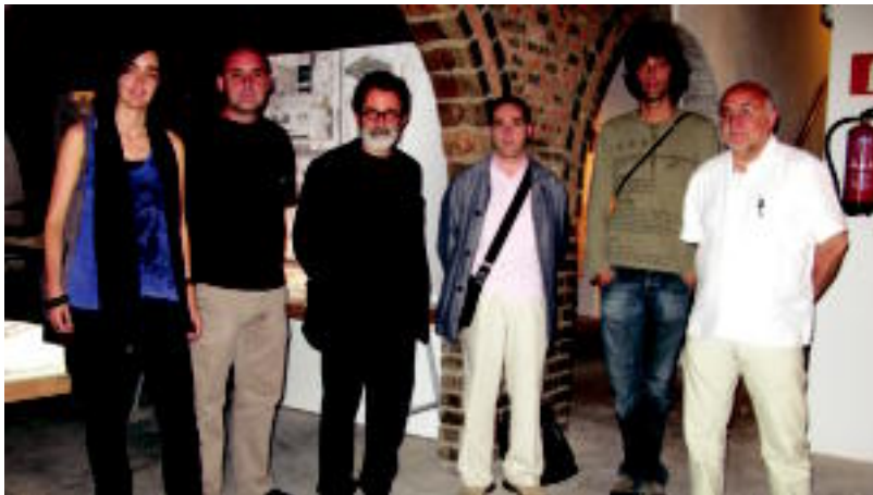
EHUko Arkitektura Goi Eskola Teknikoko irakasleak ere izan dira uhaskako erakusketa ikusten. E. MAIZ

IKASLEAK EHUko Arkitektura Goi Eskola Teknikoko ikasleek landutako lanak dira bertan ikusi daitezkeenak s