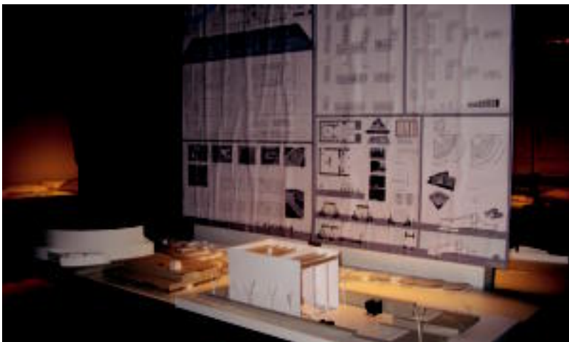
Uhaska guztia proiektu ezberdinez betea dago. Estilo eta mota ezberdinetako eraikuntzak ikus dituzte. E. MAIZ