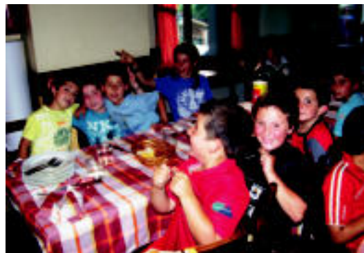
Denboraldi amaierako afaria egin zuten iragan ostiralean.

Eskuz eta paletaz ariko dira (azken modalitate honetan neskek, kadete zein infantilak) eta bukatu berri den denboraldian egin duten bezala, hiru herrietako frontoiak erabiliko dituzte. Udako atsedendaldian osten, iraileko lehen egunetik hasiko dira, berriro ere, entrenamenduekin.