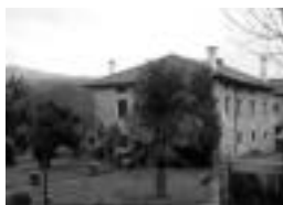
Nagusi Etxea. HITZA

jarriko baitute bere omenezko plaka. Oroigarria agertzeaz gain, salda, haragi egosia eta beste zenbait otarteko izango dira nahi dutenentzat. Omenaldian bizilagunetz gain Gipuzkoako Gurutze Gorriko lehendakaria eta erakundeko arlo desberdinetako hainbat zuzendari eta boluntario ere izango direla agertu dute. Hauekin batera, udal-letxeak ere agertzekotan dira.