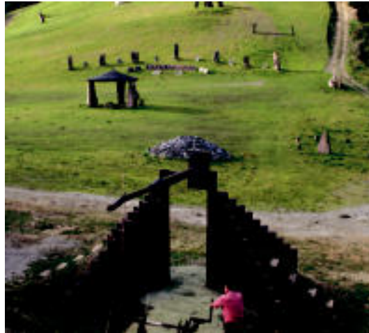
Perurenatarren Peru Harri museoaz egazutzeko aukera eskaintzen dute. A.I.

baita, Peru Harri harriaren parkea ere; eta azkenik, Saralegiren Arro baserria