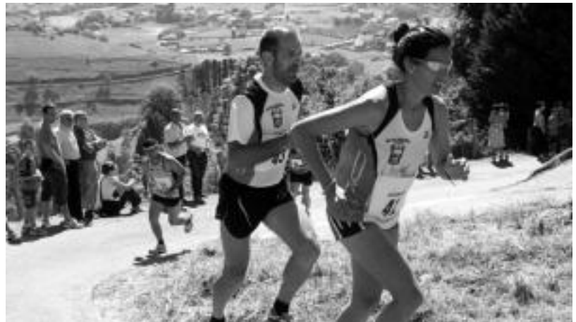
IX. Kros Igoerako parte hartzaileetako batzuk Santamañarako bidean. I. LAHIDALGA

Santamañako festei hasiera, hurrengo ostiralean emango diete Tranpazuloren igoera eta txupinazoarekin. Ondoren herri afaria egingo dute. Eta goizaldera arte, Kupela talderekin erromeria izango dute. Eta txokolata beroa hartzeko aukera ere izango da.