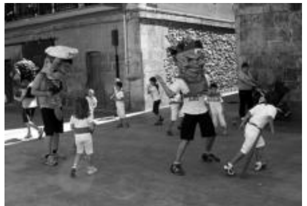
Buruhandiak gaztetzoen atzetik korrika ibili ziren. i.t.