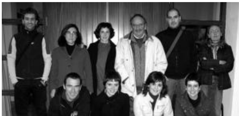
'BerrobiBerri' aldizkariko lantaldea. HITZA

«Taldeen kontzertuek berebiziko garrantzia hartu duten honetan ez dugu ulertzen nola SGAEk ez dituen kontzertu aretoak laguntzen euren promozioa eta zabalkunde hobetzeko», gaineratu du.