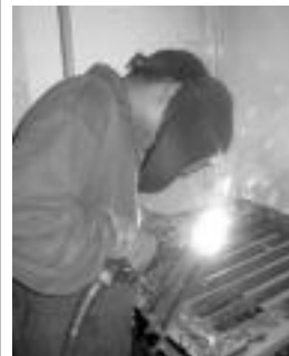
Soldadura eskainiko dute. I. TERRADILLOS

Prestakuntza Profesionalerako Hastapeneko Programak Eusko Jaurlaritzaren Hezkuntza Sailak sustatzen eta finantzatzen ditu eta guztiz doakoak dira. Hauen egutegia irailetik ekainera izango da, 08:00etatik 14:00etara.