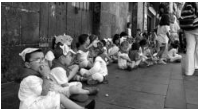
Gaztetz ugarri jantzi ziren atzokoan zuri-gorritz. i.t.