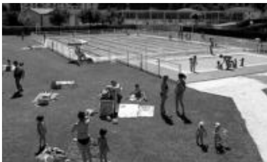
Igerilekuaren alboan dagoen zelaietan, eguzkia hartzeko aukera dago. E. EZEIZA