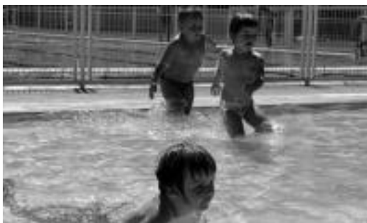
Ettxeko txikienentzat sakonera gutxiko igerileku bat ere badago. E. EZEIZA

Igeri egiten ez dakitenek, uda honetan ikasteko aukera bikaina dute Leitzako udal igerilekuan. Ikastaroak antolatu dituzte. Hauek abuztuaren 16an hasiko dira eta irailaren 1ean amaitu. Saiok ordu erdikoak izango dira eta adin guztietako jendearentzat. Izen-ematea hilabete honetan zehar egin daiteke, igerilekuan bertan.