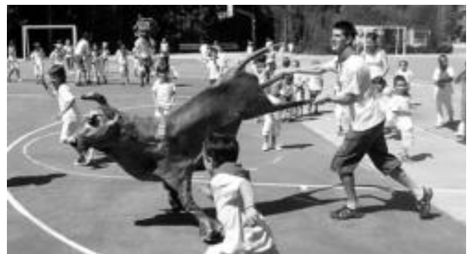
Laskorain ikastolan ere egin zuten sanferminetako entzierroa. HITZA