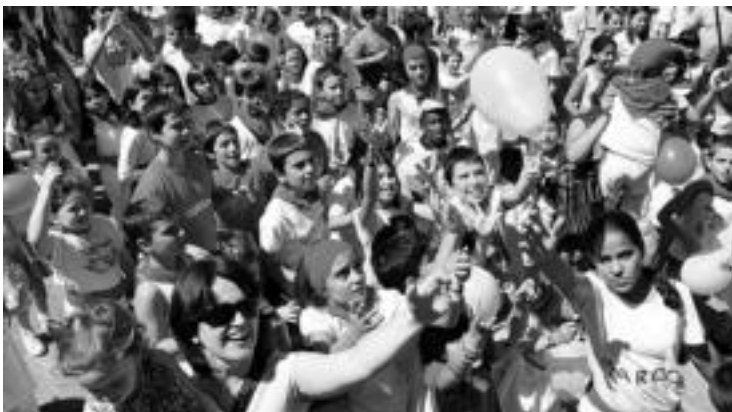
Txupinazoaren ostean goxokiak eta globoak banatu zituzten Plaza Berriko kioskotik. i.t.

KULTURA ■ Kultur Etxean pintura, argazkilaritza, zeramika, joskintza, egur taila... tailerrak izan dituzte ikasturtean zehar. Herritar ugari hartu dute parte eta ikasi dutena jendaurrean erakusteko aukera izan dute. Izan ere, egunotan egin dutenaren adibide bat dago ikusgai Aranburu jauregian jarri duten erakusketan. Guneko bi solairutan banatu dituzte ikasleen lanak. i.t.