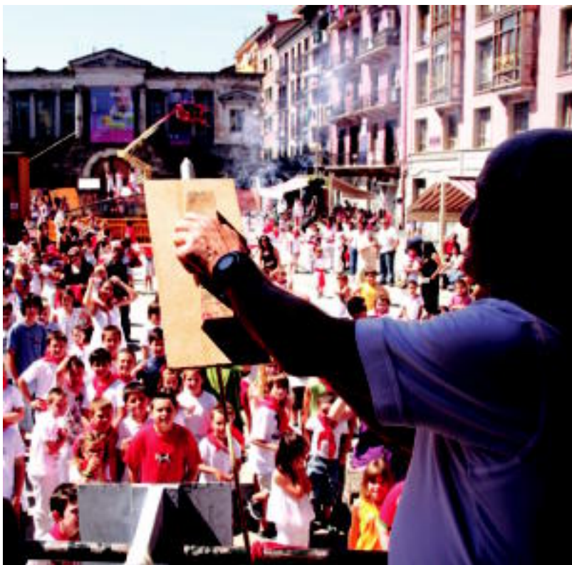
Plaza Berriko kioskotik bota zuten atzokoan txupinazoa. I.TERRADILLOS