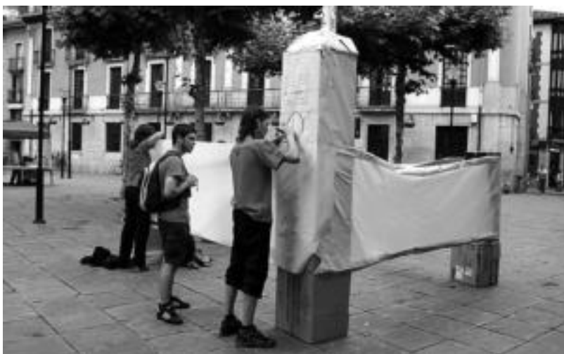
Trianguloa plazan inpernu bat irudikatu zuten larunbat goizean, Tolosako Gazte Asanbladako kideek. HITZA

IBARRA Langostino Moto Kultur elkarteak atzo eman zioten amaiera aurtengo festari. 170 motorzalek hartu zuten parte jaialdian, iaz baino gutxiagok. Horren arrazoitzat, eguraldia, eta Mirandán beste bilkura bat izatea aipatu zituzten antolatzaileek. Atzo goizean jaiki, gosaldia eta motor gainera igo ziren, inguruetatik bira bat emateko. Nafarroa aldera joan ziren, Leitza, Lekunberri, Uitz eta Betelu zeharkatuz. 11:30 inguruan berriz, Trianguloa plazan egin zuten geldialdia, hamaiketako egiteko. Honen ondotik, berriro motortorra igo, eta Ibarrara itzuli ziren, han bazkaria egiteko. Antolatzaileak gustura geratu dira asteburuak emandakoarekin. HITZA