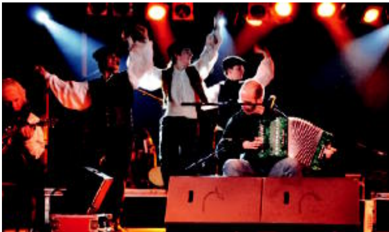
Korrontzi + Oinkari emanaldiaren uneetako bat da hau. Villabonako festetan ikusi ahal izango da berriz. HITZA