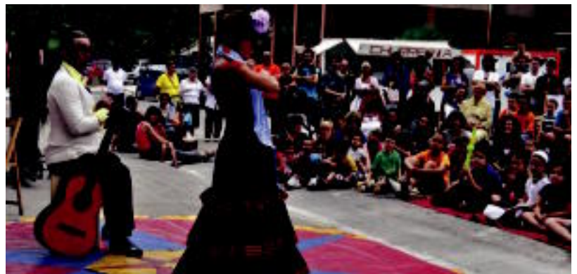
Goian, Amarotzeko Dantza Taldea eta Dantzari Txikien taldea. Behean, arratsaldean egin zen antzerkia. s.g.