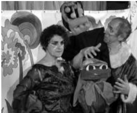
Kixka antzerki taldekoen txotxongilo emanaldia etzi izango da.

Bada, Ezpeleta tabernariaren elkarteak eta Intojai antzerki konpainiak antolatuta, pasa den larunbatean hasi zen Gau Giro ekimenaren osagarri izan nahi duen