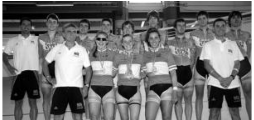
Tolosako txirrindulariek domina ugari lortu dituzte Espainiako pistako txapelketetan. HITZA

Azken asteburuan Madrilen jokatu dira Espainiako pista txapelketak, junior mailan. Tolosako txirrindulariak Euskadiko selekzioarekin aritu dira eta domina ugari