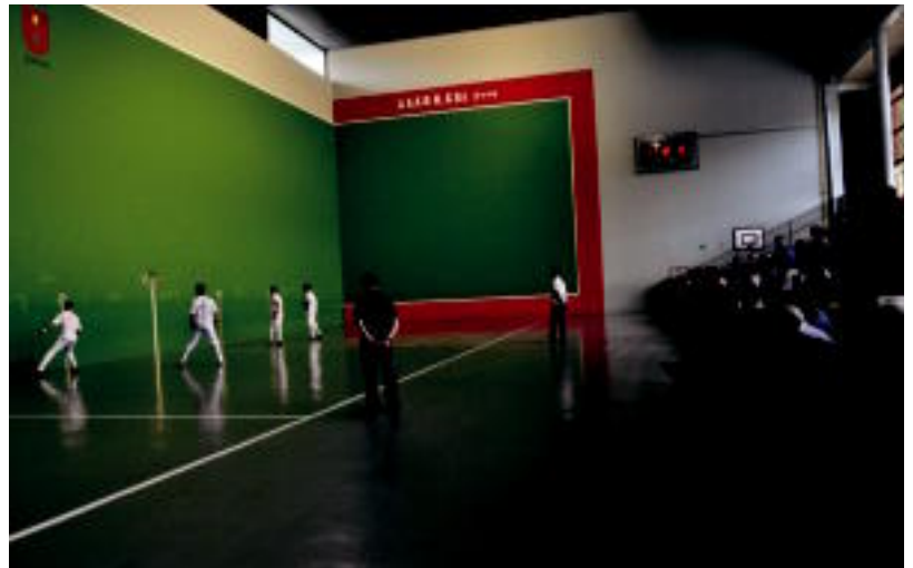
Goian, Asteasuko pilota txapelketako jubilenen partida. Behean, partiden ostean plazan egin zen sagardo dastatzea. s.g.