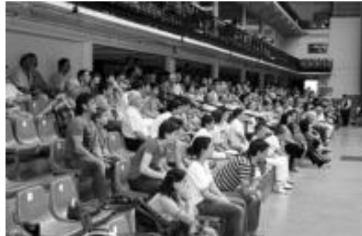
lazo finaletan jende ugari elkartu zen Tolosako Beotibar pilotalekuan. A. IMAZ

Txapelketan Hego Euskal Herriko pilotari ugari hartu dute parte. Finaletara 24 iritsi dira eta hauetatik 10 Tolosaldekoak eta Leitzaldekoak dira.