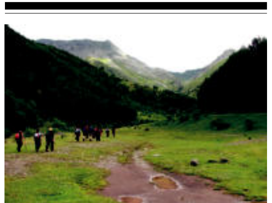
Ozako bailaran ateratako argazkia da hau. HITZA

ANOETA » Azpeitiako Lagun Onak futbol taldeak antolatutik, Euskal Presoen eskubideen aldeko futbito txapelketa ospatu zen pasa den larunbatean. Bertan, ehun lagun baino gehiagok parte hartu zuten, eta horien artean ziren anoetarrek. Egun guztian irau zuen txapelketak. «Gaixo dauden presoen kaleratzea, biziarteko zigorrarekin amaitzea eta presoen Euskal Herriratzea» aldarrikatu zituzten bertan. HITZA