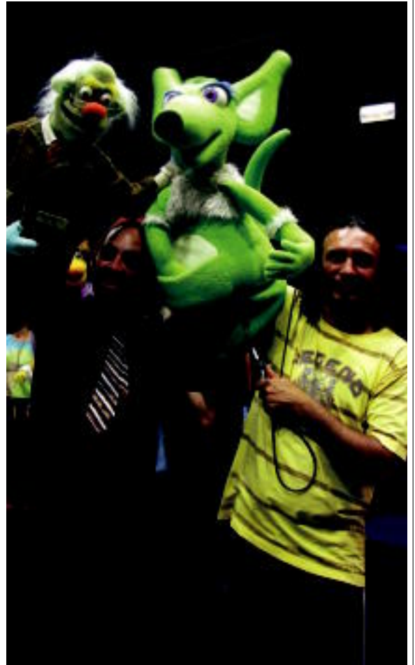
Parte-hartzaileak oso gustura aritu dira diziplina hau ikasten. I.T.