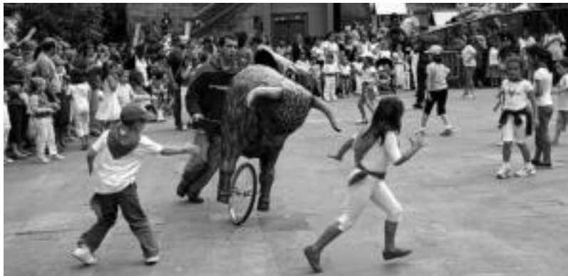
Plaza Berria bera ere, zezen-plaza bihurturik. I.T.

Uztailaren 7an, San Fermin egunean bertan izango da festa hau, eta 12:00etako txupinazoak emango dio hasiera. Ondoren buruhandiek emango diote jarraipena jaia-