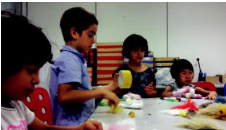
Atzo goizean gaztetzontzat txotxongilo tailerra ere eman zuten. I.T.