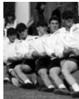
Aresoko taldea. HITZA