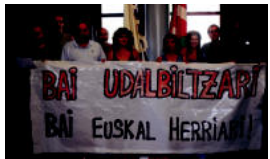
Anoetako hautetsiak eta hautetsi ohiak agerraldian.

Aurrerago jakinaraziko dute bigarren zatian noiz egingo den. Konpontketa lanak hastean, zati honetan ere ezingo da aparatu, era berean ezingo da zama lanekin egin, eta trafikoa Izkina bidegurutzetik Elizako bidegurutzeraino, Tolosalderako norabidean bakarrik erabili ahaliko da.