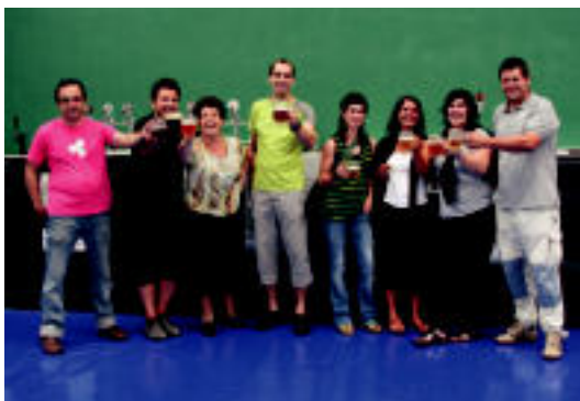
Jende ugari bildu zen atzo frontoira.