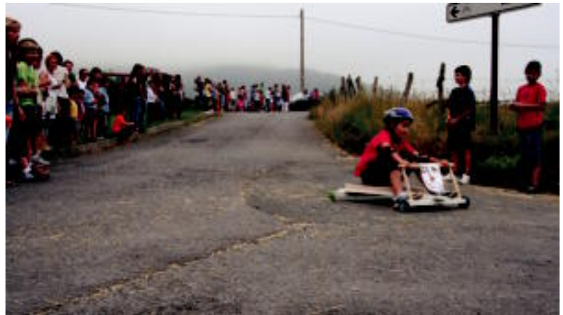
Gaztetxoek goitiberetan ibili ziren Elizmendin. Hilerriko bidetik behera jaisten ziren. E. MAIZ

Hala ere, festa giro izango da gaur eta bihar ere. Adin guztiak izango dute aukera: pilota, futbola, kontzertuak, zezen eta pony-ak, sagardoa eta pintxoak, herri kirolak... norberaren esku dago gustuko duena aukeratzeko.