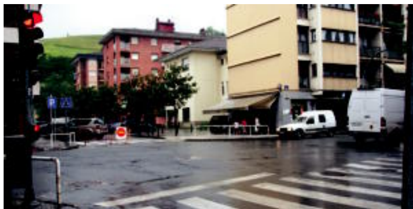
Hasiera batean Izkina bidegurutzetik hasi behar zuten. Azken orduko aldatuketatik 2. fasean egingo dute lehenik. HITZA

Beraz, herritarrei deia luzatzen diete, «osoko bilkuran eta ondorengo kontzentrazioan, eta Bilboko manifestazioan eta aurrerantzean antolatuta daitezkeen mobilizazioetan parte hartu dezaten».