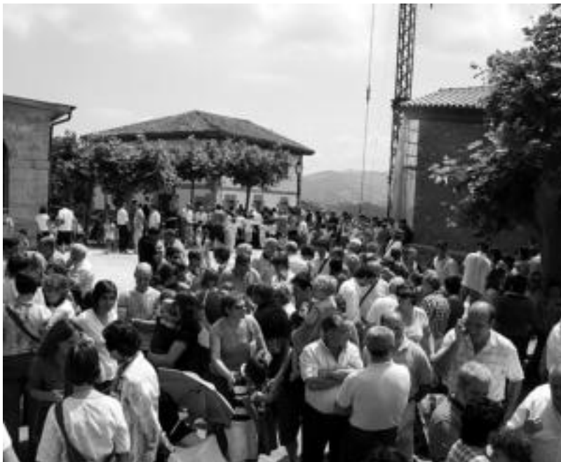
Ohi bezela jendetza bildu zen atzo Asteasuko Elizmendi auzoan. I. TERRADILLOS