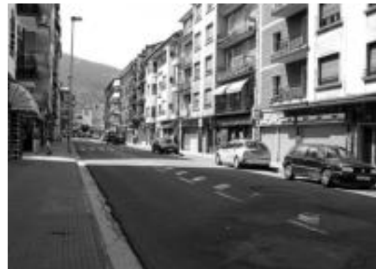
Komertzioak ixtearekin batera, kaleak ere hutsik ikusi zitezkeen. E. EZEIZA