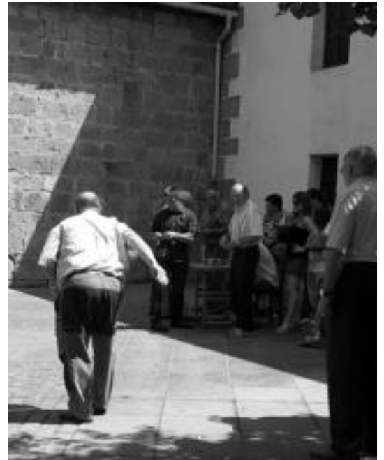
Leaburun tokan aritu ziren hamaiketakoaren ondoren. E. EZEIZA