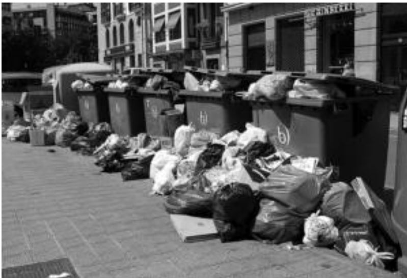
Zabor biltzaileek ere bat egin zuten greba deialdiarekin, eta zabor ugari pilatu zen kalean. E. EZEIZA