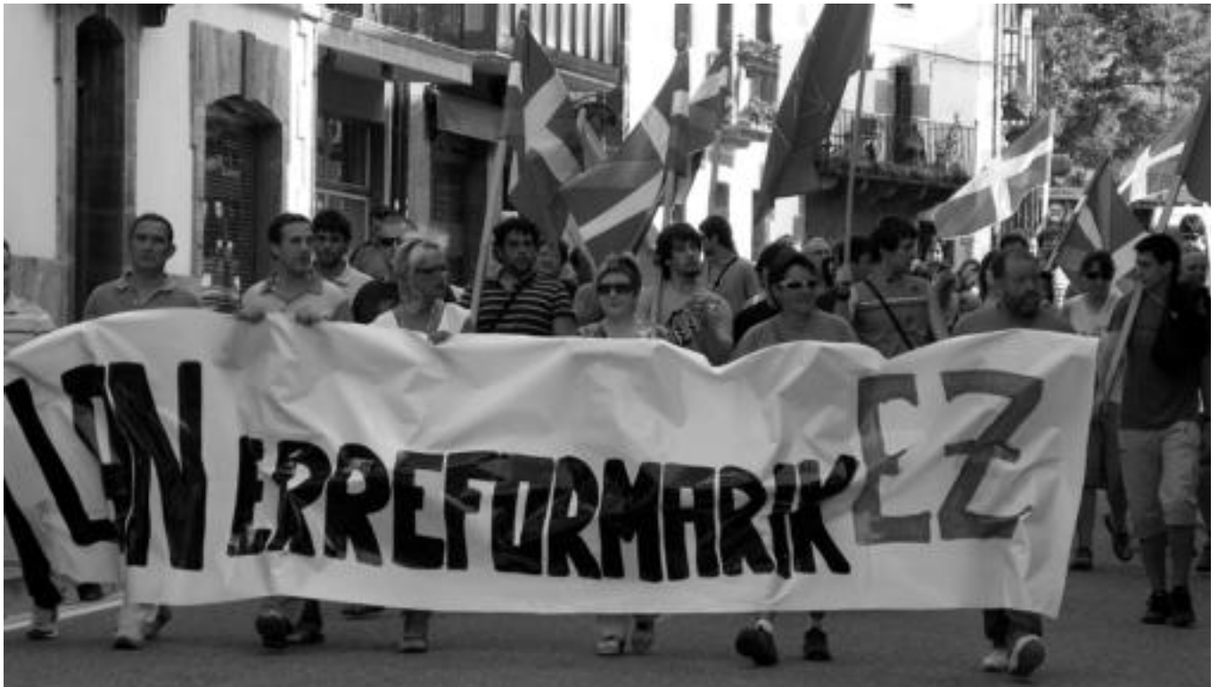
Goizean hiriburuetan izan ziren protestak, arratsaldean berriz, eskualdeetan. Gurean Leitza eta Tolosan egin zituzten manifestazioak; lehendabizikoan ehunka lagun bildu ziren. ESTI EZEIZA