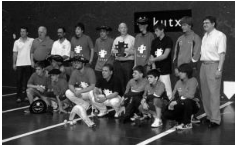
Tolosako pilotariek irabazi dute Gipuzkoako Herriarteko Txapelketa. HITZA