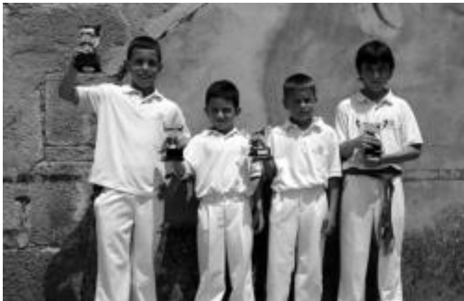
Asteasuko gaztetxoek pilota partidak jokatu zituzten, irudian irabazleak. I.T.