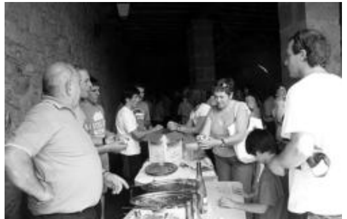
Jatekoa eta edatekoa ere izan zuten asteasuarek. I. TERRADILLOS