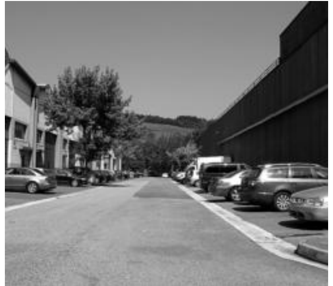
Zenbait enpresetan, hala ere, atek irekitzea erabaki zuten eta normaltasunez lan egin. E. EZEIZA