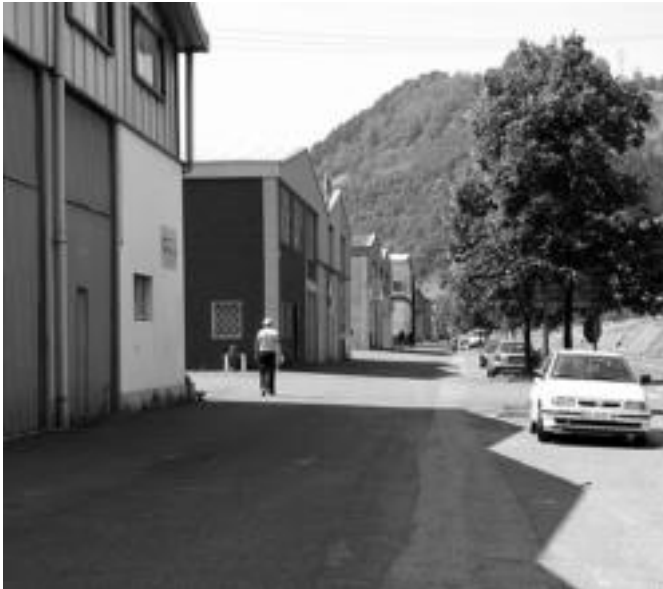
Eskualdeko industrigune gehienak itxita mantendu ziren egun guztian zehar. E. EZEIZA