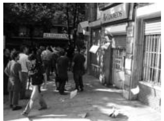
Goizean goiz elkartu ziren pikete informatzaileak, kaleak zeharkatzeko. A. IMAZ