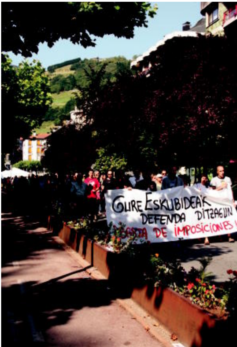
Tolosan manifestazioa egin zuten 18:00etan Triangelua plazatik abiatuta. E. EZEIZA