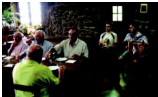
Asteasun gaztetxoaren pilota partidak izan ziren eta Urkizun hamaiketakoa egin zuten trikitilarien laguntzarekin. I. TERRADILLOS