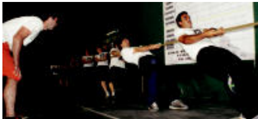
Zizurkilgo taldeak irabazi du Xiba txapelketa. HITZA