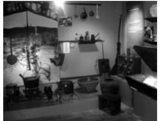
Museo etnografikoko sukaldea. o.i.

Badirudi, garai hartan erretaula eraikitzeke adina diru bildu bitartean, horman marraztu ohi zirela erretaula antzekoak, gero gurutze eta gainarrekoekin apaintzen zirenak. Honela, eliza gehienetan, gerora eraikitako erretaulak estalirik egongo dira grisalla asko, baina Larraulgo elizan ikusgai dago XVI. mendeko altxor hau.