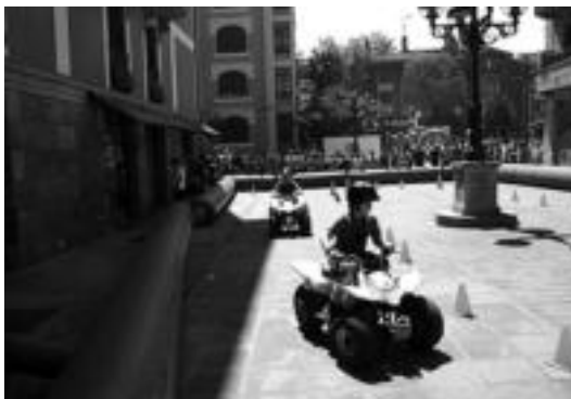
Sortzez Garbia plazan haurrentzako jokoak daude egun osoan. I.T.

Gaurkoan, berriz, festa giroa ziurtaturik dago egun osoan zehar, ekitaldiz beteriko egitaraua izango baita. Norberari dagokio gustukoena aukeratzera.