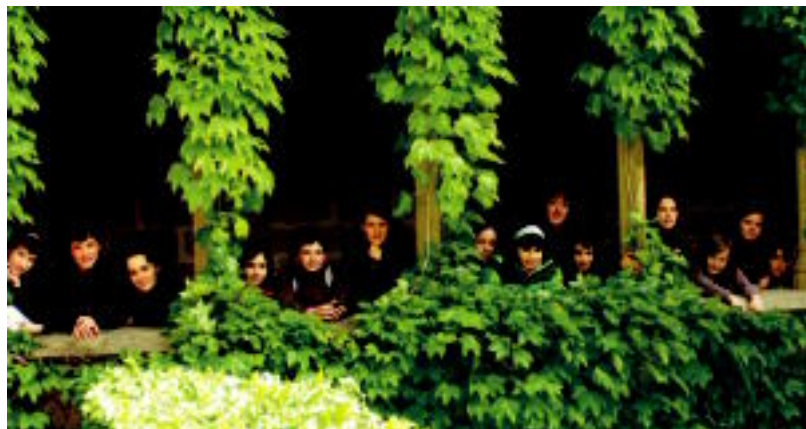
Txintxarri Txiki Abesbatza 15 gaztek osatzen dute. Aurten, Nafarroara joan ziren egun pasa.