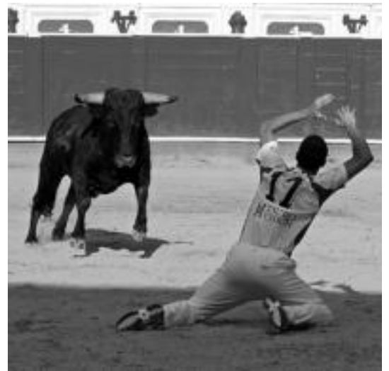
Pasa den urteko ikuskizuneko une bat, Tolosako zezen-plazan. HITZA

■ 19:00. Plaza Berrian Xanpetiki-dantza eta Larrain-dantza. ■ 19:00. Berdura plazan, Sagardo Eguna. ■ 19:00. Iraunkorrek txaranga eta Mulambo kalez kale ibiliko dira. ■ 19:30. Mariachi Garibaldi taldea. ■ 23:00. Su festak, 2. bilduma: As-tondoa Piroteknia. ■ 23:30. Plaza Berrian Inde Kitzen eta Devon. Ondoren, DJ Black. ■ 23:30. Trianguloan kontzertua: Mariachi Garibaldi.