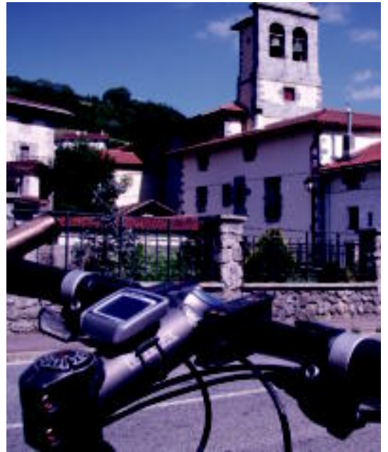
Betelu herria. JOXEMI SAIZAR