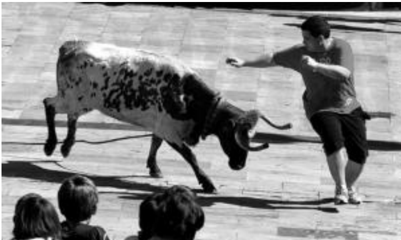
Plaza Berrian izan zen atzo goizean sokamuturra. KUSK