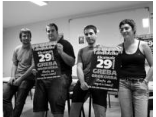
Atzo goizean egin zuten agerraldia, sindikatuetakordezkariek.

Sindikatuetakordezkarien hitzetan, «industriaren sektorean enpresen %100ean grebari babesa eman diola esan dezakegu». Hala, Tolosaldean asko dira jada asanblada egin duten eta grebari baiezkua eman dioten enpresak. Enpresa ertainetan edo txikietan bozketak ere «bide onetik» doazela azaldu zuten sindikatuetakordezkariek. Merkataritzari dagokionez ere sindikatuak «lanketa egiten» ari direla azaldu zuten, eta orain artean jaso duten erantzuna «oso ona» izaten ari da.