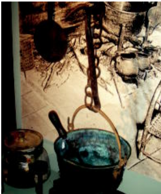
Museo etnografikoko sukaldeko irudia. o.i.

GRISALLA XVI. mendeko grisalla ere ikusi daiteke herriko elizan; erretaularen atzean egon da urte askotan 7