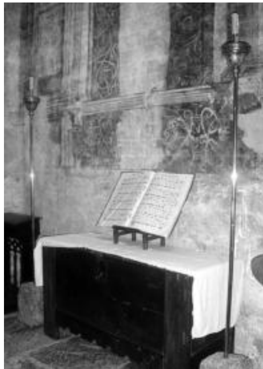
Elizako grisalla. o.i.