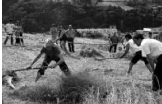
Zizurkilgo eskolaren atzeko zelaian izango da txapelketa. E. EZEIZA

Zizurkil » 18:00etatik aurrera, hiru emakumezko eta sei gizezkoen artean jokatu da txapelketa.