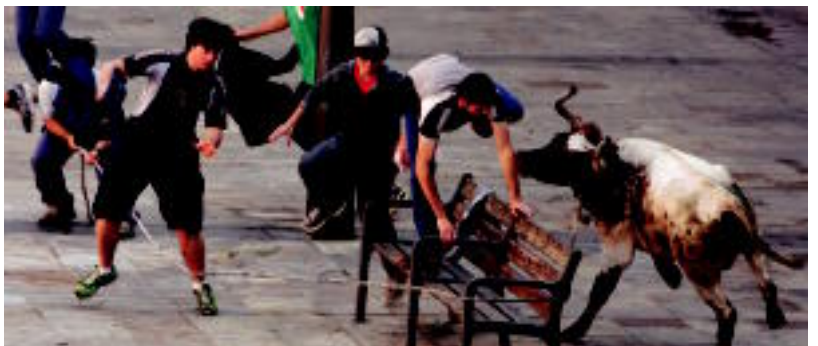
Sokamuturra izan zen atzo goizean Plaza Berrian. KUSK