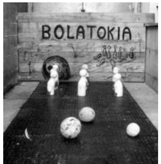
Bolatoki berria. o.i.