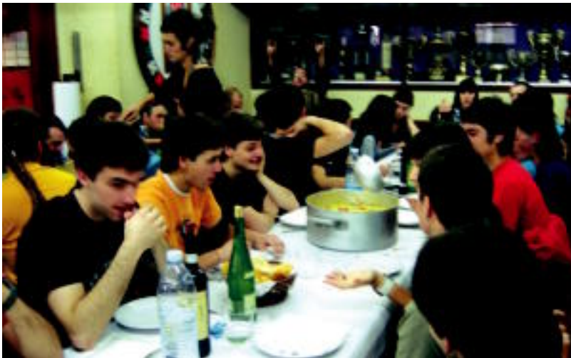
Jende ugari bildu zen herenegun Xepla elkartearen egindako gazte bazkarian; ondoren Xiba jokoak izan zituzten. HITZA