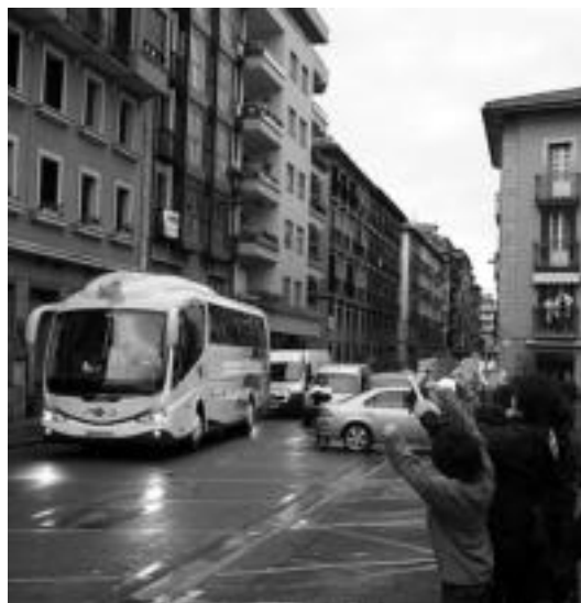
Realeko jokariak Tolosatik pasatzerakoan hartutako irudia. J. MUJICA

Berri onarekin hasi genuen astea: Erreala lehen mailara! Lehen eguneko ospakizunetara joateko aukerarik ez nuen izan, gurasoa bainaz, baina jokalarien autobusa herrietatik pasako zela jakitean sekulako poza hartu nuen, ni eta semea Errealeko jokariak ikusteko aukera izango genuen, bertatik bertara! Hantxe ginen ostegun goizean, Triangulo plazan, zain. Baina gure harridurarako pasa eta gelditu ere ez ziren egin! ez gelditu ez, eta kaso egiteko aukerarik ere ez, kristal beltzen atzean ez baitzen ezer ikusten! Penatuta itzuli ginen etxera semea eta ni. Pena izan zen agurtzeko aukerarik ez izatea. Nere ingurukoek ere sentsazio bera izan zutela uste dut gainera. Gurasoa.