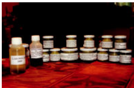
Olioak eta ukenduak erabiltzeko prest o. p.

ditu belar hauek. Egunduen hamar mila ukendu desberdin egiten ditu: aloeveraren, intsusaren, berbeneren, berbena eta pasmobelarraren,