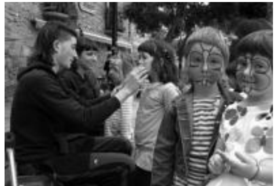
Umeek aurpegiak margotu ondoren jolasak egin zituzten. A. BELAUNZARAN