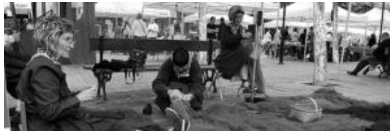
Urola Kostako produktuek hartu zuten Trianguloa plaza atzo goiz osoan zehar. M. SAN SEBASTIAN