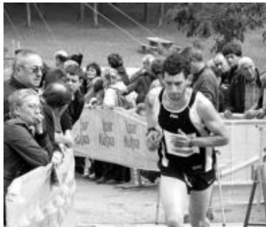
931 metroko desnibelari aurre egin zioten korrikalariek. ESTI EZEIZA