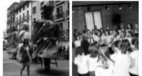
Erraldoiek eta Laskorain ikastolako abesbatzakoek ere hartu zuten parte. E. E.