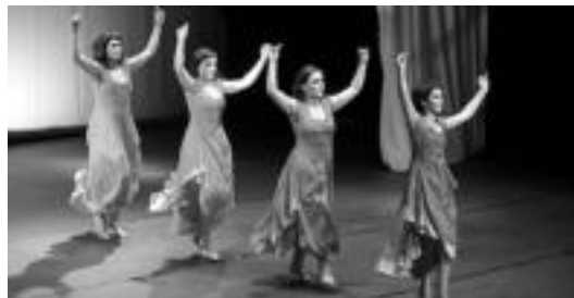
Alurr dantza taldeak ere hartuko du parte gaurko jaialdian. HITZA

Jaialdi berezia izango da gaur ikusgai Leidor aretoan, 20:00etatik aurrera. Berezia, dantza, musika, bertsoak edota poesia errezitaldiak bezalako hainbat osagai izango dituelako eta elkartasunezko helburua duelako. Izan ere, Karai-Mi jaialdirako sarrera 5 euro or-