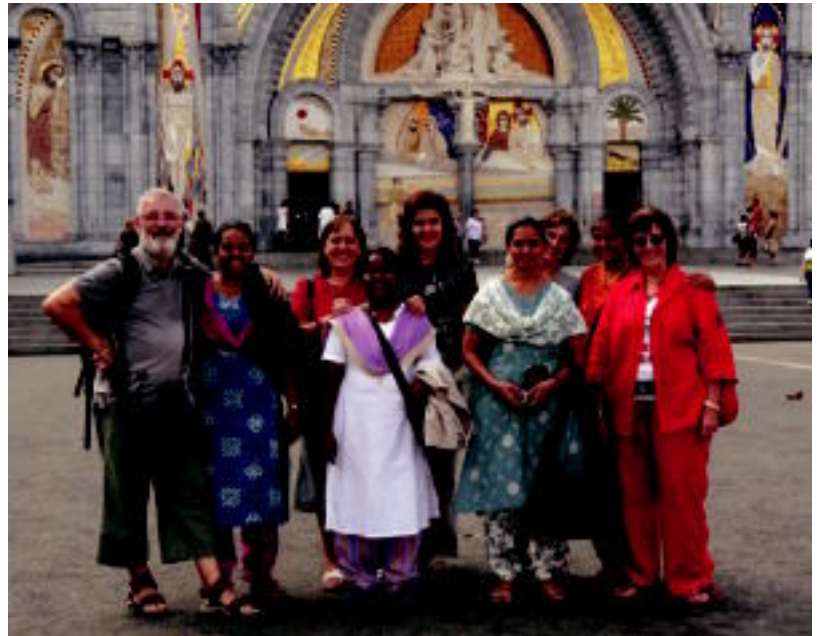
Iaz, Ibarratik Misio Taldearekin duten elkarlanerari adierazgarri, beste hainbat moja etorri ziren Euskal Herrira. HITZA

HITZAK ez du bere gain hartzen egunkarian adierazitako esanen eta iritzien erantzukizunik.