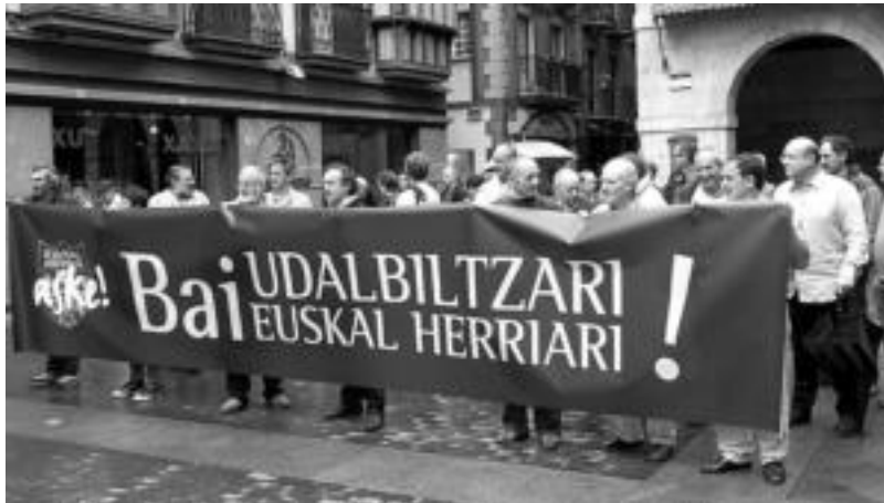
Tolosan burutu zuten elkarretaratzea. I. TERRADILLOS

Gure eskualdean Tolosa eta Leitzan izan ziren ekimenak aurrera atera zituzten herriak. Anoetan