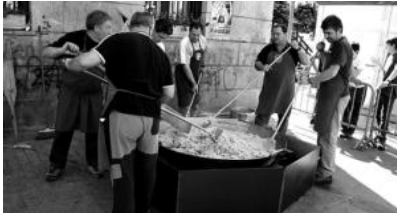
Sendi Ekintzaren eskutik, larunbat arratsaldean egingo dute tortillada, txokolatadarekin batera. A. IMAZ

Pilotalakuko amaiteu ostean, hurrengo hitzordua Gaztetxean izango da. Hala, egunari amaiera emateko eta gauari hasiera, barrikote berezi bat egingo dute. Izan ere, herriko hainbat gaztek ehun laguntzako paella prestatuko dute. Sagardoa ere ez da faltako. Jaietako lehen egunari amaiera emateko, musika. Alde batetik, rock doinuak ekarriko ditu Villa-