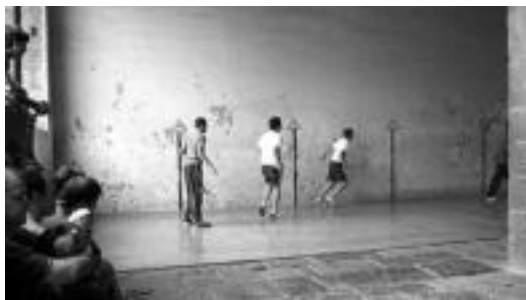
Zimiterioko Eskuz Binakako Txapelketako partida bat jokatzeko. G. AZKUE

Zizurkilgo frontoi berezi horretan jokatzeko den VIII. edizioa da aurtengoa. Zimiterioko binakako esku pilota txapelketa da, eta edo-