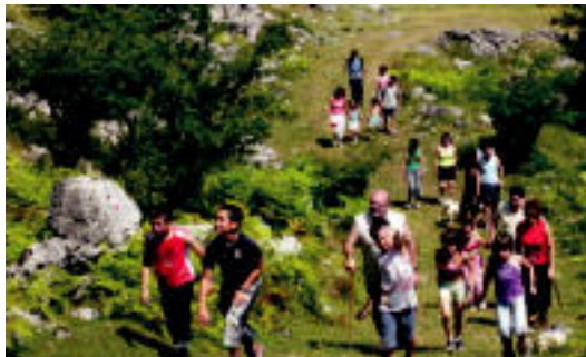
Bizikleta eta oinezkoen martxa eta I.Mendi Duatloia egingo dira aurten. HITZA

Zatirik gogorra egin ondoren, bideak beharrezko martxa hartuko du. Urdilleko lepoan, Nafarroa eta Gipuzkoako mugan, beharrez jaitsi eta Azkaratetik pasako da ibilbidea. Ibilaldiaren azken txanpan, pagadietan sartuko dira. Bedaioraino eramango dituen bideak, Artubiren ikuspegi ezberdinak eskainiko dizkie parte hartzaileei. 6-7 orduko ibilbidea izango da oinezkoena eta 3 kontrolgune egongo dira.