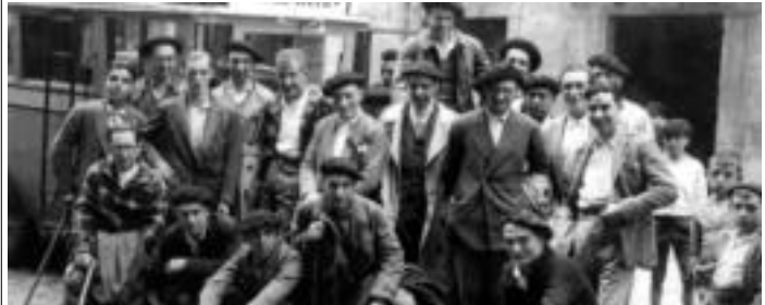
'Uxola' (atxi) hirugarren ezkerretik hasita) Pirinioetara joan ohi zen sari Mendirik Menditakoak... Uxola (atxi) hirugarren ezkerretik hasita) Pirinioetara joan ohi zen sari Mendirik Menditakoak...