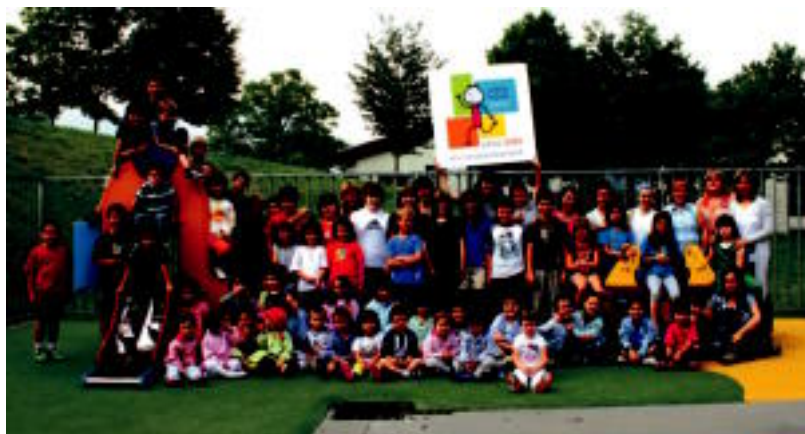
Gaur egun 59 ikasle eta 10 irakasle daude Imaz Bertsolaria eskolan. AGURTZANE BELAUNZARAN

FORU ALDUNDIA Zerbitzu juridikoek azaldu dutenez, epaitegiaren sententzia Tolosako Udalak bete behar du s