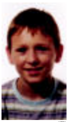
Handik aurrera garagardogilea zoriontsu bizi izan zen bere familiarekin eta lagunekin.

Ondoren gure garagardogilea ezkondu eta seme bat izan zuen. Hori bere istorioa kontatu eta garagardoaen sekretuak azaldu zizkion, hau ere garagardogile izan zedin.