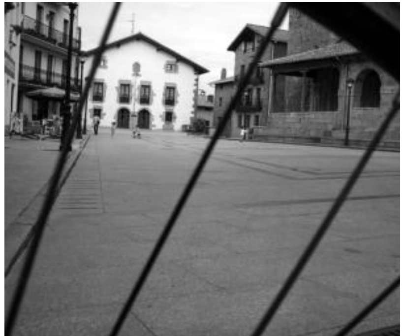
Aiako plaza, udaletxea eta San Esteban elizarekin. JOXEMI SAIZAR

eta Urola, Nafarroako Araritz eta Larraun... Astero astero proposamen bat argitaratuko du HITZak. Hori bai, ia zoko prestakuntzaren ondoren, aurtengoak bidai luzexekoak izango dira, 40-60 km ingurukoak. Eta gure eskualdea mendiz inguratuta dagoenez, mendeak igotzea ezinbestekoa izango da Tolosaldeko atera eta inguruko eskualdeak ezagutu ahal izateko.