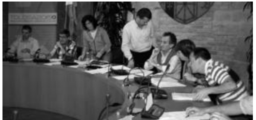
Ezker Abertzaleko eta Aralarreko kideak goian. Behean, EAJren zinegotziak bilkura aretoa uzten.