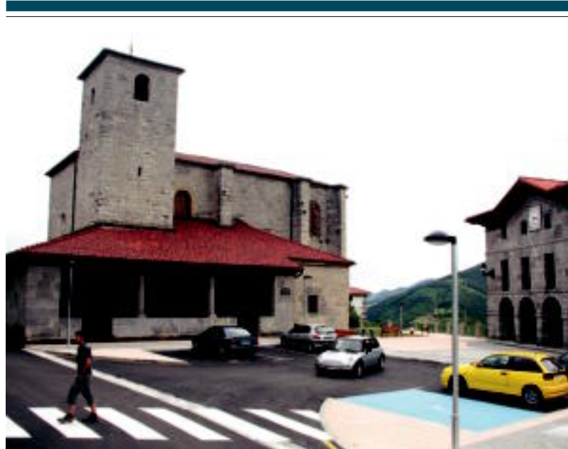
Santa Kruz Apaiza plazak obrak amaituta duen itxura berria.

HITZAK ez du bere gain hartzen egunkarian adierazitako esaneri eta iritzien erantzukizunik.