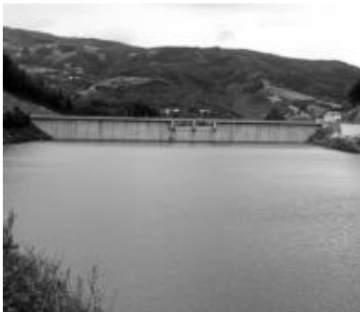
Urtebetean %60 bete da Baliarraingo Ibiur Urtegia. ENERITZ MAIZ

Azken fasean, uztailea erdialdean, Alegia, Irura, Amezketa, Aduana eta Andoainera iritsiko da Baliarraingo urtegiko ura.