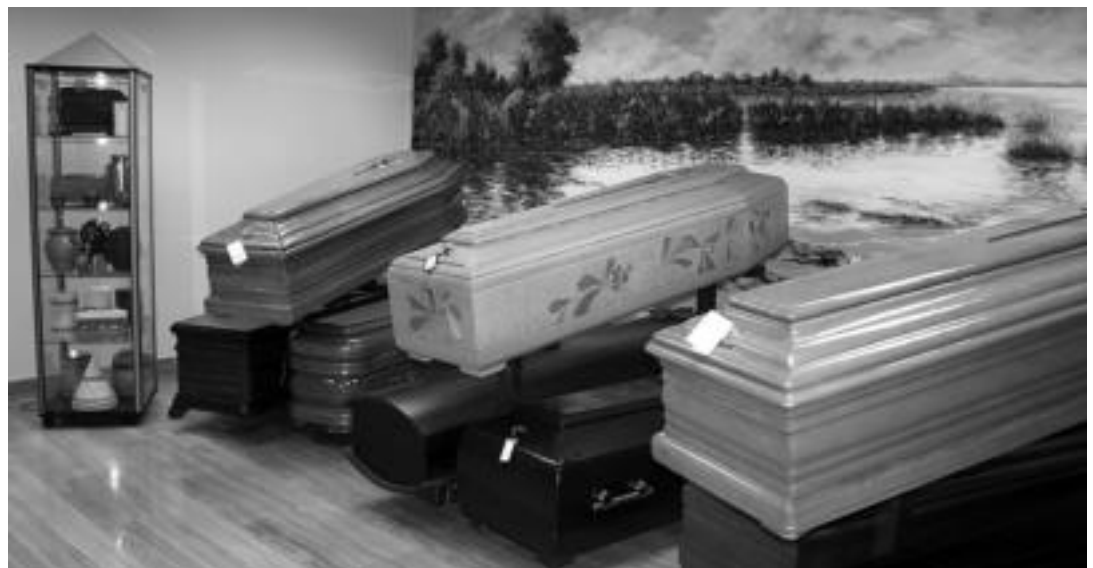
Zerbitzu anitz eskaintzen ditu egoitzan bertan Vascongada Ehorztetxeak.

Funeraria Vascongada Ehorzketak-en bezeroentzako zuzeneko telefono zenbakia ondorengoa da: 943 67 00 40. Fax zenbakia berriz, ondorengo: 943 67 07 19.