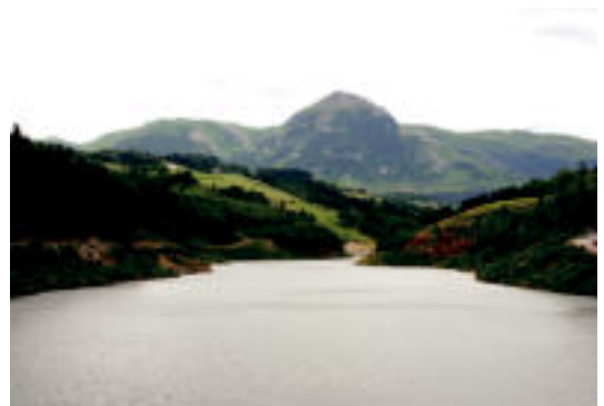
Urtegiko azaleraren %60a dago beteta une honetan. E. MAIZ

BALIARRAIN Abuzturako Tolosaldeko herri guztiak izango dute ur hau; kalitate «askoz hobea» duela dio Ur Zerbitzuetako arduradunak 5