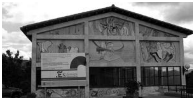
Berastegin, errepidean egin dituzte berrikuntzak, eta Leaburun, pilotalekuan. E. EZEIZA

Tolosaldeko eta Leitzaldeko HITZAn jarri eta Gipuzkoako beste 4 Hitzetan DOAN agertuko da