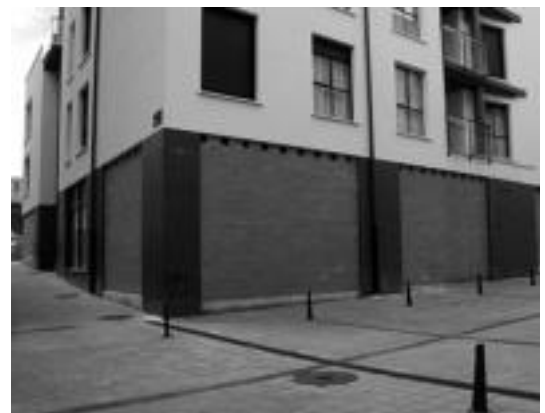
Aldude kaleko etxebizitza baten baxuan kokatuko da. E. MAIZ

Aurreko legealdiko Udal ordezkariak, Jubilatuen Elkarte berriko kideei, lokal berria izango zutela hitz eman zieten. Ondorioz, oraingo Udalak,