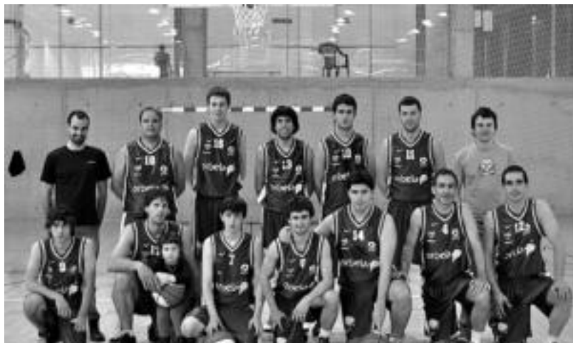
TAKE Orbela saskibaloit taldeko kideak. HITZA