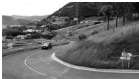
Pasa den hilabetetik dago erabilgarri errepide berria. IT.

Diputatuen Kontseiluaren onarpenarekin Errepideen Katalogoan sartu berri duten errepidea maiatzean zabaldu zuten. 0,8 kilometroko luzera du, Tolosa iparraldeko N-1en loturatik hasi eta Asuncion klinikatik gertu GI-3421 Izaskungo errepidearekin batzen da. Beraz, N-1etik Asuncion klinikara zuzenean joateko aukera ematen du, Tolosako hirigunetik pasatu gabe. Proiektuak 2,5 milioi euroko aurrekontua izan du.