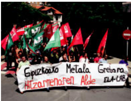
1.500 bat pertsona bildu ziren atzoko manifestazioan. A. IMAZ

TEILATUA Leaburun pilotalekuko teilatua konpondu dute eta ekialdeko zein ipar-ekialdeko paretak berritu 6