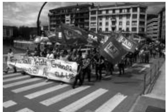
Metal arloko langileek lau egunetako greba egin dute. ASIER IMAZ

Duela urtebete hasi ziren betetzen Ibiurko urtegia eta azaleraren %60 beteta dago dagoeneko.