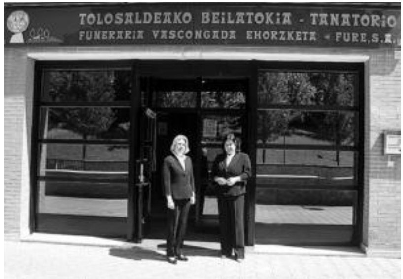
Funeraria Vascongada Ehorzketak-en egoitza Tolosako Kondeko Aldapa 5. ean aurkitzen da. HITZA

09:00etatik 21:00etara zabalik dago Vascongada Ehorztetxe be-