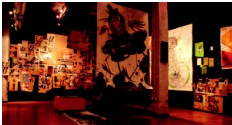
Artista frantziarren eta euskaldunen lanak bildu dituzte Kale Nagusian dagoen galerian. I. TERRADILLOS

BOSGARREN EDUKIONTZIA Udal ordezkariak ez dute ulertzen Tolosaldeko Mankomunitatearen proposamena 2