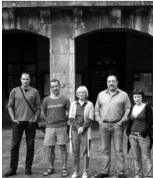
Ekzerretik eskubira: Alegiako alkatea, Adunako zinegotzia, eta Villabona, Anoeta eta Ikaztegieta alkateak.

Tolosaldeko bost Udalek atez ateko zabor bilketaren alde egiteko dituzten arrazoiak berri ematera-