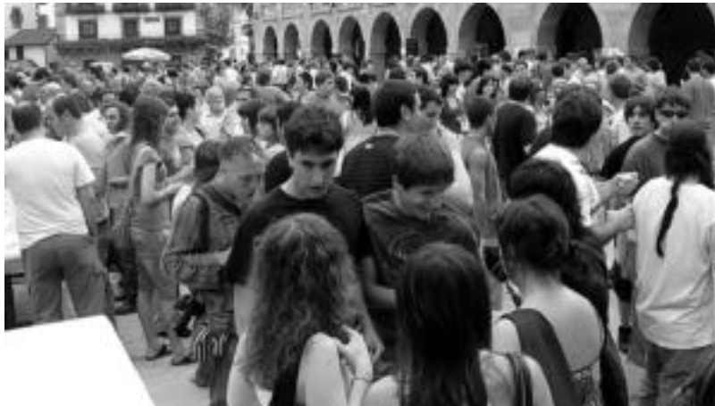
Jende ugari bildu zen iaz Lehen Sagardo Egunean, eta aurten errepikatzea espero dute. HITZA

sagastien inguruko sekretuak azalduko ditu Errekondok. Hurrengo egunean berriz, gurean horren ezaguna eta ugaria den fruitutik datorren sagardoa dastatzeko aukera izango da udaletxeko karrapean