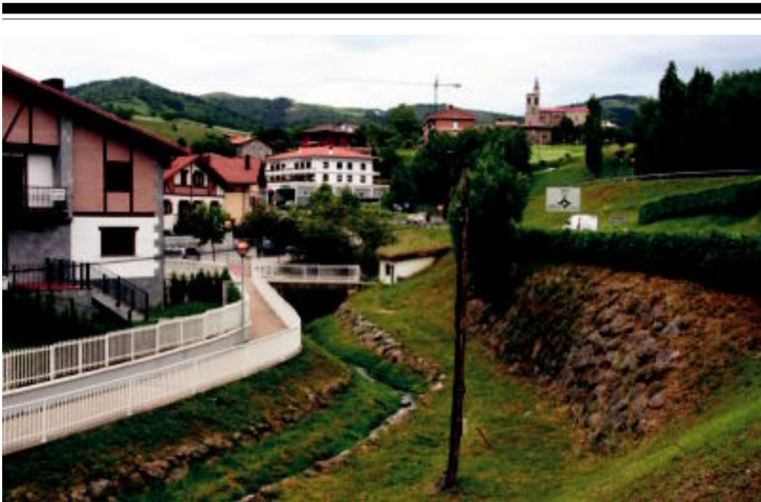
Iazko urtera arte, Asteasuko herri sarreran ohiko zen Panpa Belarrak (Cortaderia Selloana) ikustea. E. MAIZ