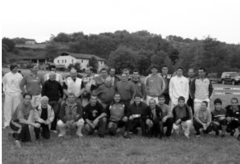
Kirolari guztiek 'Paskualtxo' rekin atera zuten argazkia amaieran. IBON ERRAZU