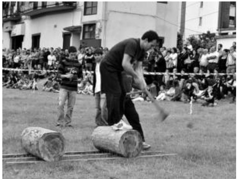
Arozetxe ondoko zelaian izan zen Anoeta eta Alkiza taldeen arteko herri kirol saioa. SARA GOMEZ

San Joan egunean, 12:00etan, jubilatuak eskainitako meza izango da. Aurretik, herriko dantzariak, agurra dantzatuko dute jubilatu