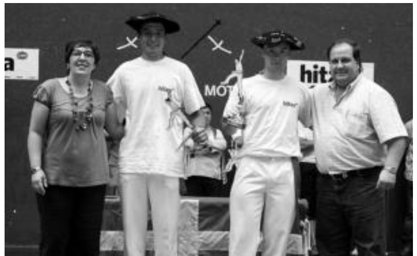
Nagusien mailan, iaz, Azpiri-Madariaga nagusitu ziren. Finalak ikustera jende ugari joan zen Beotibarrera. A. IMAZ

Nagusietan azkenik, Zubillaga-Iriartek 6-22ko emaitza lortu zuten. Mikel Iriarte sasoi betearen aurkitzen da eta atzelari leitzarrek erakustaldia eskaini zuen. Zubillaga ere gero eta hobeto jokatzen ari da.