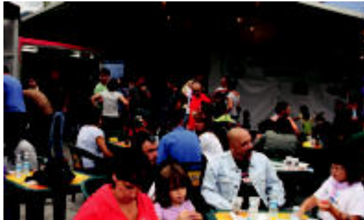
Jaiak ospatuko direla bermatu du Ibarrako Udalak. HITZA

Ibarrako Udalak udalerriko bizilagunek San Bartolome jaiak ospatzeko aukera izango dutela bermatzen duela argitu nahi izan du, izan ere «zenbait elkarteek Jai Batzordean parte hartzeari ezezkioa eman diote», argitu dute udal ordezkariak. «Udala jaietako programa definitzeko lana egiten ari da eta edizio honetan, 70.000 euroko aurrekontua izango dute jaiak», zehaztu du. «Orain arte festetako antolakuntzan parte hartu izan