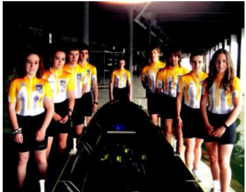
Laskoraingo Batxilergoek eman zuten aurtengo bandera. HITZA

HITZAK ez du bere gain hartzen egunkarian adierazitako esanen eta iritzien erantzukizunik.