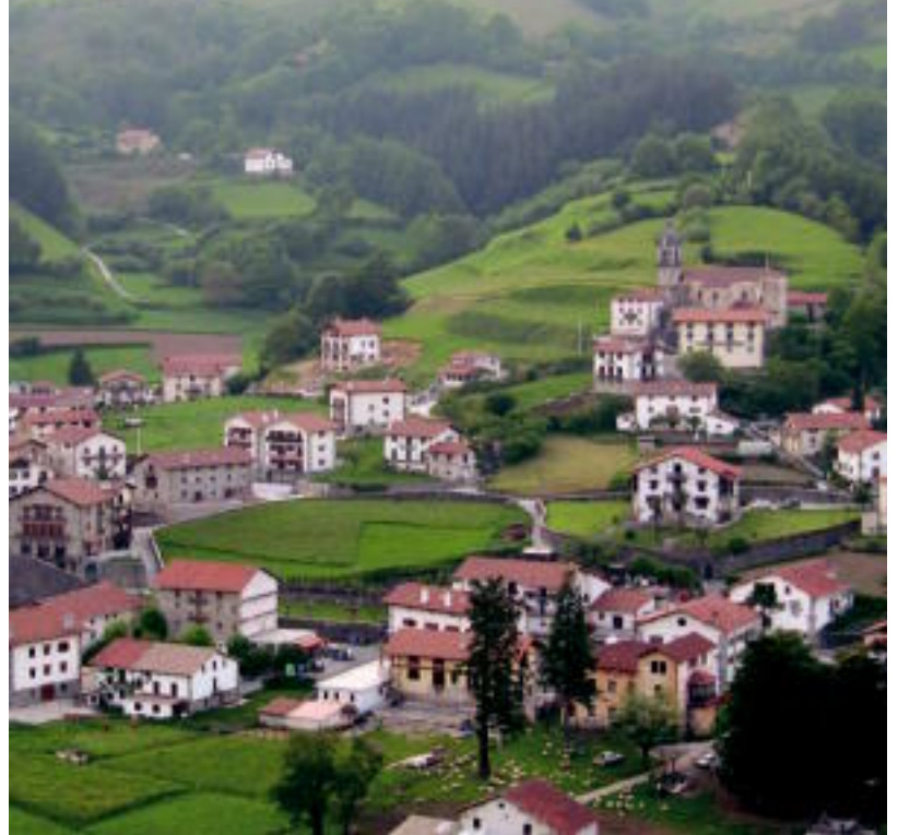
Aresoko informazioa biltzen duen webguneak, inguruan egiteko txango ugari gomendatzen ditu. JAIONE ASTIBIA