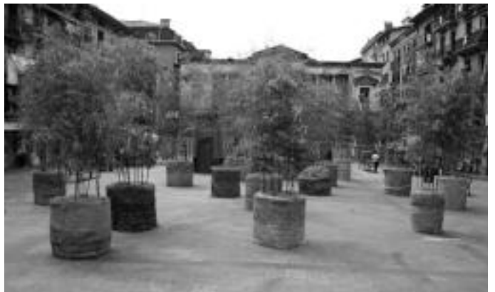
Berdura plazan uharte moduko bat aurkitzen da; Triangulo plazan «lore eta berdetasunez beteriko lorategia» eta plaza Berrian banuzko basotxoak. A. IMAZ