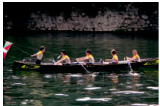
Oria ibaian, Zerkau-siaren parean festa polita izan zen.

DBH3 eta DBH4. mailakoen arteko era jokatu zuten, eta horretan ere Laskorain nagusitu zen. Bigarren Orixe geratu zen, eta hirugarren postuan Hirukide ikastetxe-koak sailkatu ziren.