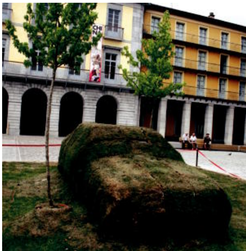
Euskal Herria plazan belardi batek autoa irentsi du Tolosa Berdez ekimenaren baitan. A. IMAZ

HERRITARRAK Webgune berriak Udalarekin zuzenean harremanetan jartzeko aukera eskaintzen du 4