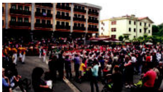
Kukuaren jaitsiera ospatzeko haurrek danborra jo zuten. ENERITZ MAIZ

TOLOSA Artisauek bihar jarriko dituzte euren postuak Triangulo plazan; hilaren 6an amaituko dira bi ekimenak 3