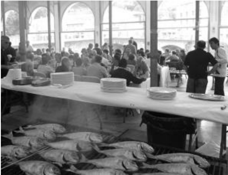
600 lagun baino gehiagok dastatu dute bisigua Zerkausion asteburuan egin duten Bisiguaren Festan. HITZA