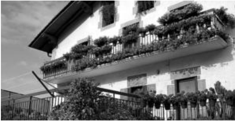
Iaz Arantxa Egimendia Martintxone etxekoa izan zen garaile, bere balkoiko lore ederrenatik. HITZA