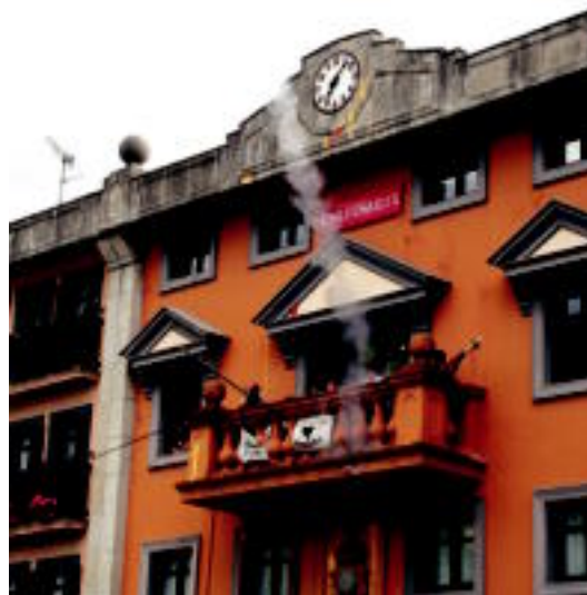
Xake taldeko kideek pregoia irakurtzeaz gain txupinazoa ere bota zuten.