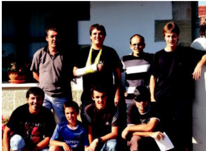
'Hustukoixkiu!' diskoan parte hartu duten Alegiako Bertso Eskolako kideak.