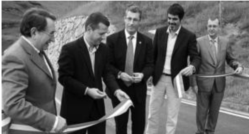
Erakundeetako ordezkariak zinta moztearekin batera zabaldu zuten atzo errepide berria ofizialki. I.T.

Oraingo arte eskualdeko klinikara Santa Klara komentuan hasten den bidetik joan zitekeen soilik. Hemendik aurrera, bigarren aukera bat ere izango da. Bide berria bereziki garrantzitsua izango da Tolosan bizi ez diren eskualdeko herritarrentzat, herrigunea zeharkatu gabe igo ahalko baitute osa-