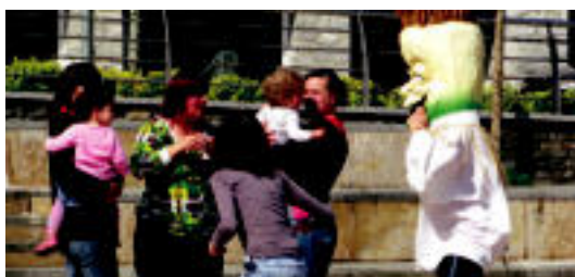
Berrobiko Kultur Astea buruhandiekini hasi dute. E. EZEIZA

KULTURA Lizartzan gaur, Errealeko jokalarien bisita izango dute 3