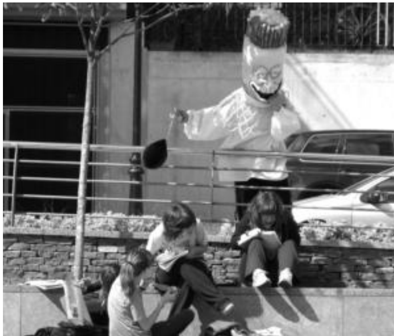
Berrobin, suziriak jaurti ostean, haur guztiak korrika aritu ziren, buruhandiek ez harrapatzeko. E. EZEIZA

Kultur Asteen hilabetea da oraingoa. Eskualdean, zenbait herritan joan den astean ekin zieten ekitaldiei, eta beste batzuetan berriz, atzo. Iruran hilaren 14an hasi ziren, eta igande honetan amaituko dute. Ekitaldien artean, atzo Memoria Tailerra izan zuten, eta baita risoterapia saioa ere. Gaur berriz, 12:00etatik aurrera izango da zer eginik. Besteak beste, jubilatuen jokoak, ipuin kontaketa eta hezkuntzaren inguruko hitzaldia izango dira. Berrobi eta Lizartzan ere kultur ekitaldiak nagusi dira atzotik. Berrobin, suziri jaurtiz eta buruhandekin hasi zuten eguna, Lizartzan berriz, Floren Aiozen hitzaldiarekin. Bigarren honekin, gaur Errealeko jokalariek izango dira bisitan. 20:00etan hasiko da kirolarien hizketaldia.