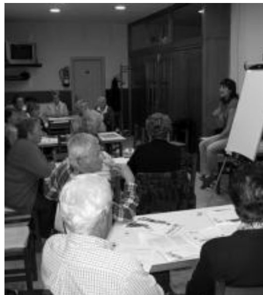
Zaharren biltokian memoria lantzeko saioa egin zuten atzo, Iruran. E. EZEIZA