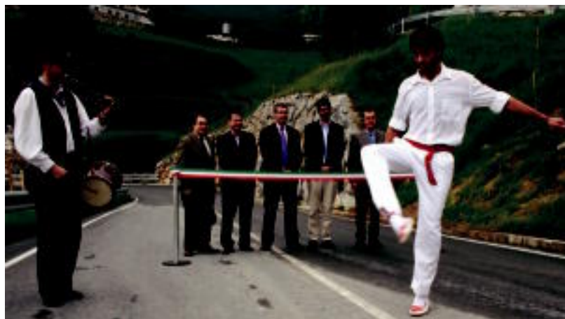
Aureskua dantzatu zuten bidea inauguratzeko. I. TERRADILLOS

ERRONKA Munduko hamalau mendirik garaienak zapalduta Everest oxigenorik gabe igotzen saiatuko da 7