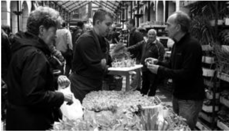
Txmari Estebanen entsaladak arrakasta izan zuen atzokoan. A. IMAZ