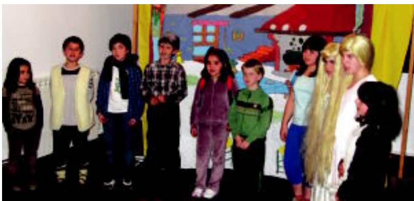
Albizturren Herri eskolako haurrek antzerkia eskaini zuten Kultur Astearen baitan.

TOLOSA Baltsa Jaitsiera ikusteko jende ugari gelditu zen Oria ibaiaren bi aldeetan 7