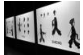
Museoren irudi bat. l.T.

Kultura » Museoren Nazioarteko Egunaren harira egingo dute; zentroarekin batera museoa bisitatu ahalko da.