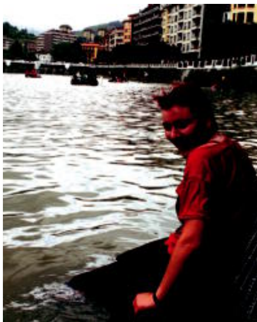
Baltsa Jaitsieran Oria ibaia gertutik ezagutu zuenik ere izan zen.

SAN ISIDRO EGUNA Amasan eta Asteasun desafioko ikusteko aukera egon zen atzokoan; Alkizan gaur ospakizunekin jarraituko dute 5