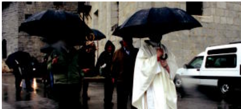
Amasan, giza proba. Asteasun erakustaldia, zaldia eta idi parearekin eta Berastegin prozesioa.