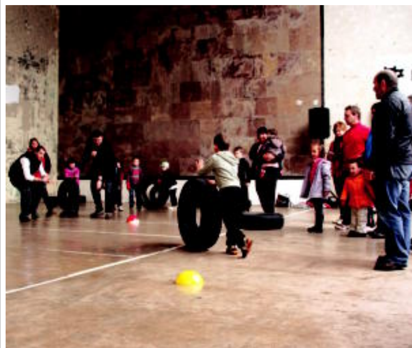
Alkizan, frontoi barrura sartu eta 12 urtetik beherako hurrek gurpil lasterketa egin zuten. E. MAIZ