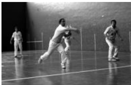
Leitzak atzo jokatu zuen etxean Herri Artekoaren lehen partida. I. TERRADILLOS

Nafarroako Herri Arteko Txapelketan, ligaxkako lehen partida jokatu zuen atzo Leitzak Lizarraren aurka. Aurrera Pilota Eskolakoak larri ibili baldin baziren ere, azkenean zortzi tantoko errentarekin irabazi zuten lehia. Ligaxkan sei talde edo herri daude eta aurrerabi onenek egingo dute.