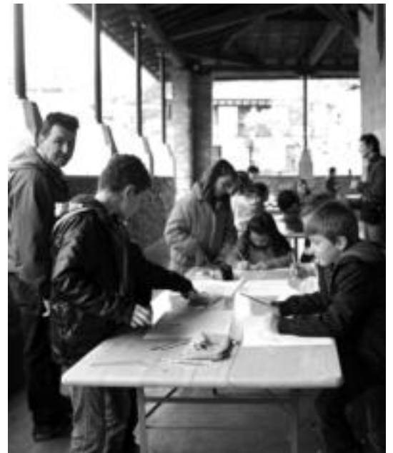
Atzo goizean marrazten aritu ziren Irurako gazteak. E. MAIZ

Albizturren eta Amezketan Kultur Astea bukatu dute, eta bihurtik aurrera, Lizartzak hartuko du kulturaren lekukoa, ekitaldi ugariarekin. Iruran, berriz, hasi besterik ez direla egin esan daiteke, datorren igandera arte luzatuko baitira kultur jarduerak.