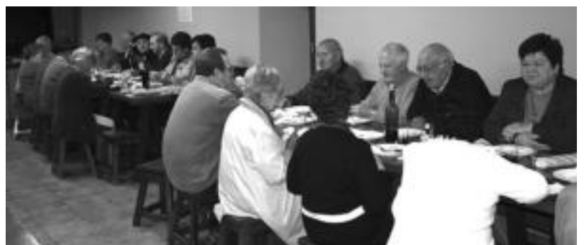
Jubilatuek hamaitetako ederra egin zuten atzo goizean Amezketan.

KULTURA SAILAK DIRUZ LAGUNDUTAKO HEDABIDEA