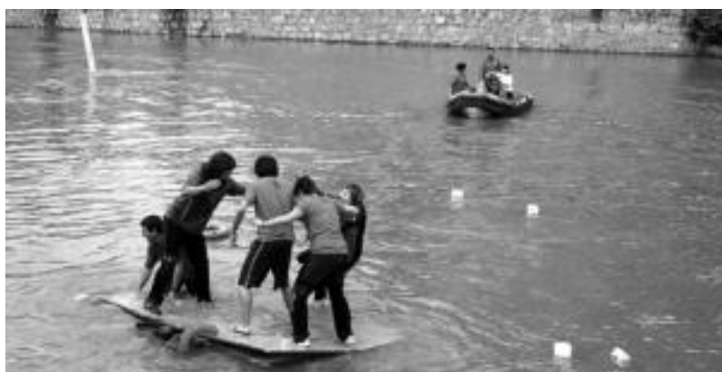
Baltzak ikusten jende ugari gelditu zen Oria ibaiaren bi aldeetan. Inpernuko gazteak Zerkausira igeri iritsi ziren. A. IMAZ