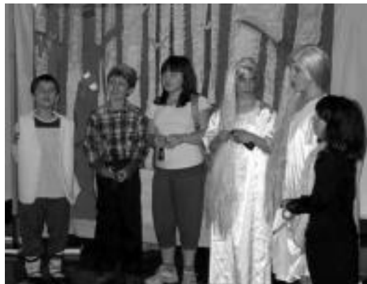
Herri Eskolako gaztetxoek antzezlan eskaini zuten Albizturren. E. EZEIZA

Amezketan, bestalde, 30 jubilatutik inguru bildu ziren goizean Zazpi-Iturri elkartearen hamaitetako egiteko. Arratsaldean, bertso-potea eta zahagi ardoa izan zuten, eta festak Itzel taldearen dantzaldiarekin izan zuten jarraipena gauetan.