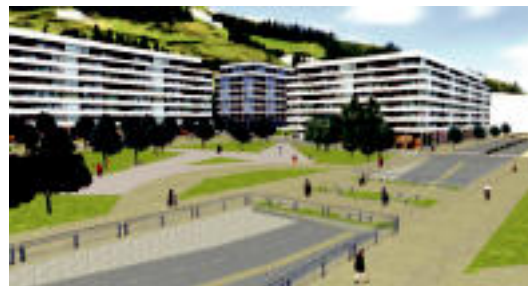
Voith-Gorostidi eremuaren inguruko urbanizazio proiektuko bi irudi. HITZA

publikoaren zereginak direla, esku-hartze estrategiko edota garrantzitsuetan behintzat», argitu du. «Lurralde antolaketa eta hirigintzak lurjabeen aurreikuspen eta beharrei erantzun behar die lehenik eta behin, edota herriaren garapen