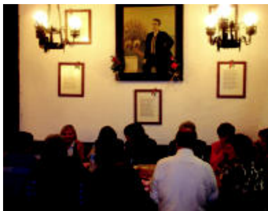
Ibilbidearen ostean Urkamendi Elkartearen bazkaldu zuten. HITZA