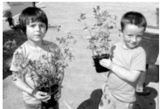
Udaletxeko balkoia apainduko dute Albizturko umeek. HITZA

Amezketan, taldea ateratzea kostabazitzaie ere, balantze positiboa egin dute. Nagusiek erakutsitako maila eta partida ikusgarriak aipatu ditu Xalton Zabala arduradunak. Final laurdenetarako txartelik lortu ez badute ere, datorren urterako eskarmentua hartzeko balio izan diela aipatu dute.