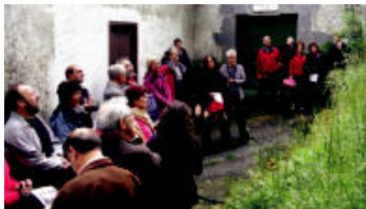
Otañoren aztarnari jarraituz ibilbidea egin zuten igandean.