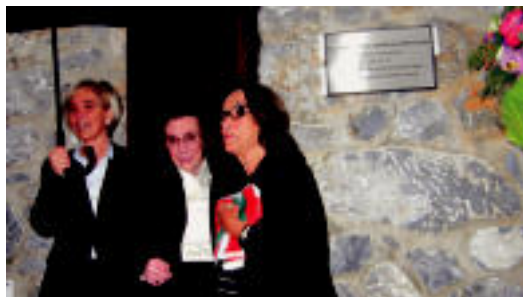
Plaka berria agertu zuten unean. Alkatea eta bi bilobak.