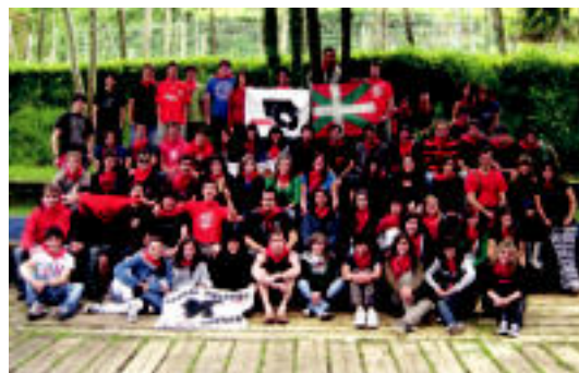
10. urteurrenean, belaunaldien festa ospatu zuten Anoetako gazteek. HITZA

eginez, 09:00etan hasiko dute eguna. Ondoren, 12:00etan, patata tortila lehiaketa egingo dute eta 14:00etan, gazte guztiak mahaian bueltan bilduko dira bazkalitzeko.