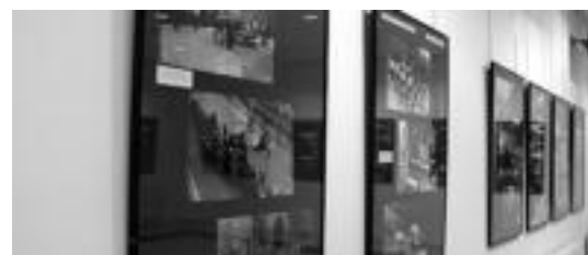
10:30etik 13:00era eta 15:30etik 21:00etara dago zabalik. E EZEIZA