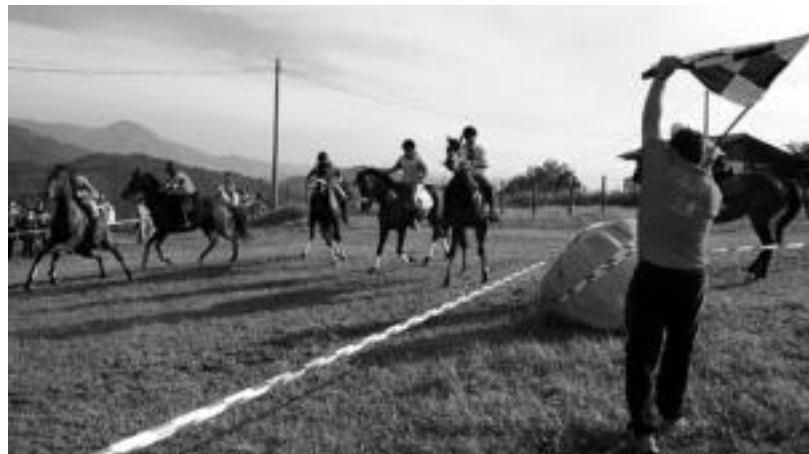
Hilaren 22an jokatuko da aurten, Izaskun auzoko belazeetan, zaldi lasterketa.